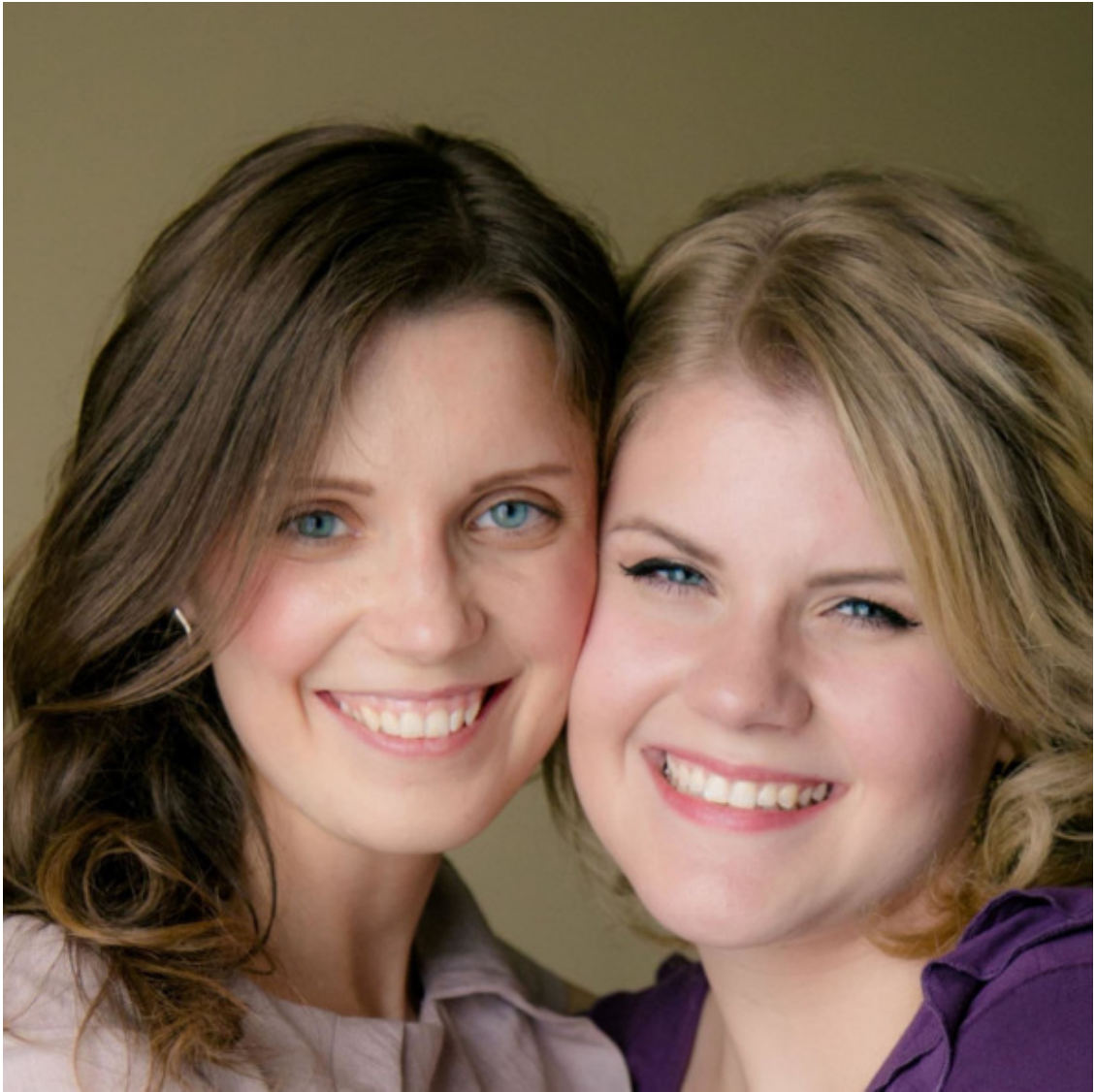
Su jaunesne seserimi.