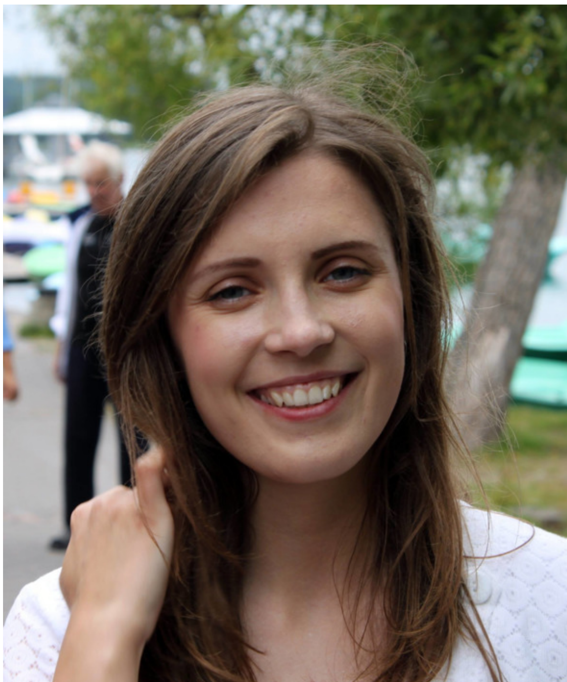
Raskite mane «LinkedIn»