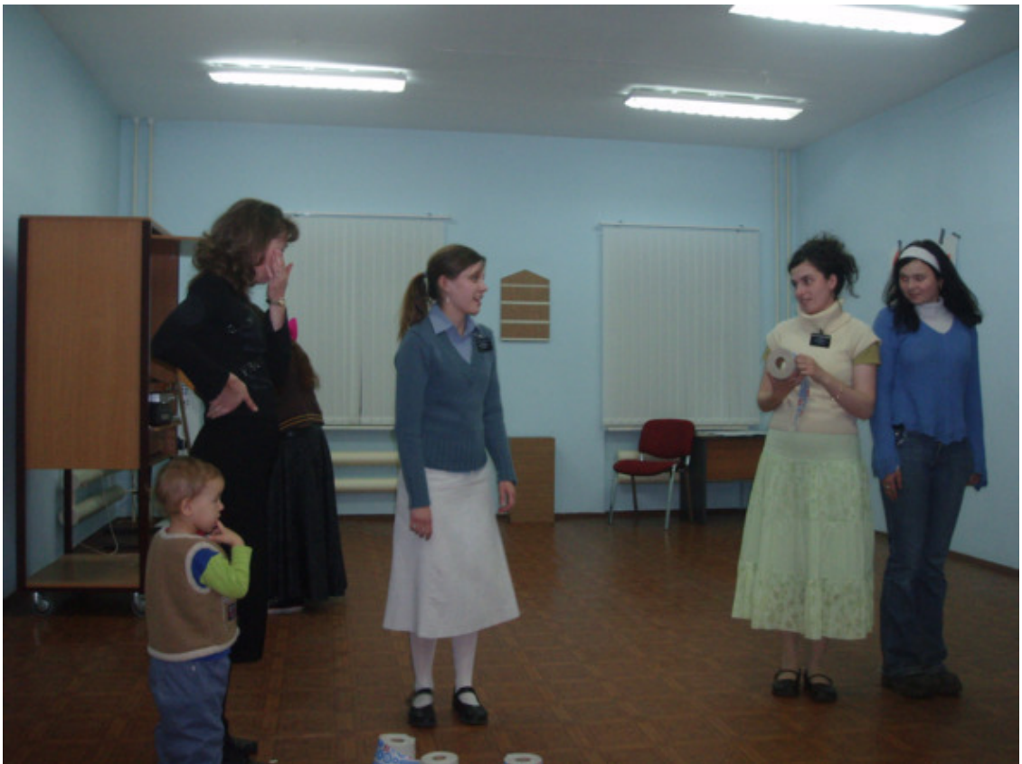
Aš būsiu pirmas!