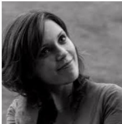
Aš naudoju «Skype»!