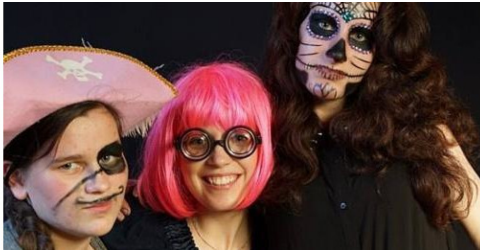
«Karibų piratai» teatre!