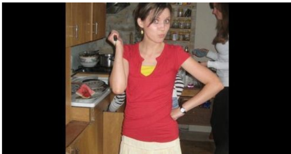
Arbūzas ir peilis!