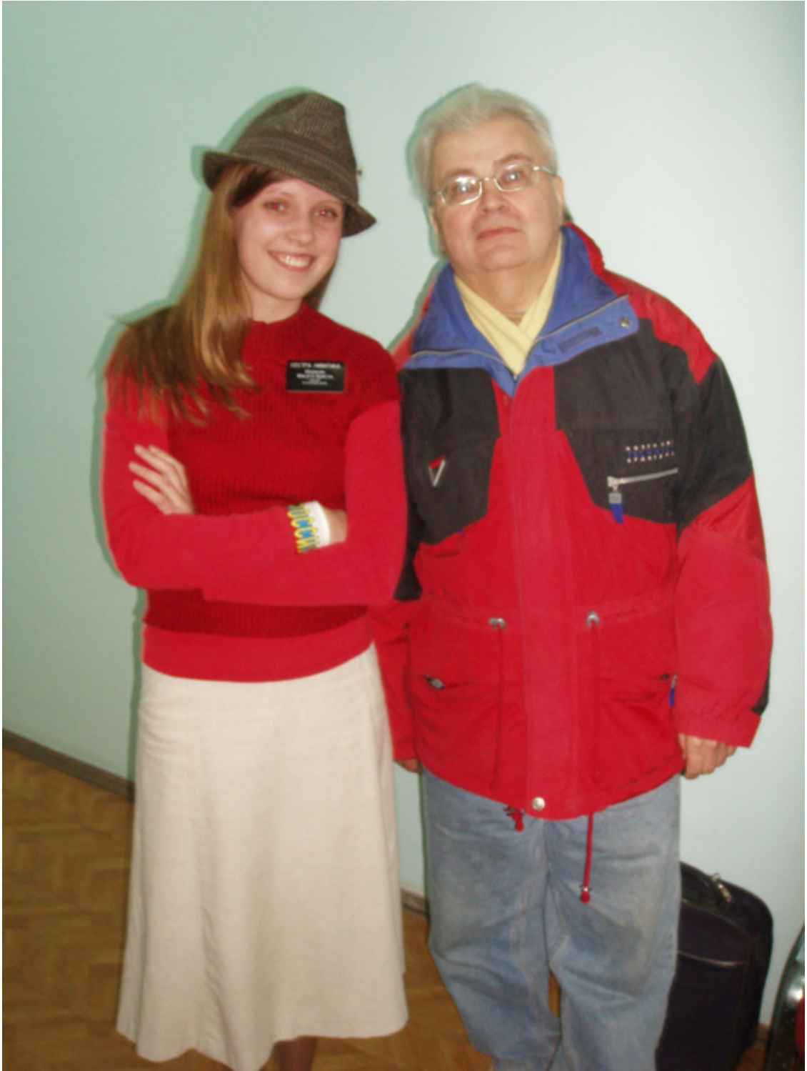
Anglų klube «Mormons». 2006 metai