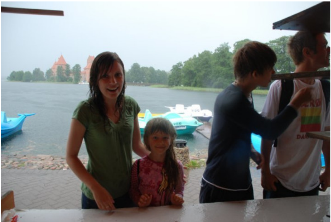
Visi šlapi ir alkani!