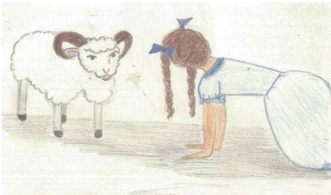
Косичка и барашек

Стали они тогда бодаться, кто кого переупрямит. Но вот незадача: пока они упирались лбами, косички нашей принцессы намотались на рожки барашка. Пришлось им так и идти дальше вместе. А пошли они к доброму парикмахеру пану Пакле. Как только пан Пакля увидел нашу парочку, он сразу понял, что косички придется отрезать. Распутать их было просто невозможно! И как принцессе не было их жалко, пришлось ей согласиться. Не ходить же ей всё время голова к голове с барашком... Это же ужасно неудобно! Да-да, вот попробуйте-ка сами!