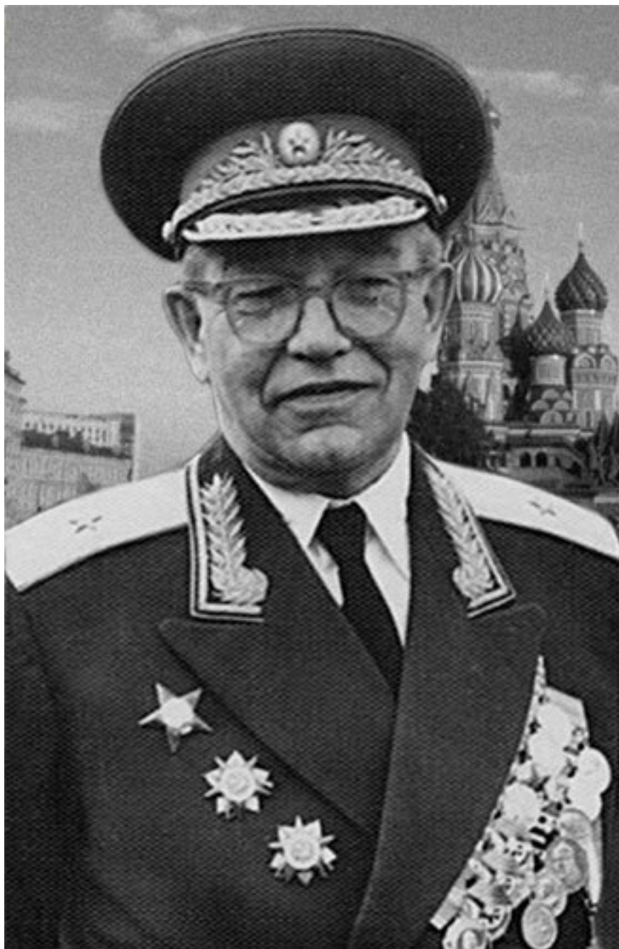
Это мой папа (фото 1975 г.)

Прошло время, и он сказал нам, что мы можем его поздравить: он стал кандидатом исторических наук.