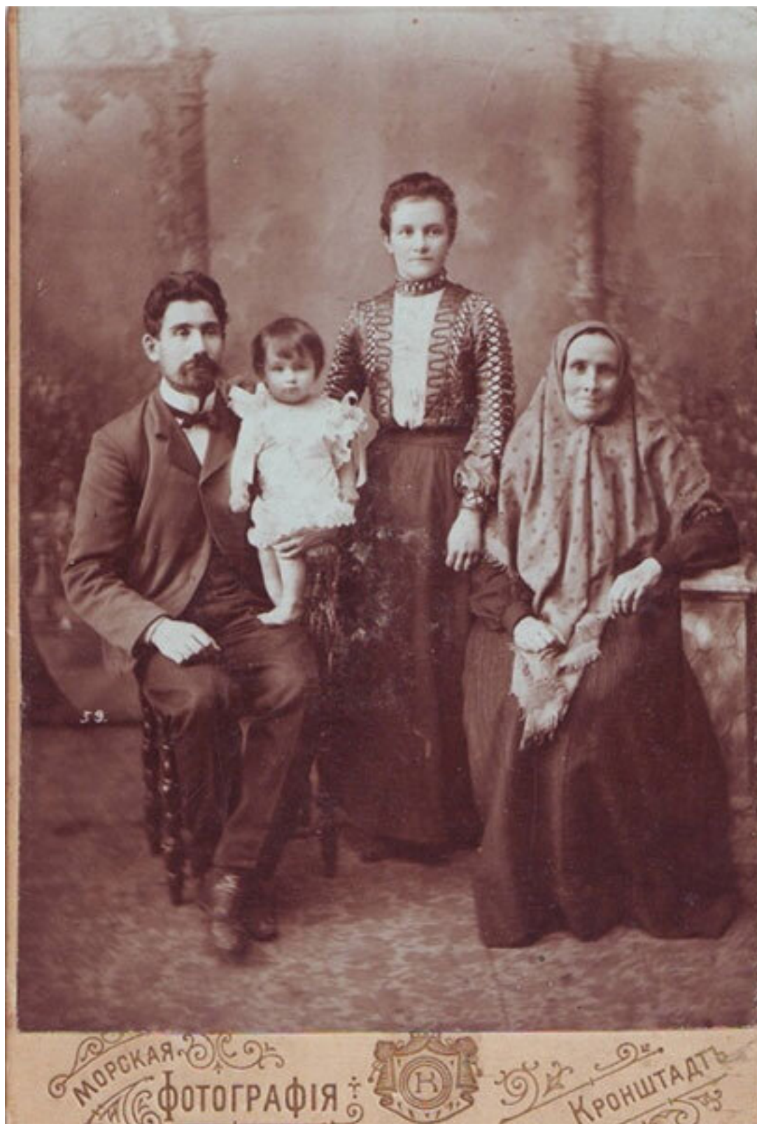
Мой дедушка и бабушка (стоит) на руках моя мама фото 1906 года

Дед попытался ее урезонить, мол, что ты говоришь, какие трупы. Но бабушка настаивала на своем. Они ушли из театра. Через некоторое время в Кронштадте произошло восстание матросов, и многие офицеры были расстреляны. Для близких, бабушка могла определить – хороший перед ней человек или плохой. Стоит выходить за того или иного человека замуж или нет. Бабушка никогда не работала. Ее главная «работа» было в том, чтобы в доме всегда