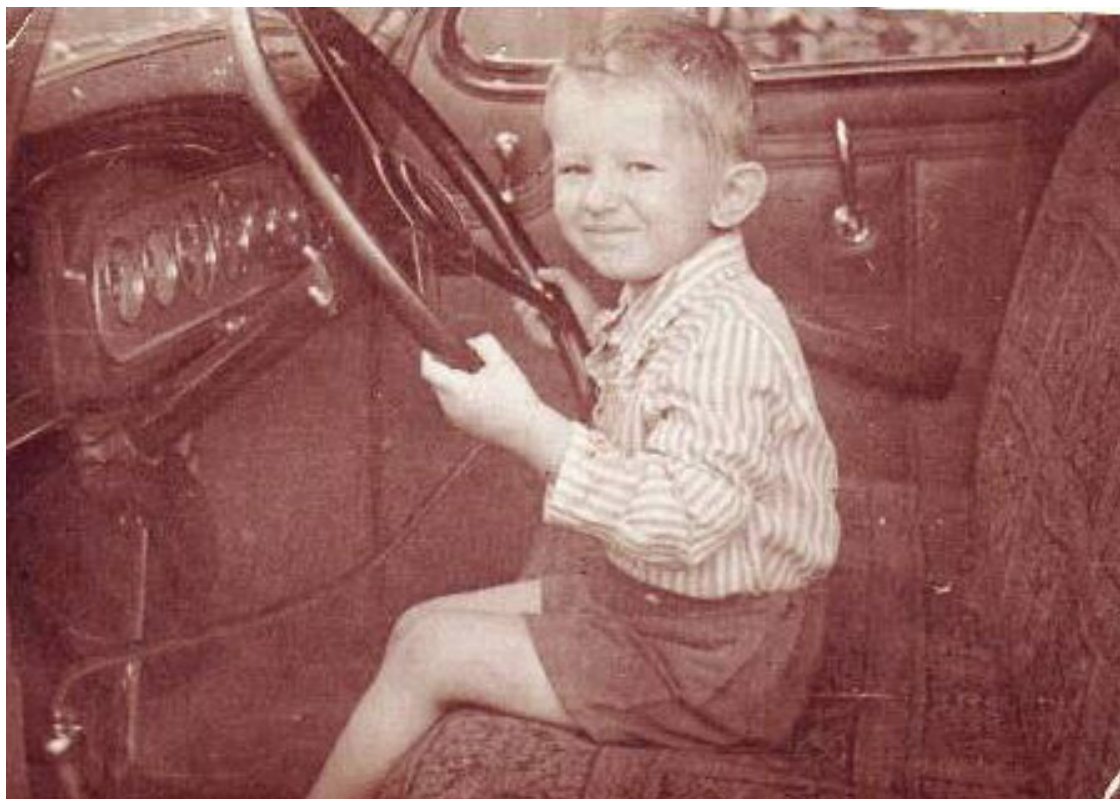
С детства меня тянуло к машинам.

Может быть, раньше в нем и шли большие, игровые фильмы. В мое же время это был кинотеатр хроникально-документальных и научно-популярных фильмов. Название кинотеатра говорит само за себя: «Новости дня» – так назывался очень популярный в то время, регулярно выходивший хроникально-документальный киножурнал. Позднее этот журнал на телевидении заменили такие передачи, как «Время», «Сегодня», и другие новостные программы. Кинотеатр находился около моего дома в начале Тверского бульвара. Цены на билеты туда были очень низкие. Когда была возможность и денежка, я всегда уходил в «Новости дня». Мне было очень интересно все: и что происходит в стране, как развиваются науки, и какие открытия сделаны в различных сферах... Конечно, любил я и мультфильмы. Несколько раз я смотрел фильм о Параде Победы в 1945 году. Кинотеатр «Новости дня» оказал очень большое воздействие на мое мировоззрение, и на мой кругозор. Сейчас, к сожалению, ни этого кинотеатра, ни окружающих его домов больше нет. Очень жаль, что их снесли, они имели историческую ценность. На их месте разбит Новопушкинский сквер.