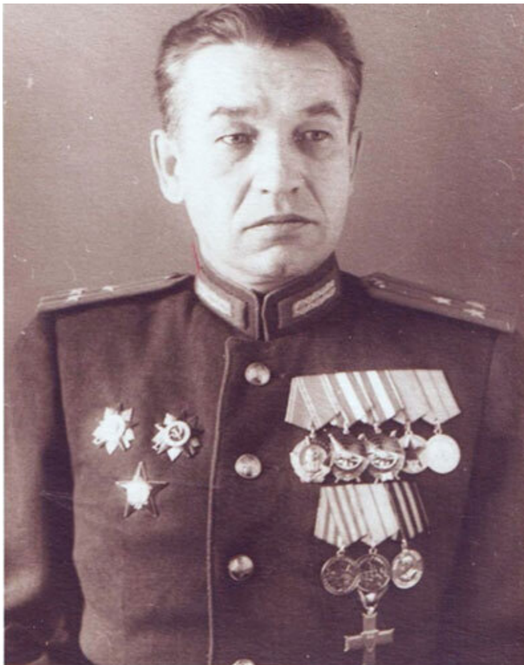
Это мой папа (фото 1943 г.)

Позднее, уже в мирное время, отец взял меня, школьника, с собой в путешествие на теплоходе по Волге. Когда мы проплывали мимо Волгограда, он на палубе очень оживился и все показывал мне: вот там стояли наши части, там стояли танки, а там были немцы. Было видно, что отец как будто заново все переживает.