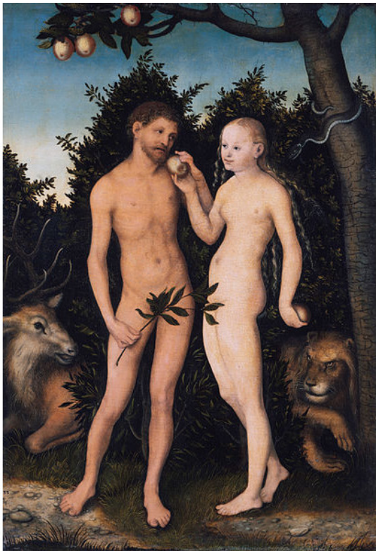
Лукас Кранах Ст.