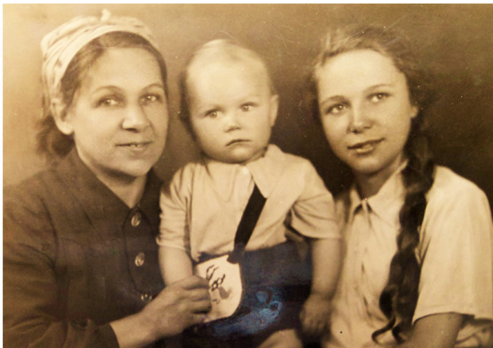
Фото 1948 г. Ленинград. Мама, сын и дочь.