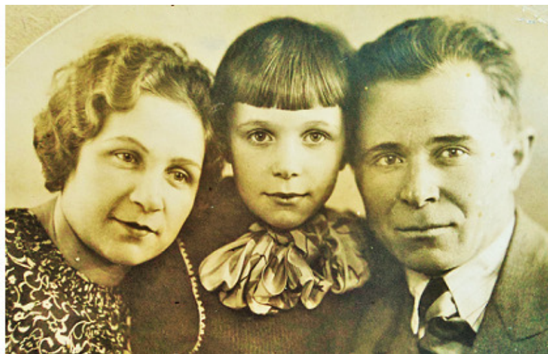
Фото 1940 г.

4 июля 1941 года отец записался в Народное ополчение. Дома остались жена и маленькая дочь.