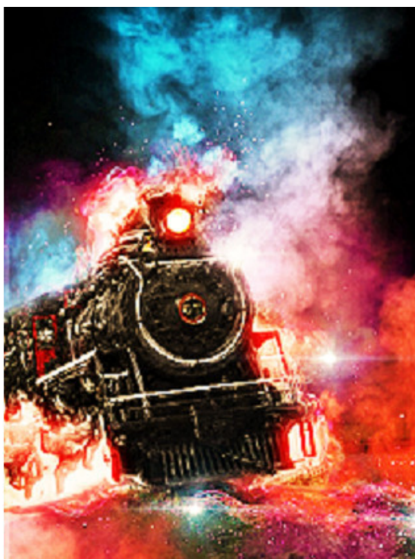
Поезд на восток

Большое скопление составов вызывало тревогу у начальника нашего поезда. Он был в звании полковника и, как показали дальнейшие события, фактически настоящий полковник. От него поступил приказ: двери теплушек не открывать, из вагонов не выходить, готовиться к отправлению. После очередного отказа выпустить поезд, который по значению приравнивался к военному, полковник сам отдал все необходимые распоряжения и спас состав. Когда поезд отошёл на достаточно большое расстояние, небо над станцией озарилось разрывами бомб и горящими вагонами.