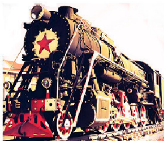
Поезд на запад

Осенью 1945 года за женой и дочкой приехал папа. Успешно выдержав бой с «окопавшимися тыловыми крысами» в администрации вокзала, он получил посадочные билеты на поезд и все поехали домой.