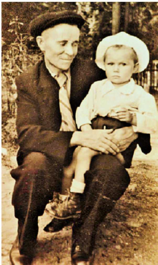
Фото 1948 – 1949 гг.