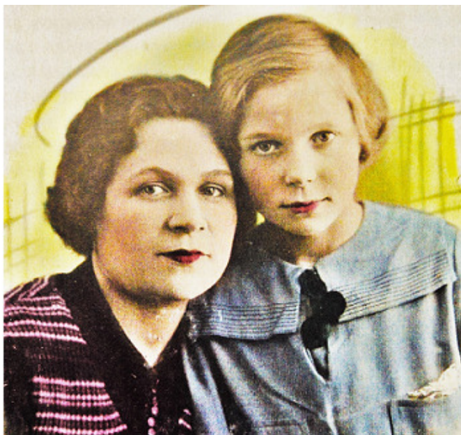
Фото 1941 г. Казань