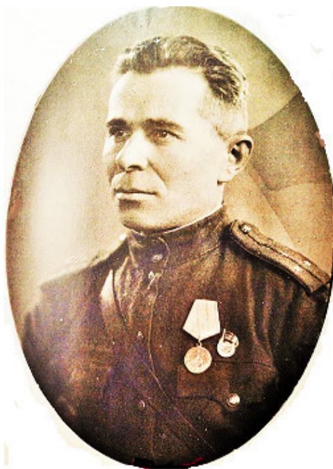
Фото по случаю награждения (22.12.1942) медалью «За оборону Ленинграда».

В апреле 1943 года под Псковом – третье ранение. На подступах к селу Богданово наступающая пехота заняла немецкие окопы. Враг готовил контратаку. Для встречи немцев нужен был пулемёт. Ближайший станковый пулемёт занимал позицию в стороне от предполагаемого направления атаки под нашим подбитым танком. Расчёту было приказано сменить позицию. Надо было продвинуться на расстояние не более 50 метров. Но немцы заметили манёвр и открыли пулемётный огонь. Оба солдата были убиты. Тогда отец сам решил дотащить «Максим». Через несколько прыжков он оказался у пулемёта, который весил 65 килограммов. Было очень грязно и скользко. Ползком пулемёт тащить не удалось. Пришлось встать и двигаться рывками. Один рывок получился удачным. Только поднял голову для второго рывка, пуля попала в переносицу. Стрелял снайпер.