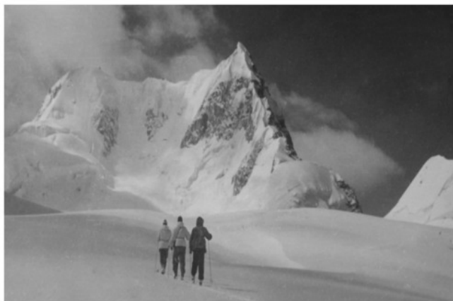
На пер. Абдукагор