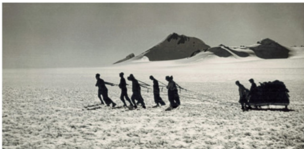
За неимением собак.