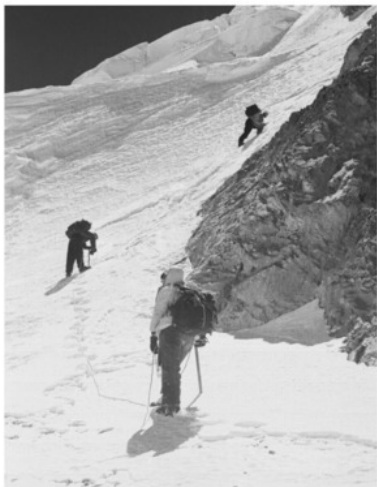
На маршруте на пик Фиккера.