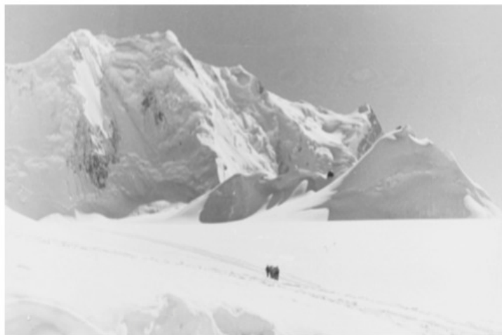
"Белое безмолвие". Верховья лед. Федченко.