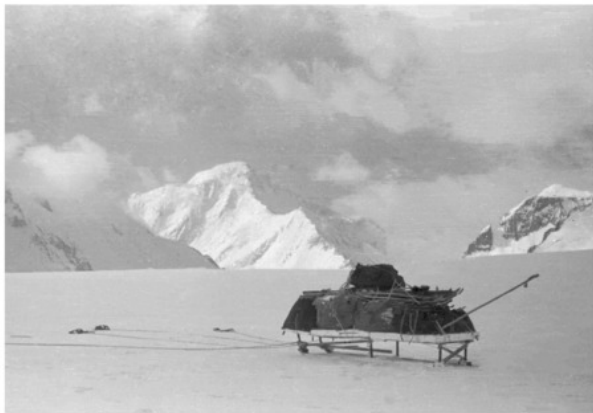
Сани на фоне пика 26-ти Бакинских комиссаров.