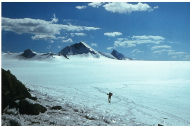
Верховья ледника Федченко