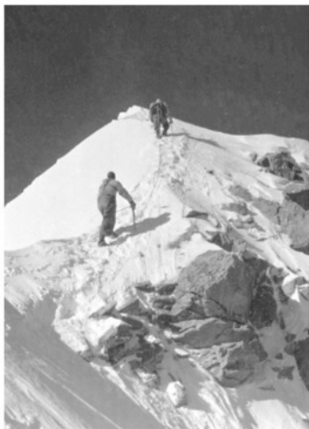
Восхождение на пик Фиккера.