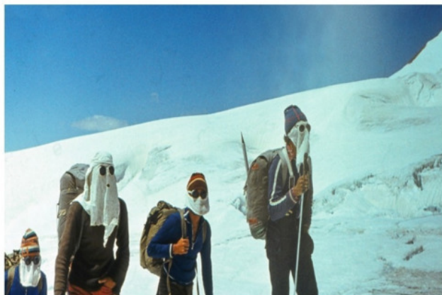
Верховья лед. Федченко