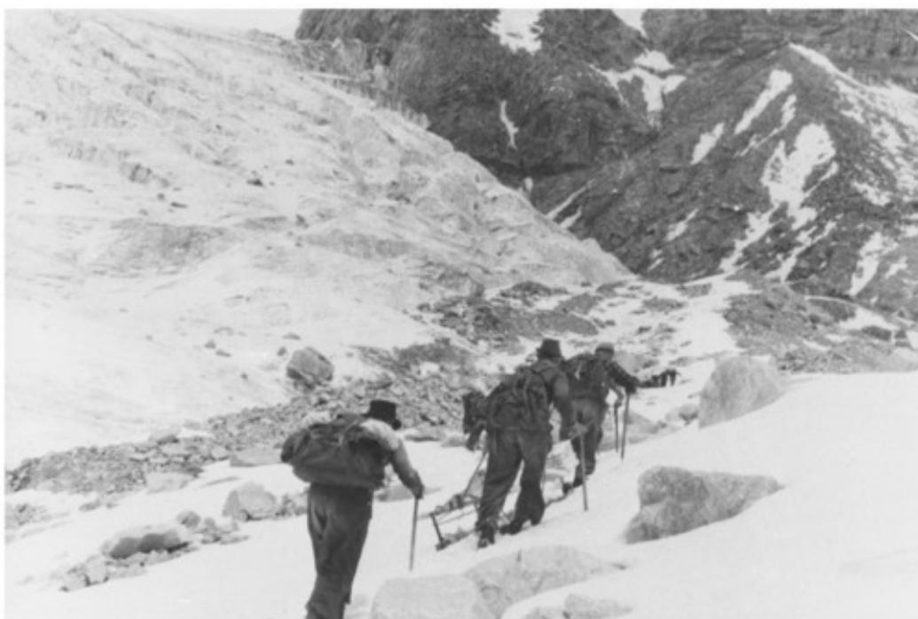
Доставка груза к лагерю.