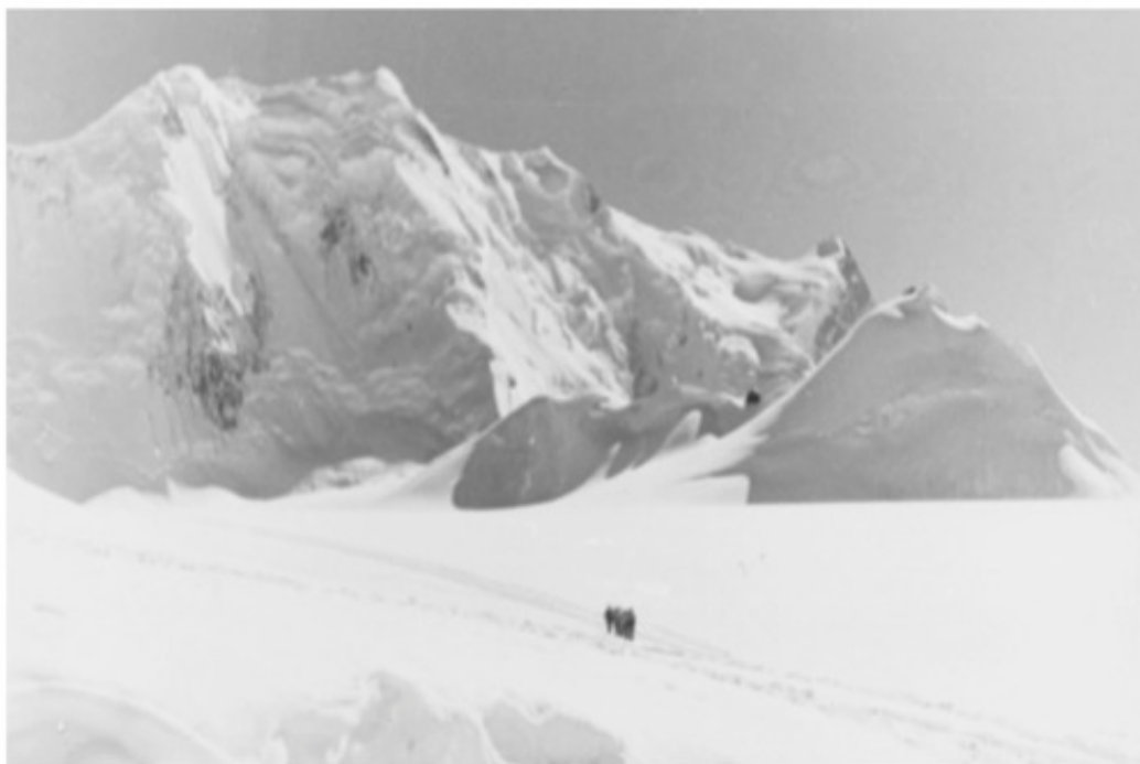
"Белое безмолвие". Верховья лед. Федченко.