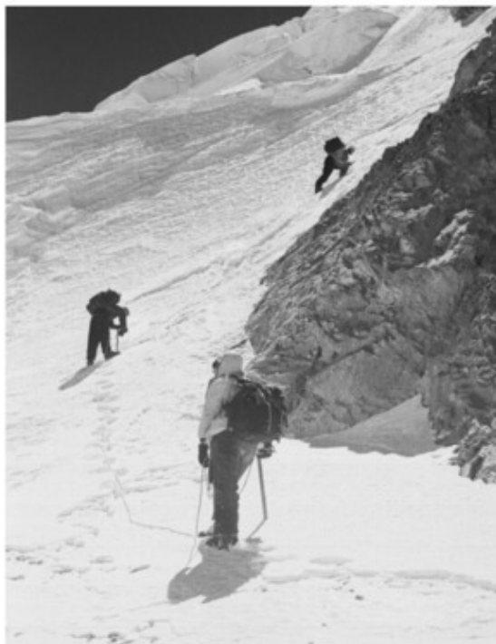
На маршруте на пик Фиккера.