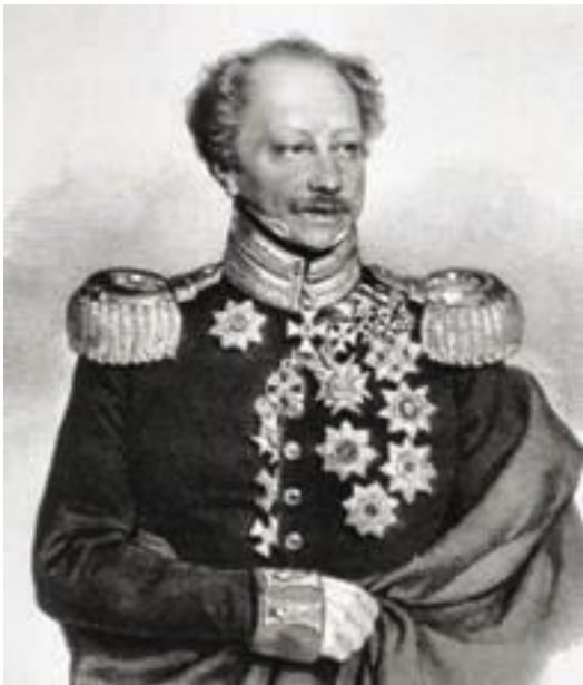
Фридрих Карл фон Теттенборн.

Население встречало казаков с ликованием. Благодарные горожане присвоили русскому офицеру звание почётного гражданина Гамбурга и торжественно вручили ему ключи от города. Известие об освобождении Гамбурга вызвало анти-французские выступления во многих других немецких городах