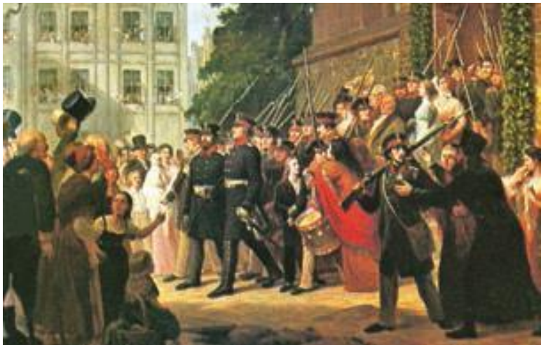
Г. Греф. Прусское ополчение выступает в поход.

Состоятельные прусские женщины приносили на сборные пункты свои золотые украшения и драгоценности, отдавая их на снаряжение армии. Нередко взамен они получали простые железные кольца, на которых была выбита надпись: «Gold gab ich für Eisen» (Я дала золото на железо). Носить такие кольца среди дам считалось очень модным и патристичным.