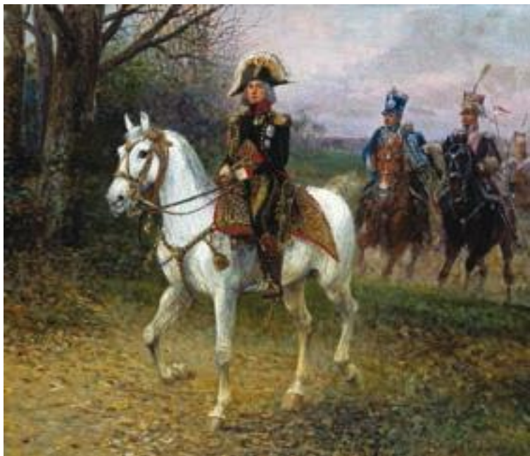
Я. Хельминский. Маршал Бессьер с эскортом.

Первое боестолкновение произошло 1 мая. Большого значения оно не имело, но в ходе артиллерийской дуэли случайным ядром был убит командующий гвардейской кавалерией Наполеона маршал Бессьер. Оттеснив русских, французы заняли Лютцен. Здесь расположились главная квартира французского императора и его гвардия.