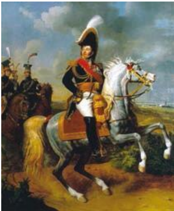
Генерал Жан Рапп

За короткое время практически вся территория этого королевства от французов была освобождена. В одном из писем того времени Кутузов писал своим близким: «Дай Бог, чтобы тринадцатый год кончился так же счастливо, как начинается». В победу фельдмаршал верил твёрдо. Под контролем неприятеля оставались лишь редкие города, где на-