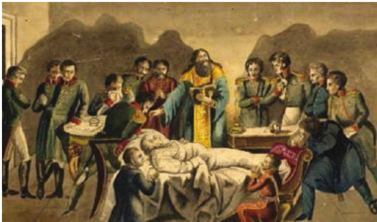
И. Ефимович. Кончина Кутузова.

Поход продолжился. В конце марта союзные войска заняли Дрезден – на тот момент столицу формально нейтрального королевства Саксония. В начале апреля передовые части союзников вошли в Лейпциг. Сюда двинул свои части и Наполеон. Почти год территория этой несчастной страны будет служить театром военных действий, а её население одинаково страдать и от французских войск, и от солдат коалиции.