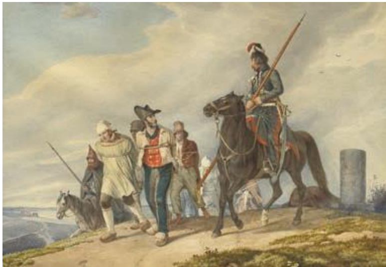
П. фон Гесс. Казаки конвоируют пленных французов.

Она просто за ней не поспевала. Более того, враг не имел никакого представления о численности наших отрядов. Партизаны же всегда владели самой полной информацией о предполагаемых действиях неприятеля, поскольку перехватывали вражеских курьеров с пакетами и донесениями, регулярно переправляя их в ставку Кутузова. Об успехах этой деятельности свидетельствует и тот факт, что незадолго до падения Берлина летучие отряды уже контролировали все дороги вокруг столицы прусского королевства.