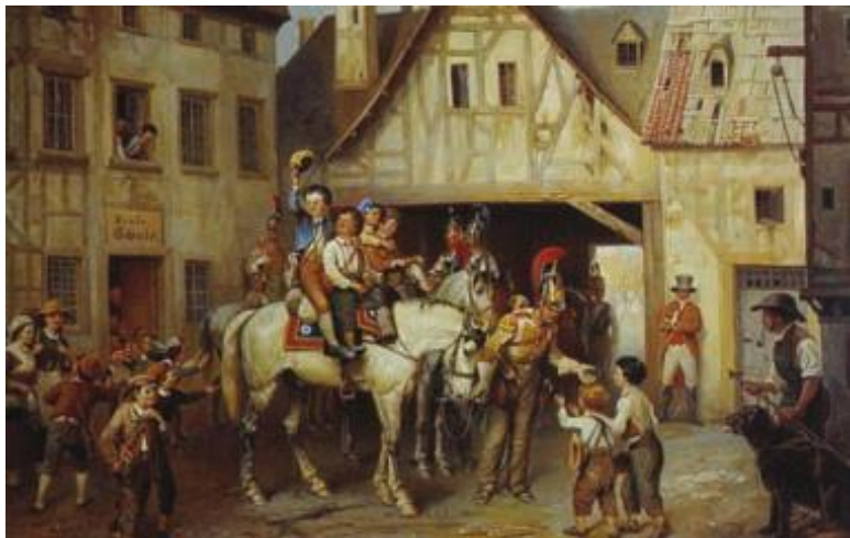
Б. П. Виллевальде. Лейб-гвардии конный полк в немецком городке.

Боевые действия русские войска начинали в одиночку. Правда, с наполеоновской Францией ещё воевала Великобритания, но их противостояние проходило на морях и в далёкой Испании. Несмотря на поражение французов в России большинство европейских стран или оставались верными союзу с императором Франции, или пока занимали выжидательную позицию.