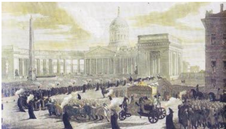
М. Воробьёв. Похороны Кутузова.

Похороны состоялись 25 июня. Погода в тот день была холодной и дождливой, но по всему пути прохождения траурного кортежа стояли толпы народа. Внесённый в собор гроб установили на пышный высокий катафалк, сооружённый по проекту архитектора Воронихина и украшенный трофейными знамёнами и штандартами. Прощание с полководцем длилось три дня. И всё это время не иссякал поток людей, желающих проститься с великим человеком. В момент опускания гроба в могилу полки, стоявшие на Невском проспекте, произвели троекратный салют. Могилу закрыли гранитной плитой и обнесли кованой оградой.