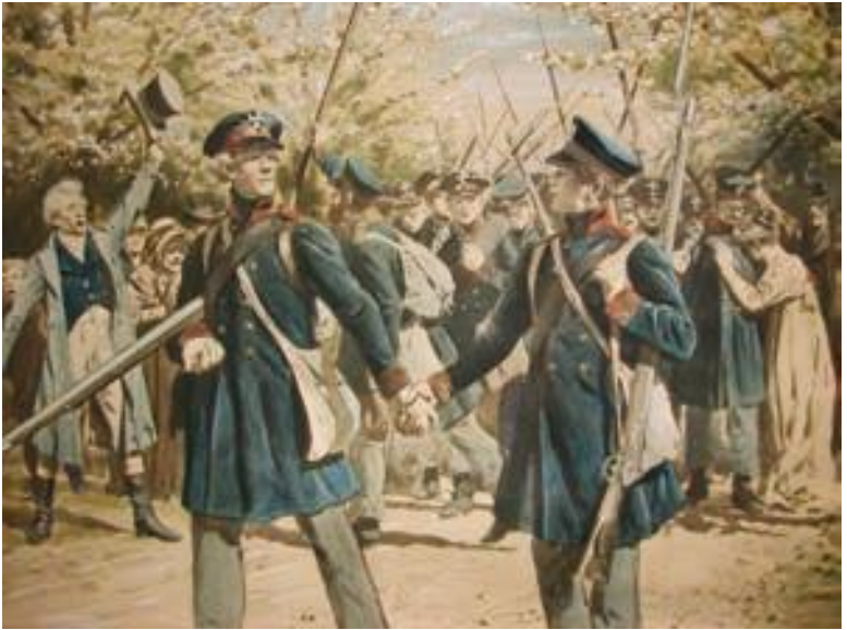
К. Рёхлинг. Прусский ландвер.

Новобранцы проходили ускоренную подготовку. Молодёжь шутила, что вся она заключалась в исполнении всего двух команд: «Вперёд!» и «Пали!».