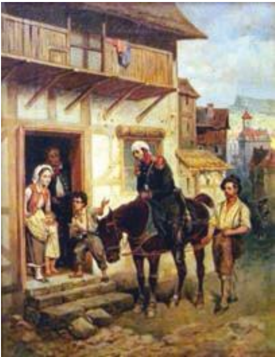
Б. П. Виллевальде. Раненый русский офицер.

Когда в войну вступила Пруссия, в летучих отрядах стало всё больше появляться немецких офицеров. Так русским было проще находить контакт с местным населением. Трений и раньше не возникало, а теперь русские и пруссаки вообще стали братьями по оружию, и население их всемерно поддерживало.