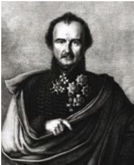
Вильгельм фон Дёрнберг

На следующий день, узнав о подходе превосходящих сил противника, Дёрнберг и Чернышёв увели своих солдат за Эльбу. В Люнебург вновь вошёл неприятель. Сто горожан из числа ополченцев были арестованы, им грозила казнь. Но французы получили уведомление, что, если кто-то из жителей пострадает, все их соотечественники, находящиеся в русском плену, также будут расстреляны. Вскоре заложников освободили, а ещё через день французы ушли из города.