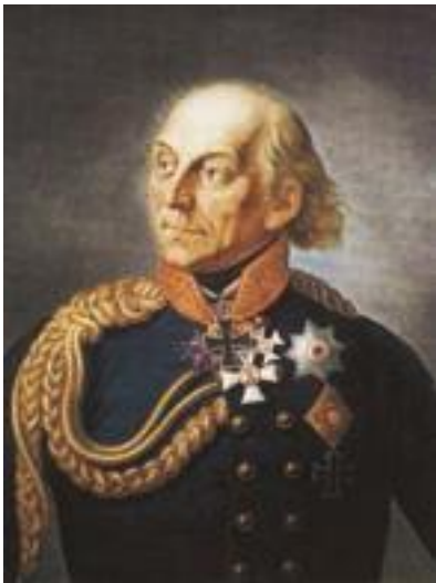
Генерал Йорк фон Вартенбург

В конце января прусский корпус генерала Йорка оказался отрезанным от основной массы французских войск. Желанием гибнуть за Наполеона пруссаки и раньше не отличались, а теперь не хотели и вовсе. Командир корпуса договорился с нашим командованием о своём нейтралитете. Прусский король объявил о снятии Йорка с должности и... уехал из Берлина, где стоял французский гарнизон, в Бреслау, подалее от наполеоновского контроля.