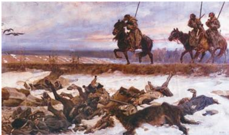
В. Коссаk. Весна 1813 года.

и излишне жестокими. Так, например, чтобы не иметь никаких хлопот с конвоированием, те просто убивали попавших в плен русских солдат, как это случилось под Гжатском. Англичане же обвиняли польских улан в том, что после битвы при Альбуэро в Испании те перекололи пиками всех раненых.