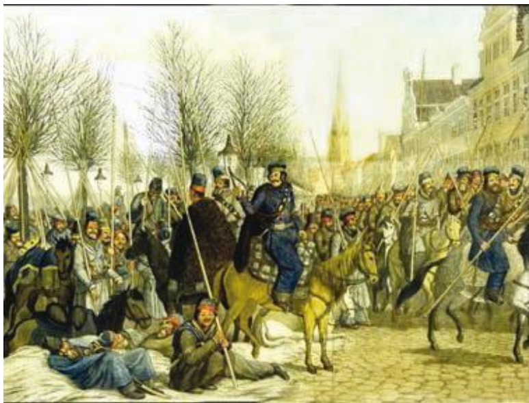
К. Зур, Х. Зур. Бивак казаков в Гамбурге.

отстранил Сен-Сира от командования и направил к городу корпус маршала Даву. Теттенборн сделал всё возможное и невозможное, чтобы удержать Гамбург, но силы были не равны. В конце мая русский отряд оставил город. Окончательно он был освобождён лишь год спустя.