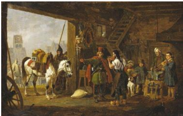
П. фон Гесс. Казаки у кузнеца.

реку Преголе. В плен попало до 10 тысяч неприятельских солдат, в основном раненых и больных. В городе были захвачены большие запасы продовольствия, снаряжения и фуража.