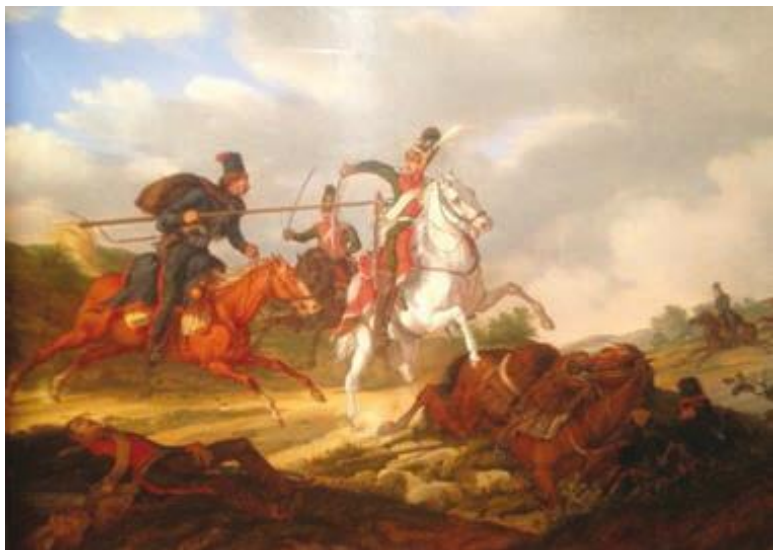
Ш. Лефевр. Кавалерийская стычка.

Французская пехота противопоставить носившейся по полям Польши и Германии коннице ничего не могла.