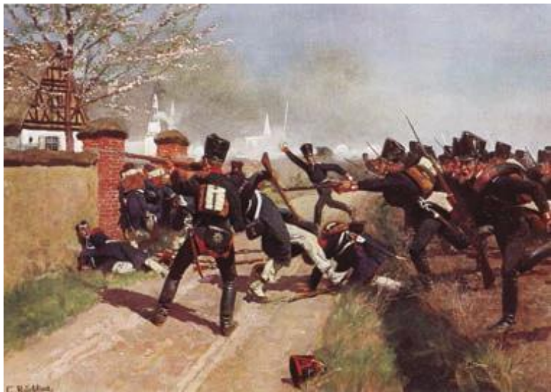
К. Рёхлинг. Сражение при Гросс-Тёршене.

но уступает по подготовке солдат и по числу орудий и кавалерии. Внезапность нападения, быстрота и решительность могли реально привести к победе, а отсутствие у неприятеля достаточного количества конницы снижало риск неудачи. Уклонение же от битвы ухудшало стратегическую обстановку и грозило потерей влияния на германские княжества.