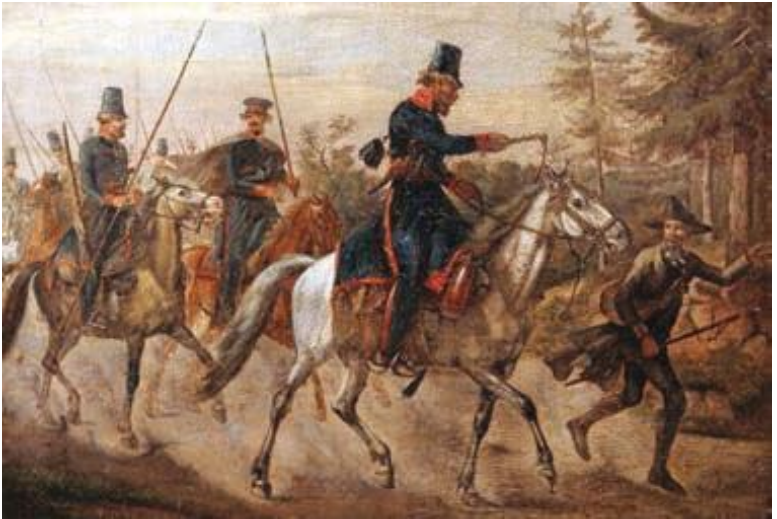
И. Клейн. Казаки и немецкий проводник.

За сутки объединённый отряд прошёл почти 70 вёрст. Его численность не превышала силы французов, но атака последовала незамедлительно. Наступали сразу с нескольких направлений. Бой у городских застав длился почти два часа, и нападавшим удалось ворваться в город.