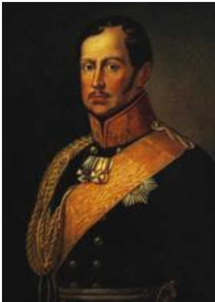
Фридрих Вильгельм Третий

Пока части французской армии находились на территории королевства, монарх опасался заявлять о своём разрыве с Наполеоном. Однако после того как сюда пришли русские войска, всё изменилось кардинально. Уже к весне 1813 года национально-освободительное движение в Пруссии приняло форму восстаний и партизанской войны. Отряды партизан, бившихся с французами, население именовало «чёрными тучами», однако такого размаха, как в России, народная война здесь, конечно, не получила.