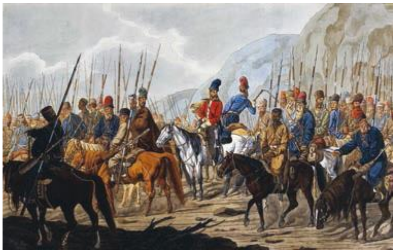
К. Э. Гесс. Русские казаки в походе.

планы императора, как всегда, оставались весьма амбициозными. Его военный гений после неудач в России нисколько не угас. Своим генералам он говорил: «От успехов русские осмелеют. Я дам им два, три сражения между Эльбой и Одером и через полгода буду снова на Немане».