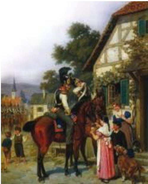
Б. П. Виллевалде. Утоление жажды.

Численность русской армии составляла 106 тысяч человек. И это были закалённые в победах и поражениях бойцы, изгнавшие из родной земли полчища врага. Первый раз попав за пределы отчизны, они любовались неизвестными пейзажами, дивились каменным домам в деревнях и достатку, в котором жили их хозяева – прусские крестьяне, бюргеры и ремесленники. Несмотря на то, что солдаты были измотаны долгим походом, их боевой дух был очень высок.