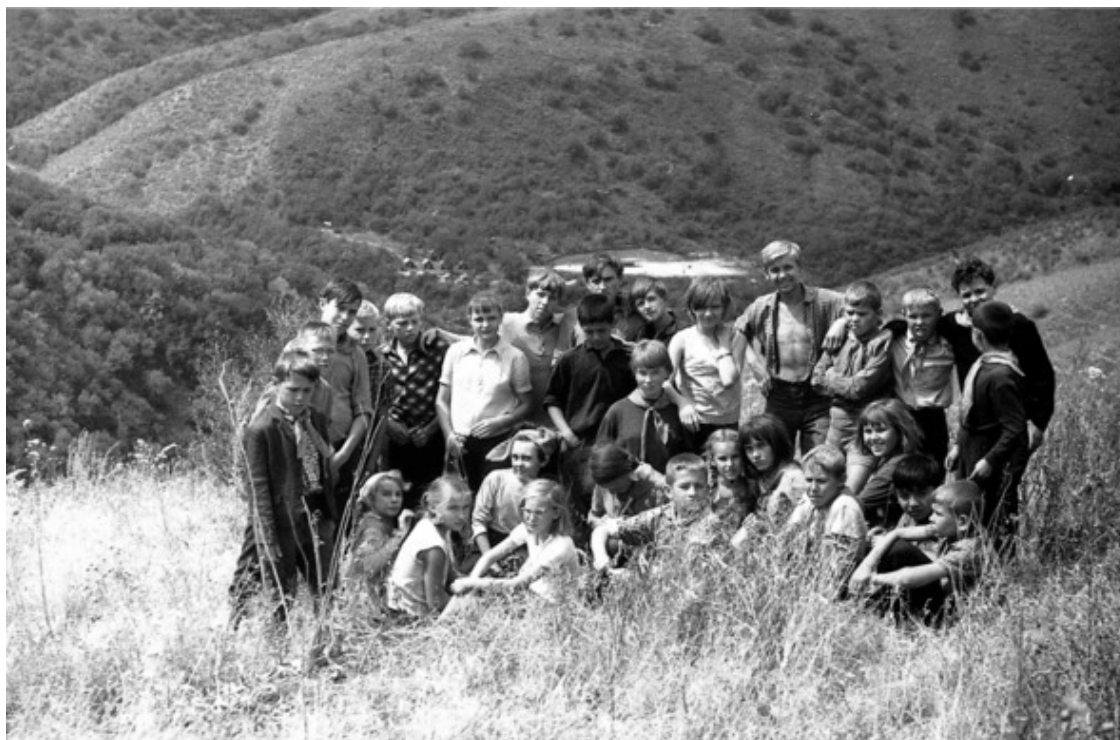
Конец 1960-х. «Кайнар». Фото на фоне лагеря. И эпохи.

Вот и наши пионерлагеря были для «них» лишь очередным проектом, вышедшим из недр ГУЛАГа, символом тоталитарной детской несвободы в СССР. Почему «были»? Остались! Они ведь там не очень торопятся переоценивать ценности (если только негры какие-нибудь обиженные не притиснут их в темноте к стенке). Это своё «понимание», что уж совсем абсурдно, «они» продолжают активно навязывать сегодняшним внучатым отпрыскам советских «пионеров-лагерников».