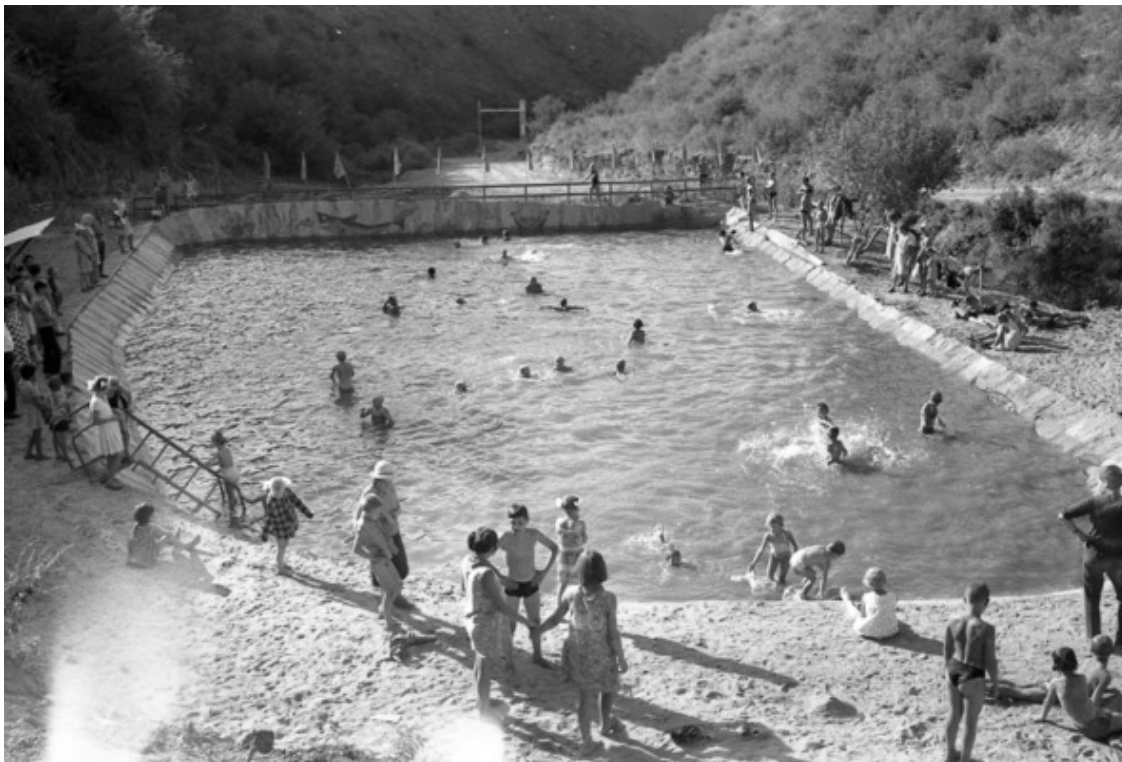
Конец 1960-х. «Кайнар». Бассейн.

даже закалённым в спортивных баталиях «физкультурникам». Когда энергия многих направлена в одну сторону, даже дети малые (а пионеры – тем паче) – уже страшная сила!