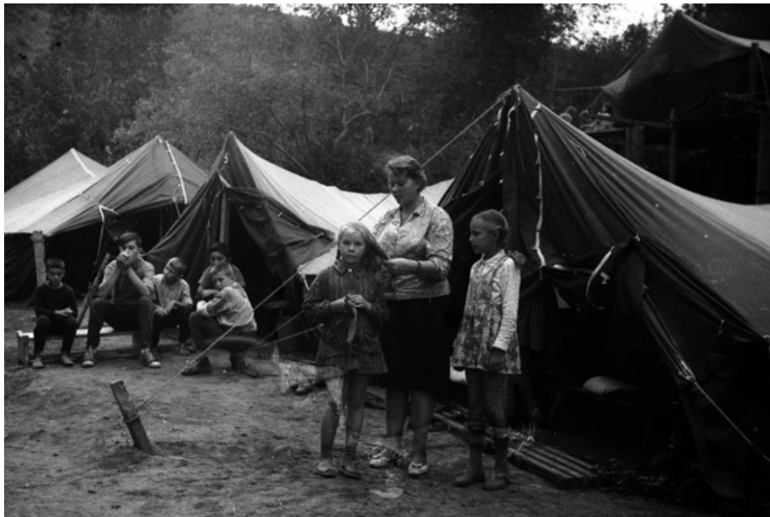
Конец 1960-х. «Кайнар» в первые годы существования. Счастливая жизнь в палатках.

Далеко не все советские ребята оказывались на поверку шибко самостоятельными. Бабушки, это вдовое наследие Великой Отечественной, в 50-е – 80-е годы прошлого столетия жили в каждой второй нашей семье. Они-то, сострадательные и всё умеющие, и ладили большую часть домашней работы, давая тем самым своим внукам возможность для того вождельно-полноценного детства, которого были лишены сами и которого не имели их дети, наши родители. Они же, бабушки, присматривали за чадами, в меру сил оберегая не только от лишней забот, но и пытались оградить от любых синяков и шишек.