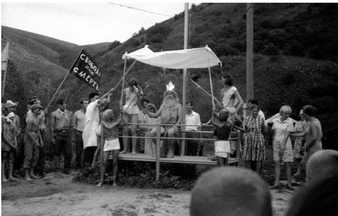
Конец 1960-х. «Кайнар». Праздник Нептуна.

Предпраздничное возбуждение захлёстывало юное воображение целиком и полностью. Перво-наперво – писался сценарий. Причём для сохранения интриги каждый отряд, придерживаясь лишь генерального замысла, готовился к действию в тайне от других, исходя из буйства своих фантазий и собственных возможностей. Когда же была готова и отрепетирована каждая роль, наступала долгожданная пора надевать костюмы и накладывать грим.