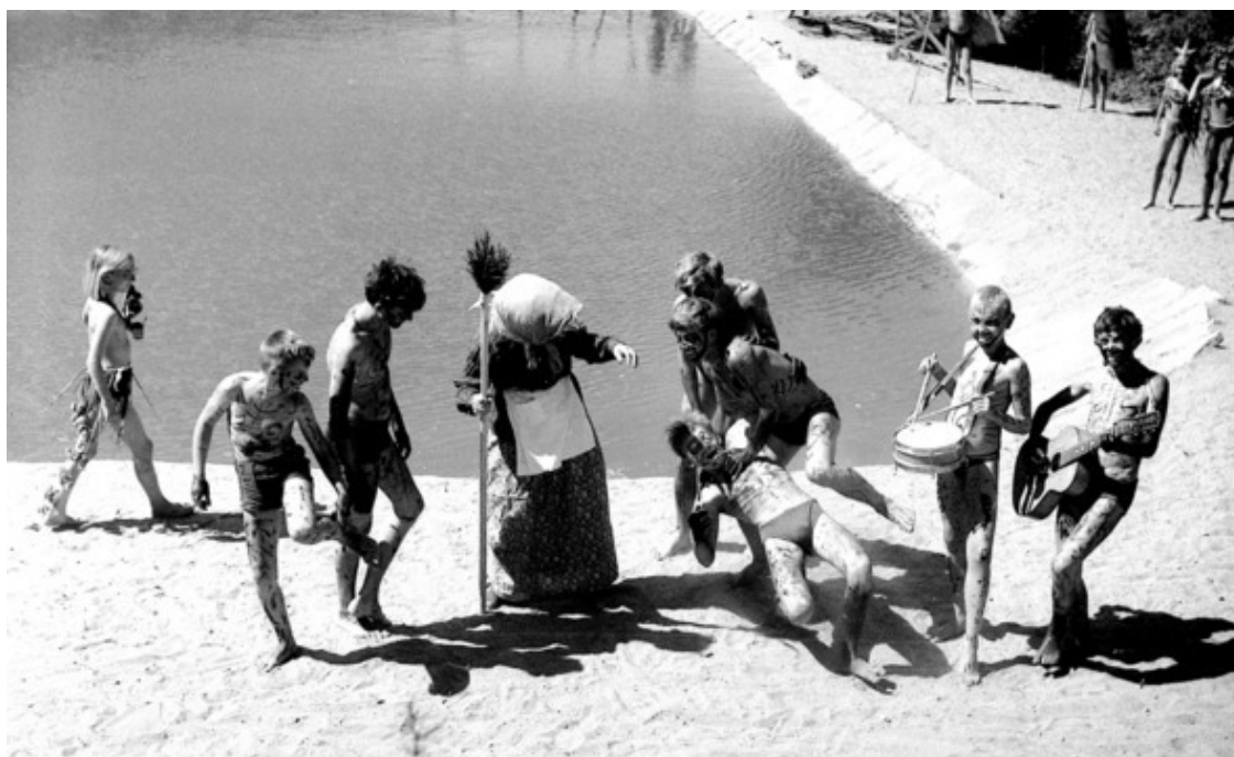
Конец 1960-х. «Кайнар». Праздник Нептуна.

Сценой действия и ареной праздника, разумеется, был лагерный бассейн. Или – в более счастливых вариантах – огороженный берег ближайшего водоёма (речки, пруда, озера). Ну, а для самых отличных отличников и выдающихся пионеров-ленинцев (в том числе и из стран народной демократии) – пляж всесоюзной международной детской здравницы на южном берегу Крыма.