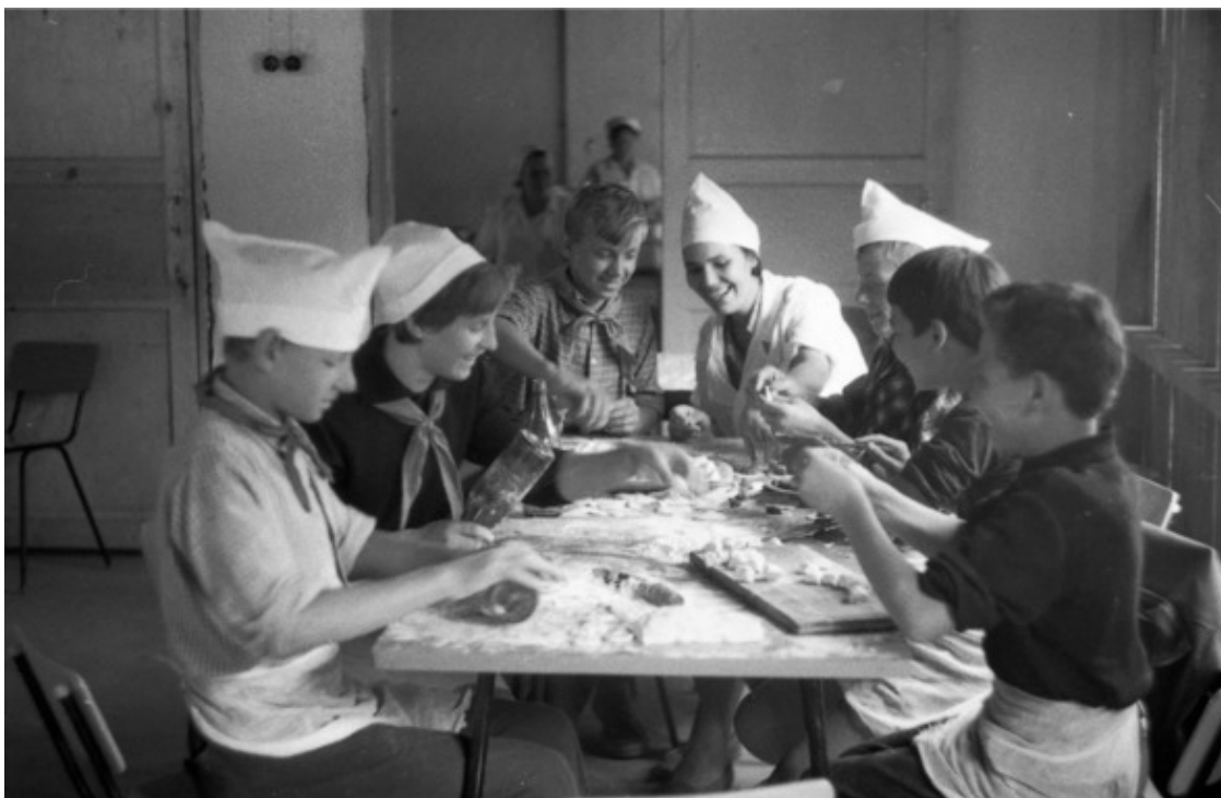
Конец 1960-х. «Кайнар». Лепка пельменей.

Как свидетельствуют приводимые здесь «кайнаровские» снимки, по крайней мере самые старшие были задействованы в более ответственных операциях, таких, например, как лепка пельменей. Не исключено, что для многих эти пельмени были первыми вылепленными в жизни! Если даже считать, что к обеду в лагере подавалась детская порция из 10 пельмешков (но – крупных!), на ораву в 150 человек их предстояло приготовить полторы тысячи!