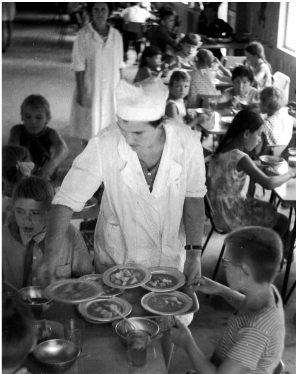
Конец 1960-х. «Кайнар». Обед из 3-х блюд.

Я выше сказал, что мы не голодали. Но это не значит, что здоровое чувство голода, всегда сопутствующее задорной младости, не было нам знакомо! Было, ещё как! Особенно тут, вдали от дома, где жизнь представляла собой неуёмную беготню на свежем воздухе и хаотичное движение на фоне природы.