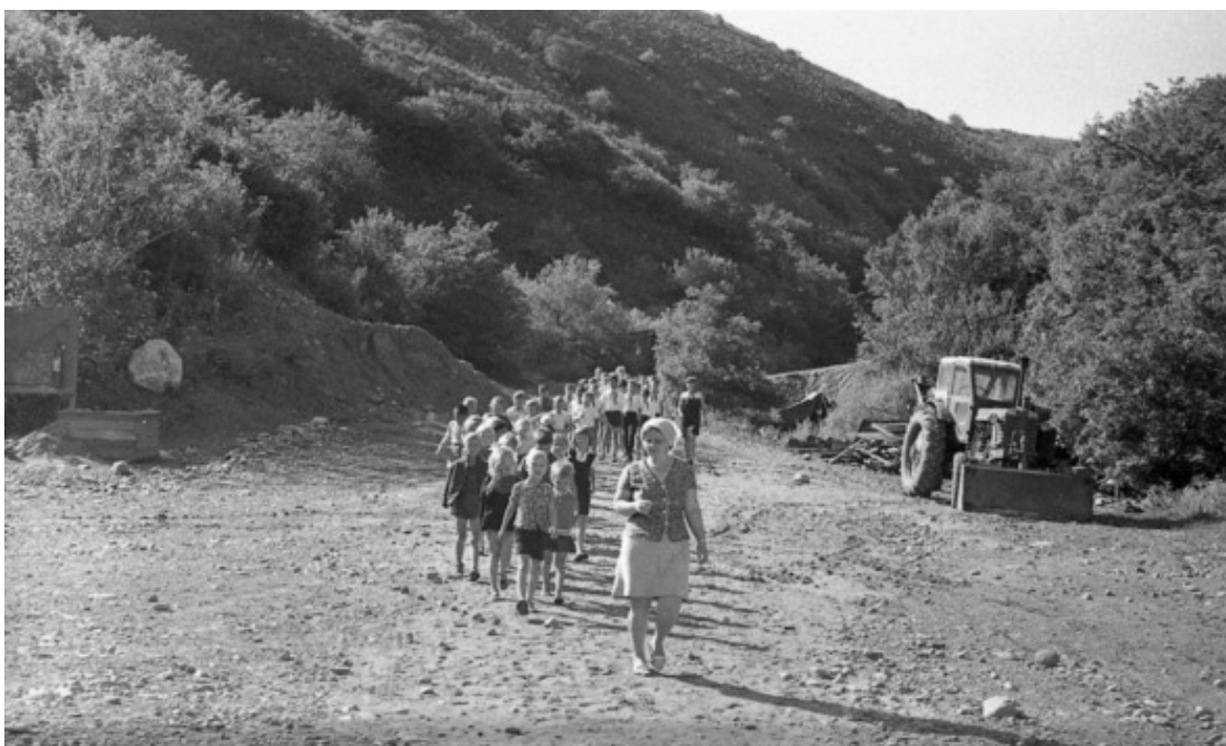
Конец 1960-х. «Кайнар». Строем на завтрак.