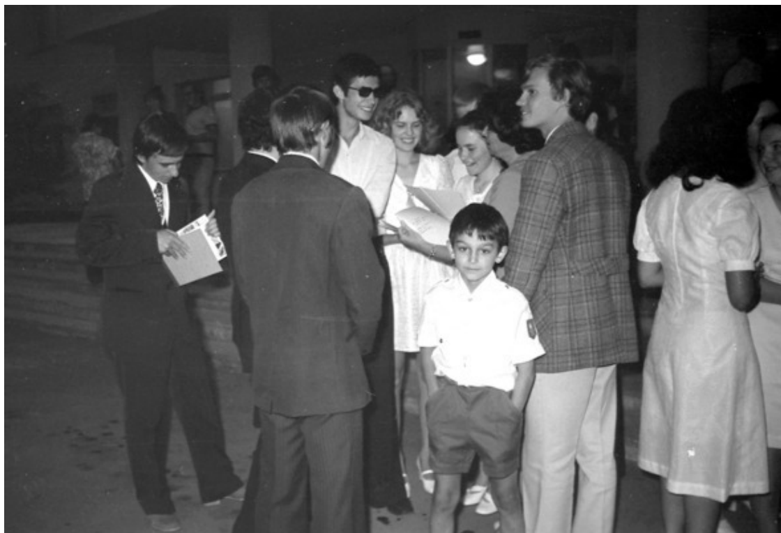
26 июня 1975 года. Выпускные торжества в Посёлке.

А вскоре, буквально на следующий год после нашего окончания, у выпускников появилась ещё одна символическая песня-расставание. Ещё один «Школьный вальс» из популярного фильма «Розыгрыш» стал непременно звучать для всех новых поколений выпускников: