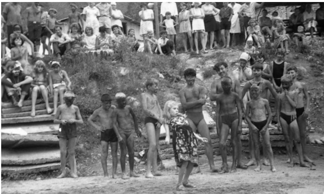
Конец 1960-х. «Кайнар». Праздник Нептуна.

Праздник начинался задолго до дня непосредственного действия. Каждый отряд готовился к нему особенно. Фантазия при этом порой переходила все грани и подготовка приносила радостей почти столько же, сколько само действие!