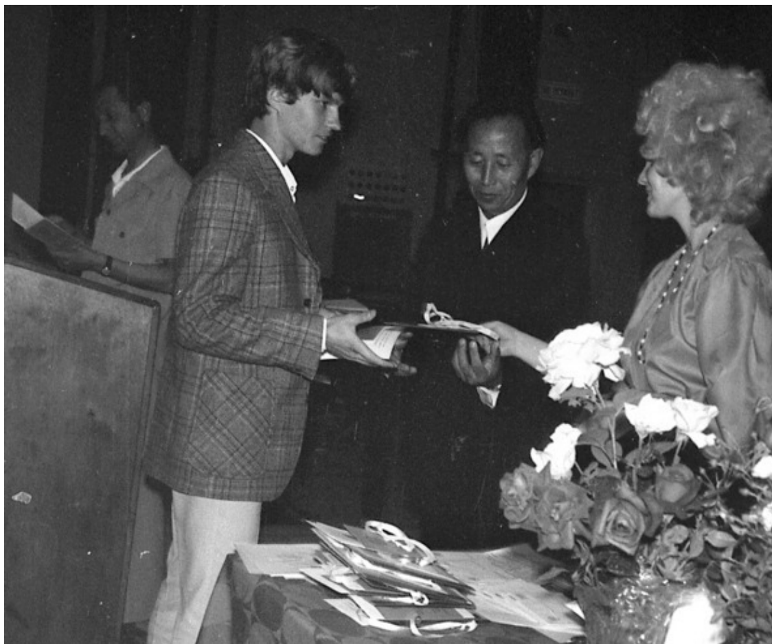
26 июня 1975 года. Аттестат зрелости получает автор этой книги.

Впрочем, в те годы существовала у нас и ещё одна «знаковая» песня (другой звёздной пары – Кабалевский-Долматовский ), без исполнения которой праздник, опять же, считался бы неполноценным: