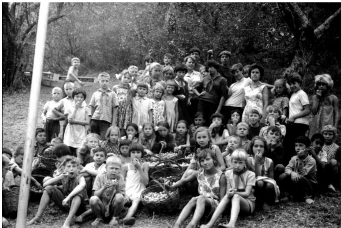
Конец 1960-х. «Кайнар». Компания по сбору яблок.

Но ещё интереснее проходил сбор яблок. Нет, вовсе не пиратский налёт на ближайший колхозный сад. Идеалом советского пионера был все же гайдаровский Тимур . А злостный Мишка Квакин (гроза садов и огородов!) был антигероем. Хотя, чего греха таить, каждому из нас доводилось примерять на себе неприглядную квакинскую сущность – яблоки и урюк из сада соседей всегда казались более ароматными и вожаденными, нежели растущие у собственного дома. Но этот «грех» не был системным. А тут, в «Кайнаре», его вообще не отмечалось в силу того, что лагерь являлся пионерским (с тимуровскими идеалами), а самое главное – никаких колхозных садов в непосредственной близости не наблюдалось.