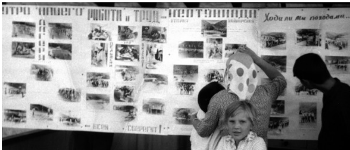
Конец 1960-х. «Кайнар». Стенгазета. Главные вехи лагерной жизни.

...Осязаемой точкой летних каникул для вернувшихся в классы школяров было традиционное сочинение – «Как я провёл лето?». Горький вздох с воспоминанием самых радостных моментов минувших каникул. Писали, обычно, совсем про другое, но в головах многих лукаво крутилась карикатура на морского бога Нептуна. Почему?