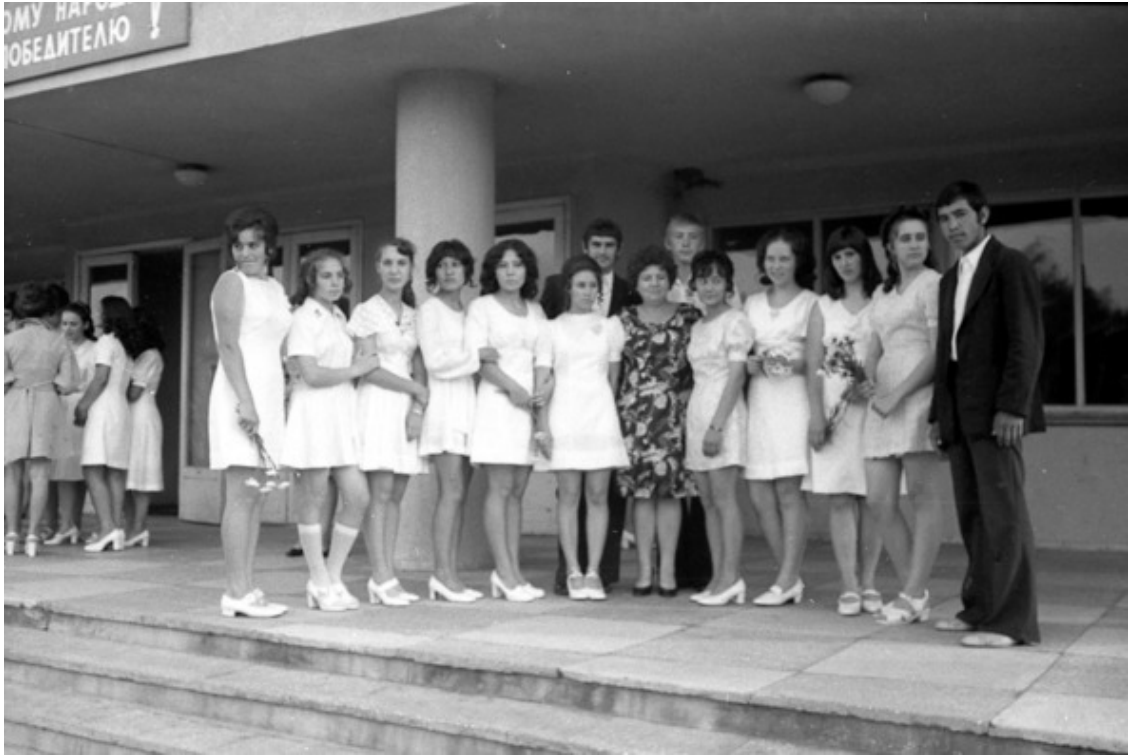
26 июня 1975 года. Параллельный "а".

...В тот тёплый летний вечер 26 июня 1975 года мы (выпускные классы, наши родители, учителя и многочисленные сочувствующие) собирались к поселковому Дому культуры по совершенно особенному поводу – для прощания с прошлым и встречей с будущим. Для нас, виновников, это был своеобразный пролог той самой, вожаденной, приукрашенной воображением и захватывающей возможностями «взрослой жизни», к которой мы и готовились 10 школьных лет.