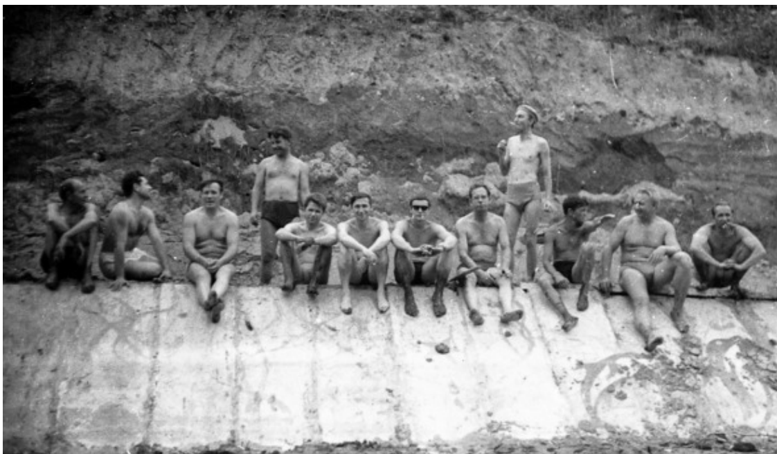
Конец 1960-х. Наши отцы на субботнике в «Кайнаре».

Однако при разборах фотоархива фотокружка Областной станции юных техников (она располагалась в нашем Посёлке) отыскались любопытные снимки, рассказавшие о появлении «Кайнара». Оказывается, институт (ИЯФ) не только финансировал строительство, но и поставлял строителей. Во всяком случае, среди причастных к его появлению мелькают знакомые лица как младших, так и старших научных сотрудников. Это было очень в духе того времени и в стиле жизни наших родителей – не ждать милостей от всяких районных ОНО, а взять, да и сделать всё для своих детей своими руками!