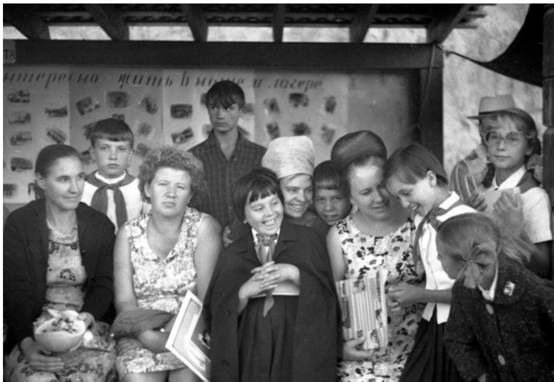
Конец 1960-х. «Кайнар». Родительский день.

тельным причинам) – «обстановка» эта сама наезжала к нам: с полными сумками, рвущимися из рук авоськами, озабоченными лицами и какими-то своими, родительскими ожиданиями. Для доставки всего этого к нам в «Кайнар», снаряжались специальные «служебные автобусы» от Института ядерной физики.