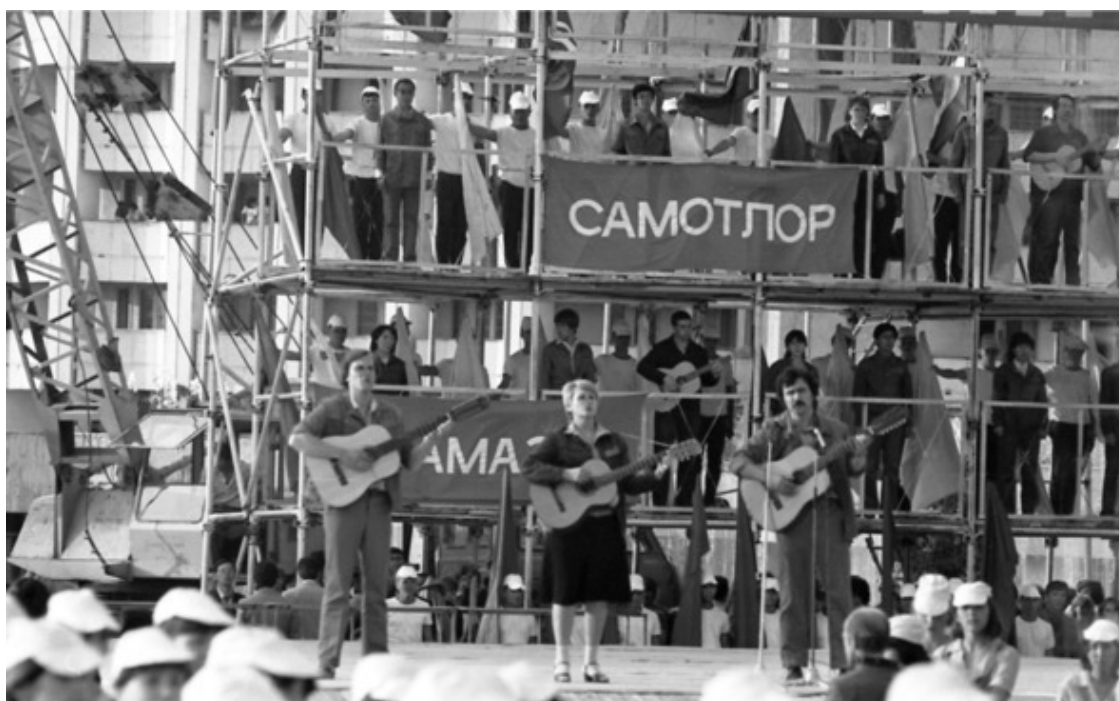
1984 год. Алма-Ата. Всесоюзный слёт ССО.

...Ныне нет-нет да и заговорят в СМИ о «возрождении ССО». Зазвучат абстрактные тезисы о некоем «подъёме» и бодрые рапорты о «новой жизни» в движении студенческих строительных отрядов. При этом «телевизионная картинка», как правило, сводится к показу молодых людей в красивых форменных куртках, которые как-то неумело, явно стараясь не замарать рук и своей новенькой формы, сажают деревья или собирают мусор (разбросанный молодыми людьми без курток). А потом азартно селфятся на фоне своих трудовых свершений.