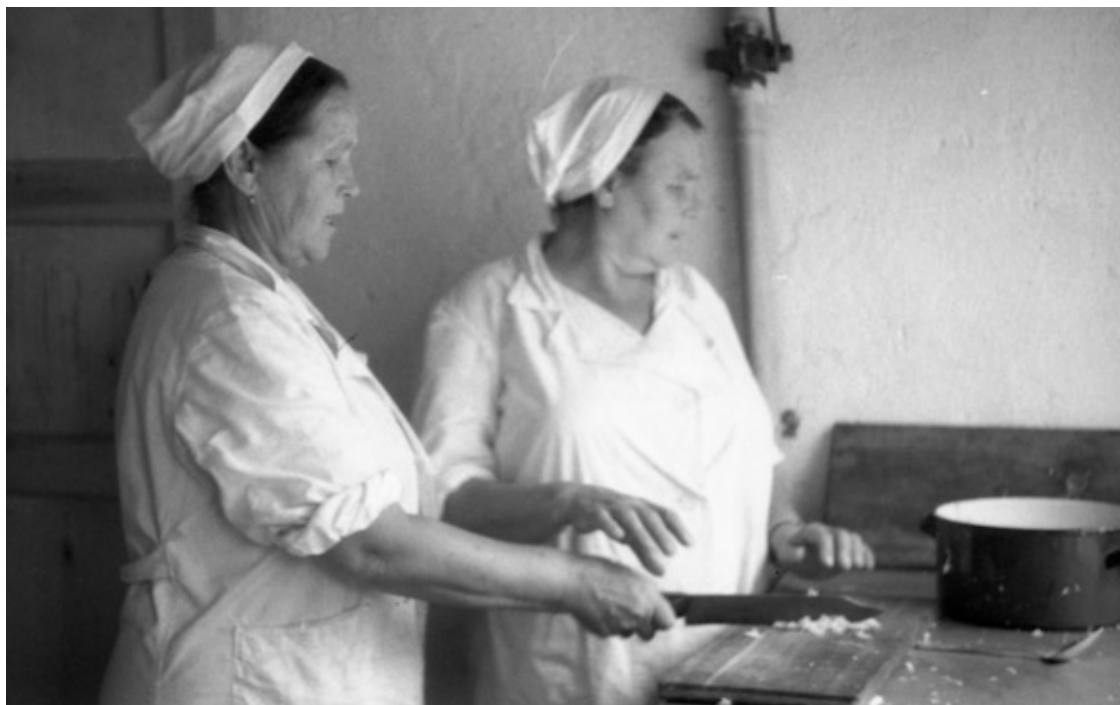
Конец 1960-х. «Кайнар». Кухня.

«Спасибо нашим поварам за то, что вкусно варят нам!» – ещё один крылатый лозунг из лагерного бытия. Обычно его выписывали на самом видном месте в столовой. Так как в нашей кайнаровской столовой работали командированные «от предприятия» мамы тех, кто отдыхал в лагере вместе с нами, то легко предположить, что к нашему питанию наши повара подходили куда как неформально!