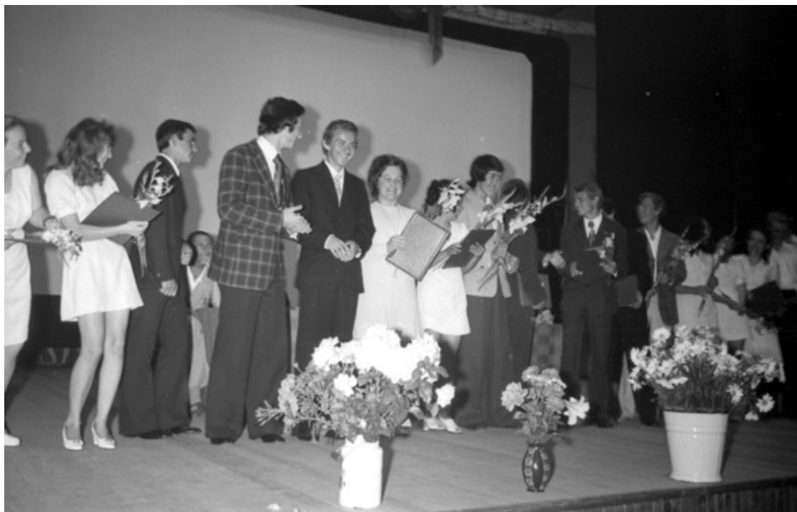
26 июня 1975 года. Выпускные торжества в ДК. Наш 10 «в».

Впрочем, гимн был не единственный – редко какие вехи ещё (разве что – День Победы и праздник 7 ноября) были отмечены таким массовым и прочувствованным музыкальным сопровождением. Любое выпускное торжество начиналось написанным теми же Дунаевским-Матусовским «Школьным вальсом».