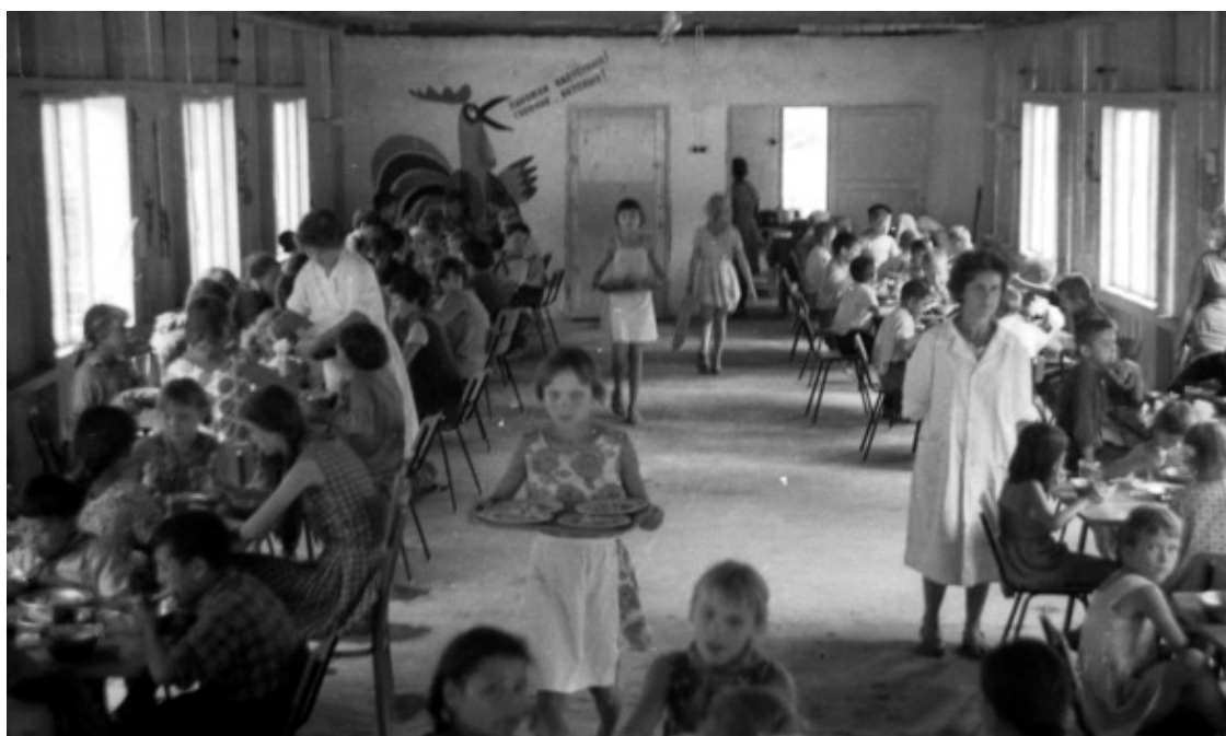
Конец 1960-х. Лагерная столовая. Обед.

Архиважное место в лагерной жизни занимал четырёхкратный приём пищи. И хотя основная работа по пропитанию лежала на снабженцах и поварах – дежурство по столовой самих пионеров-лагерников также включало в себя не только формальную проверку чистоты рук входящих. Не случайно от него освобождались только «салажата» из младших отрядов. Для всех других это был неременный элемент насыщенных лагерных буден.