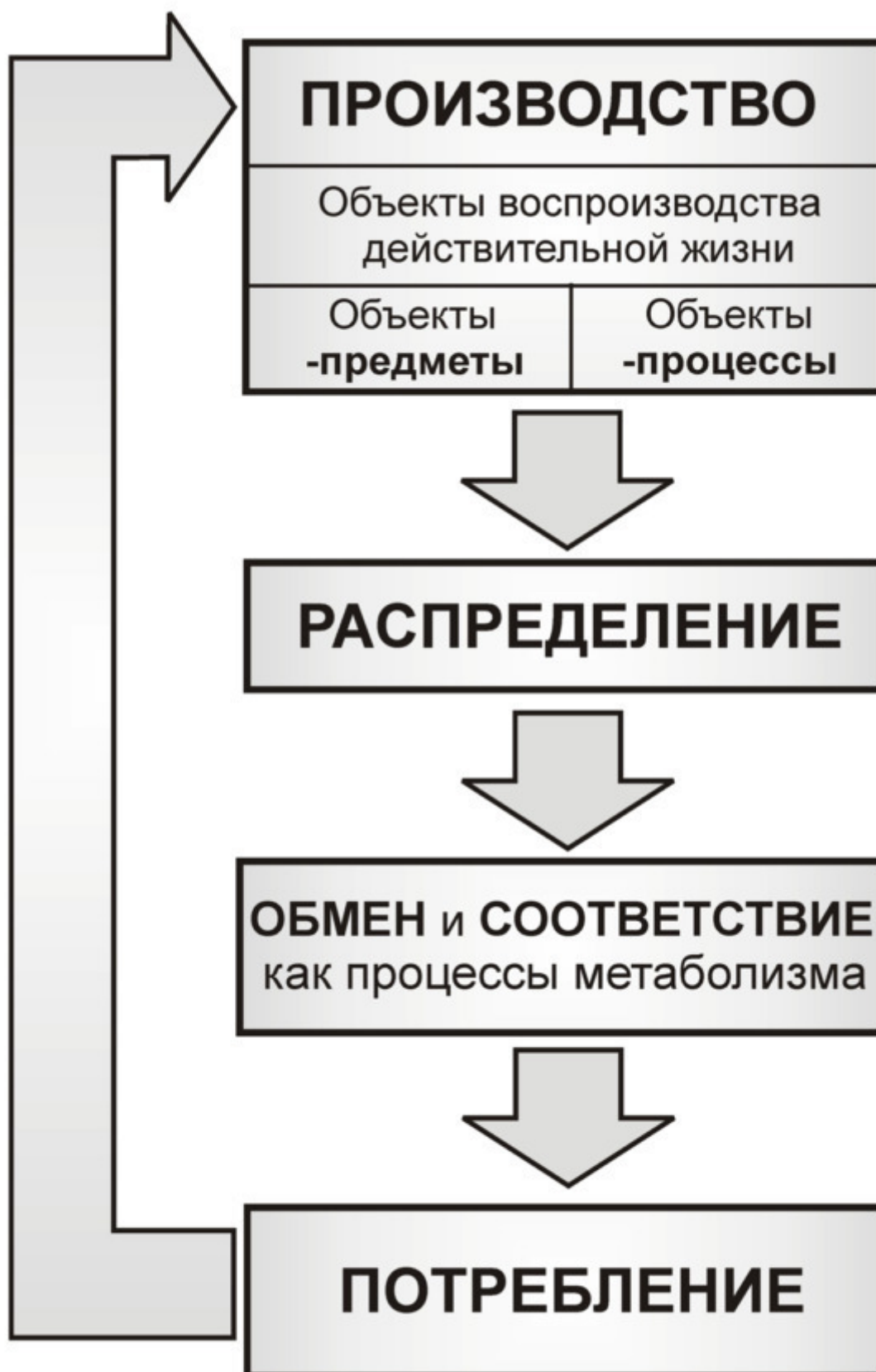
Рис. 6. Стадии цикла воспроизводственного кругооборота (обращения) производства как «общественного движения»