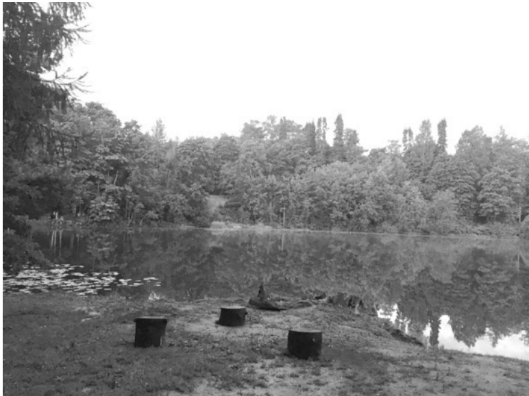
Вид на место, где была усадьба Левашовых в Осиновой Роще. 2020 год