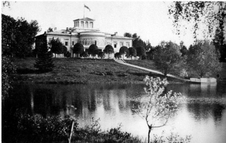
Усадьба Левашовых в Осиновой Роще. Конец XIX – начало XX века

Не сдержался флигель-адъютант полковник Шереметев, подошел к старому солдату и крепко обнял. А когда тот выходил из комнаты – перекрестил в спину со словами: