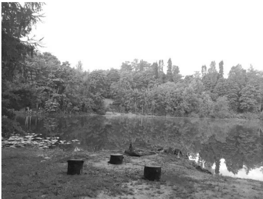
Вид на место, где была усадьба Левашовых в Осиновой Роще. 2020 год