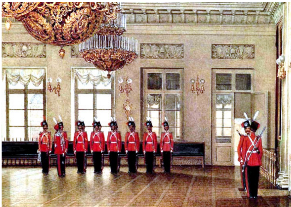
Картина Э. П. Гау «Караул лейб-гвардии Казачьего полка в Зимнем дворце» (1866 год)