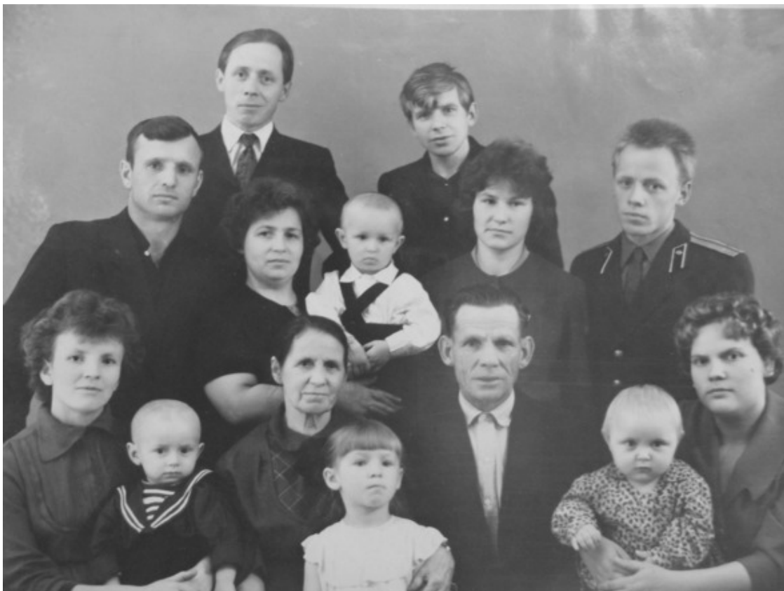
Вся семья в сборе. Фотография начала 1960-х годов

Сестра родилась в Нижнегородском крае, а я, – хоть и там же, но адрес уже писали иначе: Кировская область, Кировский район, Шалаевский сельсовет, деревня Новокшеновы.