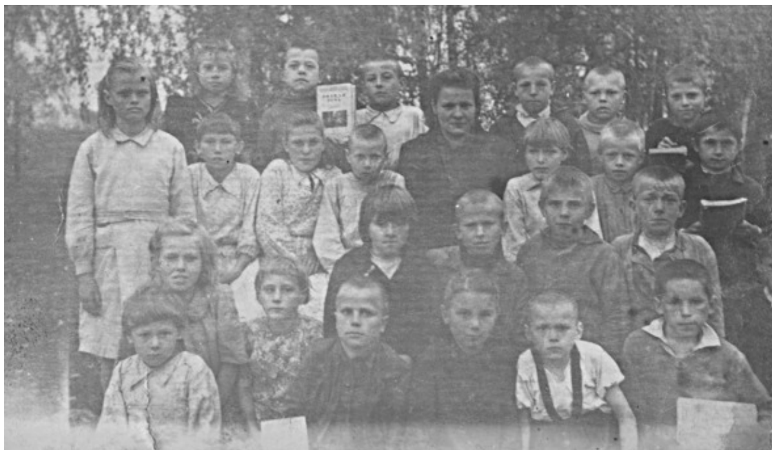
Второклассники 1947 года. Я во втором ряду сверху, второй справа с белыми зальсынами