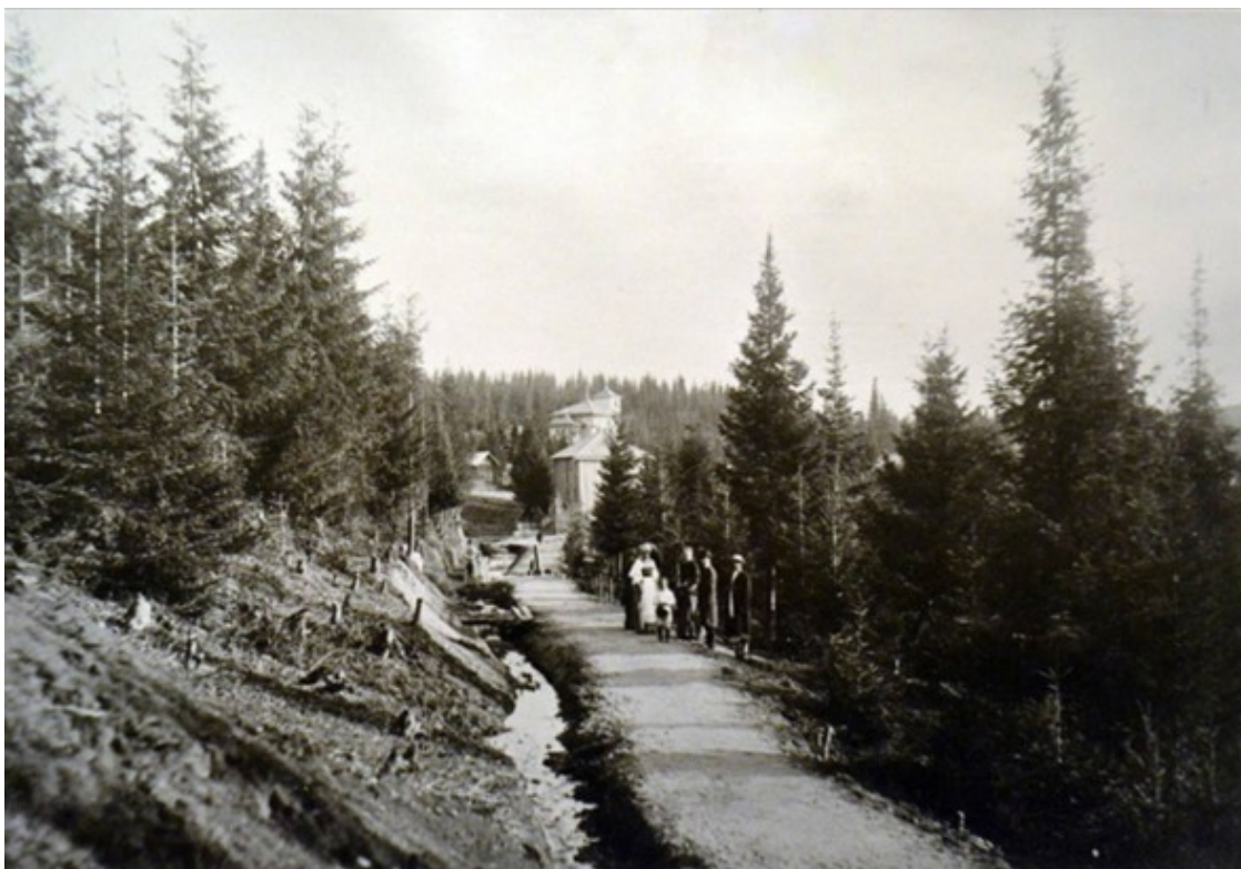
Монастырская Филейская аллея

На следующий день узнал, как поступили почитатели с останками будущего канонизированного святого.