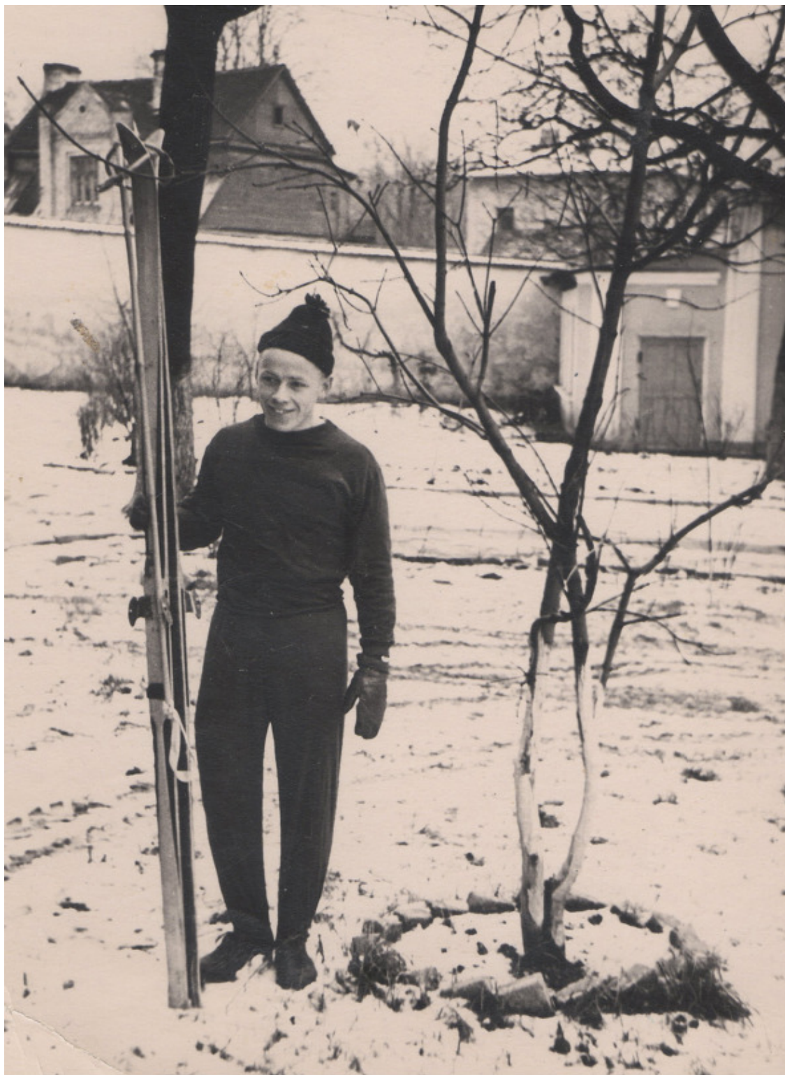
Разрешено утром тренироваться самостоятельно

Чувство, когда ты первый раз отпустил сцепление и машина тронулась, незабываемо. Сдали практическую езду на ГАЗ—51. Получил права и личную карточку водителя.