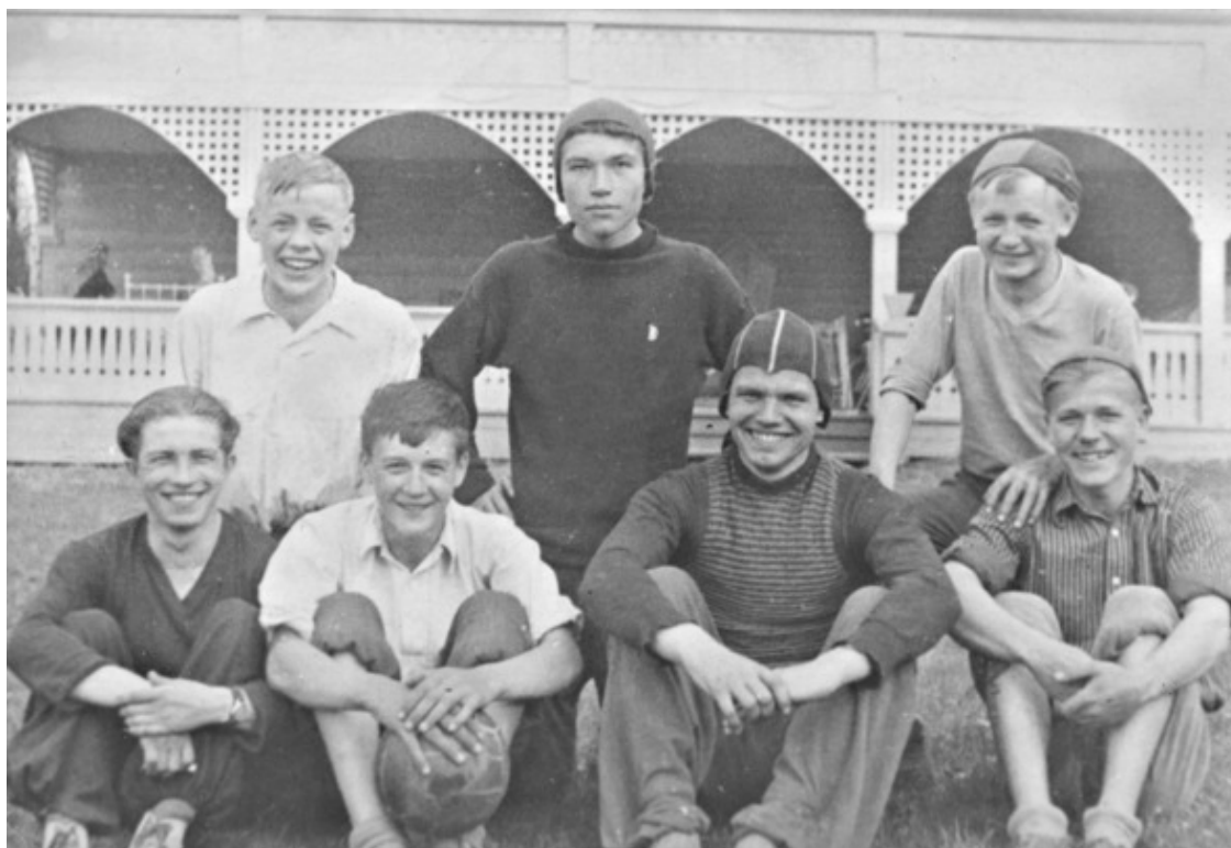
Заводская велокоманда, 1955

За тот день не спеша проехал более 60 километров.