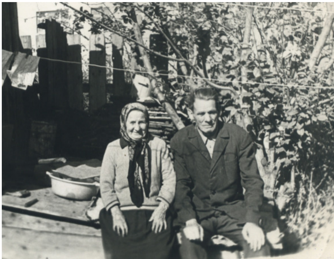
Родительница-мать и отец. Фото 1970-х годов