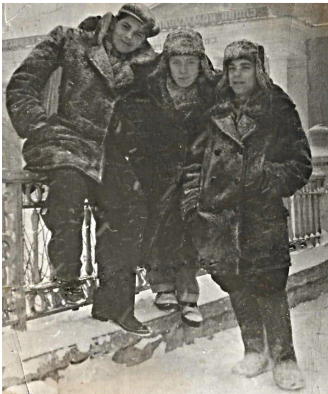
Три токаря на заборе