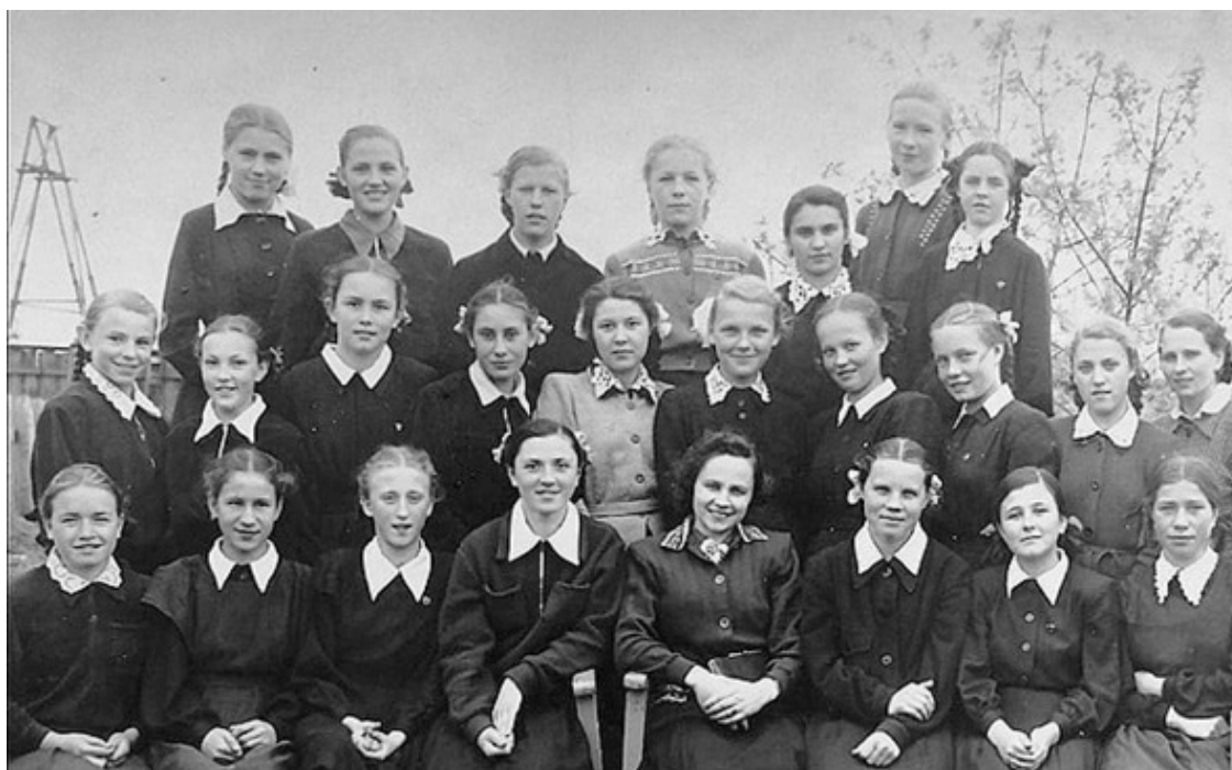
Болельщицы со своими одноклассницами и учительницей, улыбающейся в первом ряду