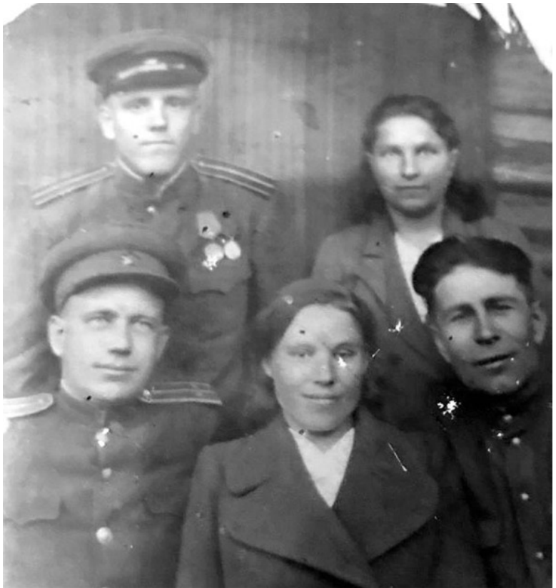
С молодой женой (стоят) и друзьями