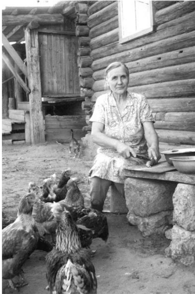
Баба Шура чистит карасей с дедушкиного улова

На лодке по огромному, поросшему травой озеру по одному ему понятным приметам дед находил места, где ставил сети, закидывал венделя. Разводил дед кроликов, потом норок, песцов, чернобурок, хонориков, были и пчелы недолгое время. Сам выдeldывал шкуры. Охотился с ружьем на уток, на барсуков. Зимой плел сети.