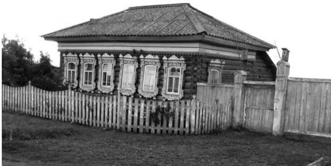
Дому Ноздриных-Закурдаевых более 100 лет. Наши дни