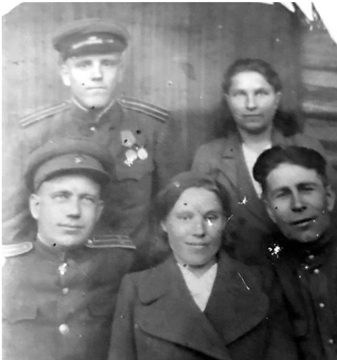
С молодой женой (стоят) и друзьями