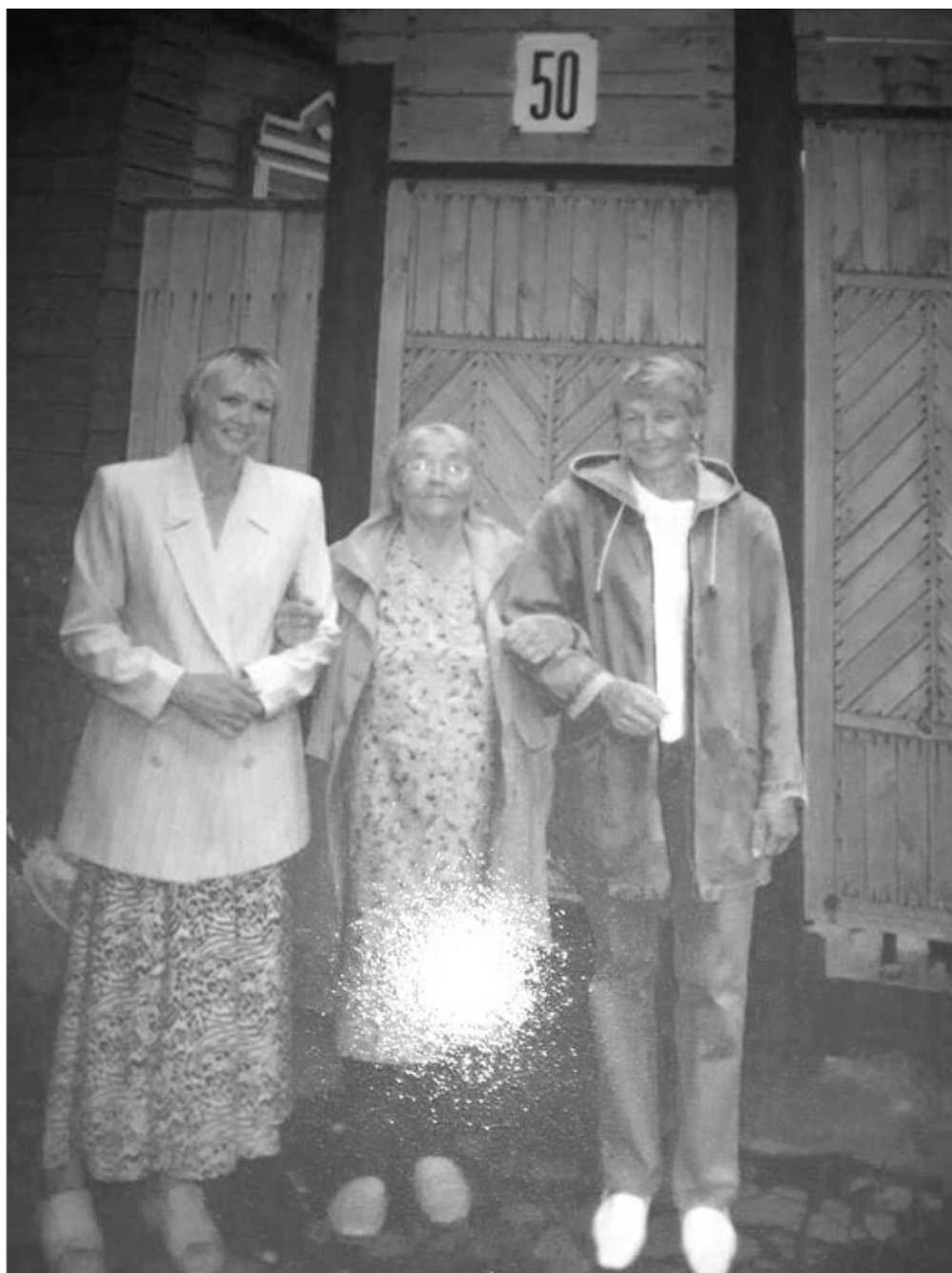
С мамой возле нашего дома в Большеречье. Мы с сестрой родились в этом доме. Он и сейчас стоит, только хозяева в нем другие