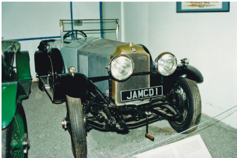
Английский Vauxhall OE 30—98 1923 г. в.

Этот 4-местный открытый «Воксхолл» довольно редок. Всего в британском Лутоне было собрано чуть больше трех сотен таких автомобилей. На музейной табличке указано, что его порядковый номер в этой плеяде «312-й».