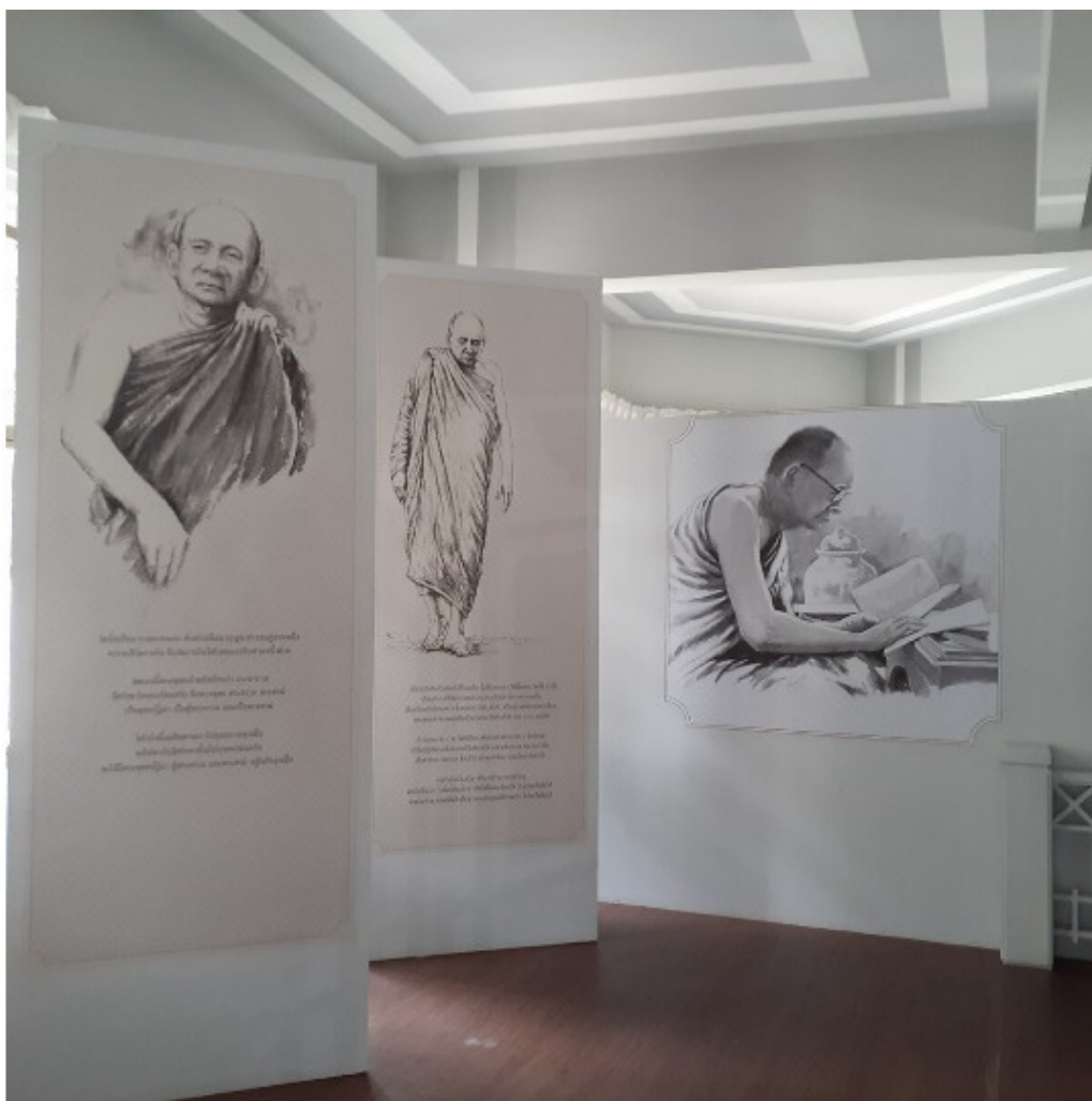
маленький музей патриарха на нижнем уровне в ступе Ват Яна

В монастыре, королевском мемориале на месте маленькой больницы, где докторствовала иногда принцесса Мэ Сангван, и который был летней резиденцией Патриарха «учителя и наставника короля» хранятся шариры-несгораемый остаток после кремации тела Пхра Ньянансамвара. Монастырь так и называется – Ват Ян, Ват Ньянанасамварарам. С ступе-чеди святыне остаток рядом с которыми здорово медитировать, атмосфера там особенная.