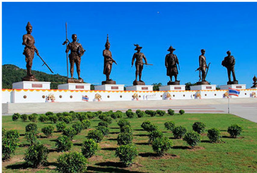
Хуа-Хин, 7 королей

При въезде в исторический заповедник Аютхайя, признанный мировым наследием и охраняемый ЮНЕСКО, проезжаешь мимо главной конторы этого исторического заповедника. На крыше можно заметить семь величественных фигур, изображающих самых знаковых для истории Сиам королей, от XIV века до династии Чакри. это мемориал в Хуахине – парк 7 королей