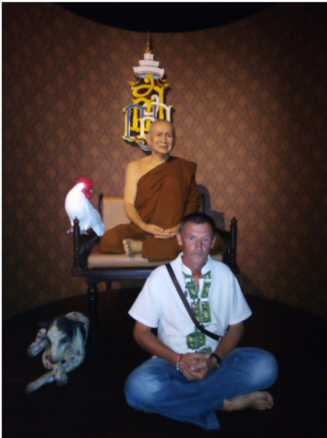
восковая фигура патриарха в галерее арахатов Сиам, монастырь Ват Ян

Я уже упоминал в своих статьях о короле-монахе Раме IV, который в сообществе с несколькими арахатами Сиам того времени реформировал буддистскую сангху, разработав Дхамма-виная (монашеский устав), приведя его в соответствие с буддистскими ценностями. До этого времени тайский буддизм нёс не себе еще много от индуизма шиваитского толка, что и сейчас заметно. Было создано две школы буддизма Тхеравада – Маха-никайя и Дхаммаютт-никайя. Обе школы были созданы тем сиамским собором. Дхаммаютт являлась как бы квинтэссенцией буддизма. И сейчас монахи, рукоположенные в Дхаммаютт принимают на себя