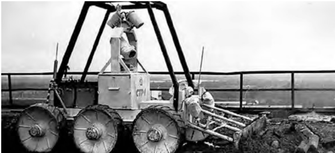
Радиоуправляемый робот «„СТР-1“»