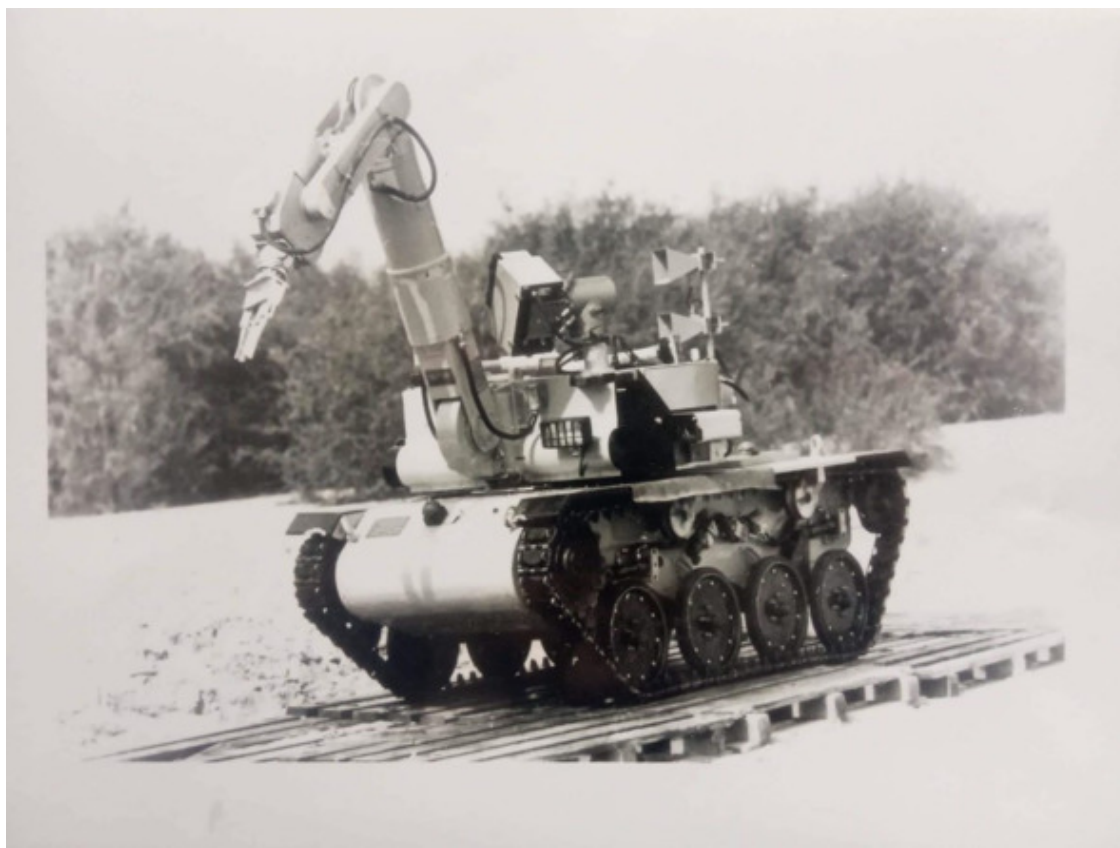
Робот – полицейский «JOKER»

Телевидение эфирного типа (черный ящик). В центре шасси, защищенный бокс для электроники, сзади аккумуляторный отсек. С.Т.Р имел возможность разворота практически на месте. На раме сзади было две пружинные клеммы, он подъезжал к шкафу зарядного устройства и заряжал свои аккумуляторы. Позже я узнал подробную историю специализированного транспортного робота (С.Т.Р-1): этот аппарат разрабатывался десятками научных институтов— ВНИИ АЭС, ИФТП, ВНИИ «Трансмаш», «Пролетарский завод», НПО «Источник», НПО «Электронмаш», ГОИ, НИИ телевидения, Киевским институтом автоматики и многими другими. В С.Т.Р были использованы наработки ВНИИ «Трансмаш» по самоходному шасси лунохода. Именно это позволило запустить робота на крышу ЧАЭС уже в конце августа 1986 года. С.Т.Р – стал легендой, роботом, принимавшим участие в очистке крыши ЧАЭС от завалов высокорadioактивных элементов разрушенного реактора. Робот эксплуатировался при уровнях гамма – фона до 3000 Рентген в час (30 Зв). В некоторых местах (у основания вентиляционной трубы №2) уровни излучения доходили до 10000 Рентген в час (100 Зв). В качестве источника питания использовались аккумуляторы – 300 А/ час, весом 19 кг в каждом. Было еще несколько таких С.Т.Р, другой комплектации: с манипулятором, реечного типа и ковшом впереди. Мы тоже испытали С.Т.Р на тяговое усилие, он свободно мог буксировать тяжелый автобус ЛАЗ.