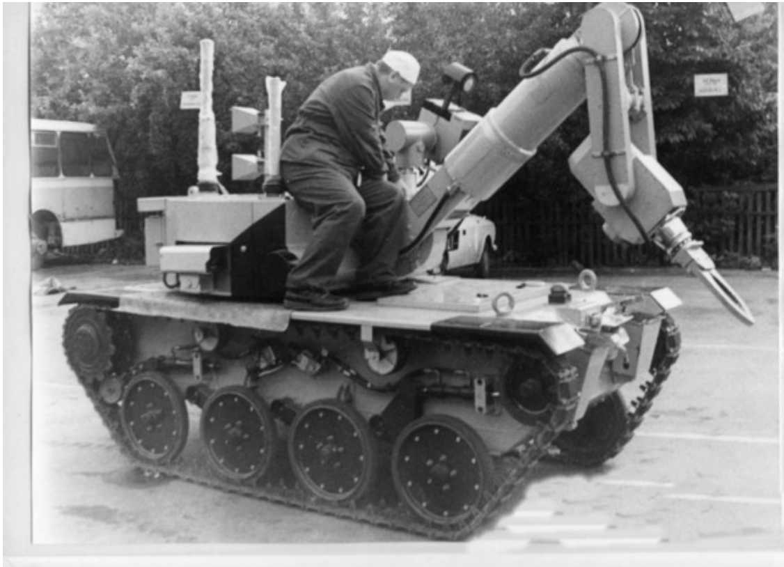
«JOKER» – подготовка к работе

Электронный мозг не выдержал такой дозой нагрузки. Была информация, что при его заказе дозовая нагрузка была занижена. Доза в месте его выгрузки и работы составляла более 10000 бэр (100 Зв). Теперь он стал никому не нужен.