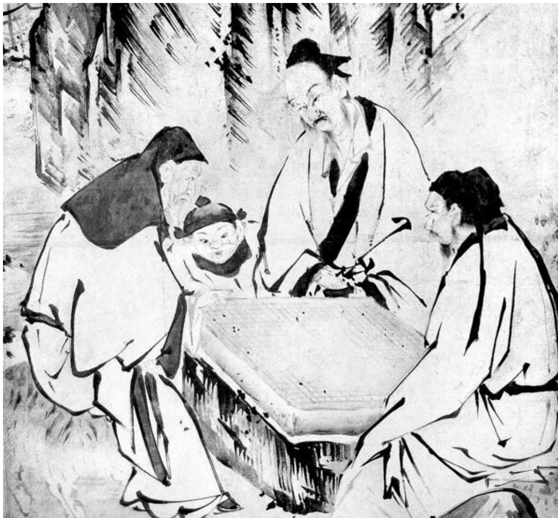
Картина Кано «Четыре мастера»

ДЗИММУ-ТЭННО (ИМПЕРАТОР ДЗИММУ, 711–585 до н. э.) – легендарный основатель и первый император Японии, которого синтоисты считают прямым потомком верховной богини пантеона синто Аматаэрасу Омиками (богини Солнца). Зарубежные историки могут сомневаться в том, что Дзимму-тэнно существовал на самом деле, но японцы уверены в этом точно так же, как и в его божественном происхождении. В 1940 году состоялось торжественное празднование 2600-летия восшествия Дзимму-тэнно на престол и основания японского государства.