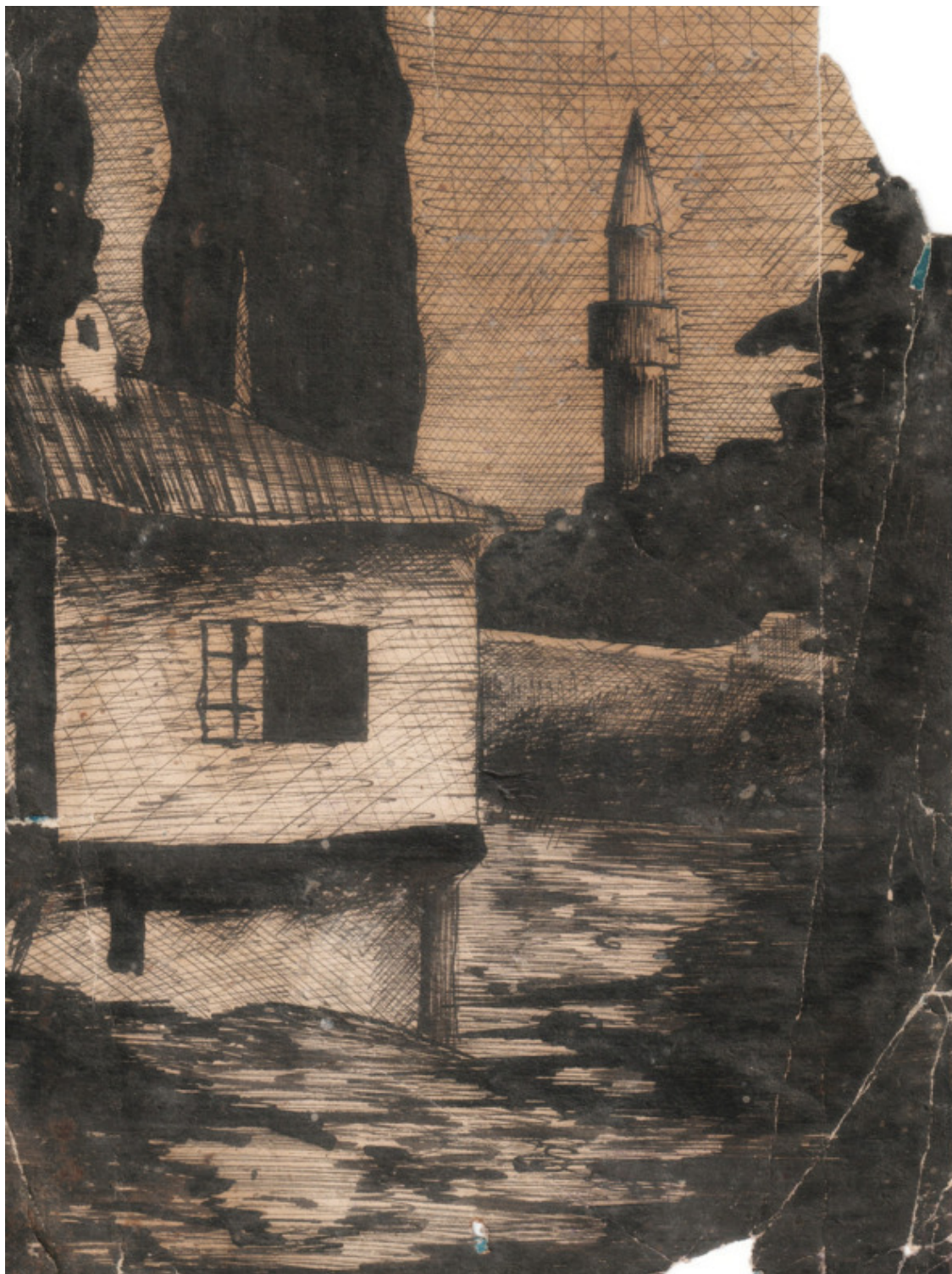
Старый Крым. Чернила, тетрадная обложка. Автор – Левда А. М.

В этой части своих дневников прадед старался вести ежедневные заметки о работе, быте – в общем, о жизни. Для удобства обработки я разделил дневники на годовые периоды. Где возможно, дал ссылки на описание исчезнувших (или вошедших в другие) населенные пункты, упомянутые в дневниках. Сопоставление старинных и современных мест и населенных пунктов сделано по картам Яндекс, карте Таврической губернии 1865 года и карте РККА 1938 года .