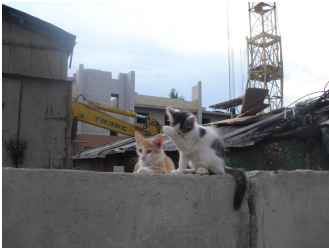
Мы с сестрой

и черных шапках, вечно пахнувшие алкоголем и кровью. Если они поймают – все, пропал кот. Я сам видел. А позавчера в нас стреляли дети – представляете? Я, например, не представляю. Как можно стрелять в двух-месячных котят ради развлечения? Но это еще ничего. Уже три дня нас с сестрой выслеживают какие-то люди. Они даже ходили по стройке с фонариком, а, когда увидели – бросились ловить. Не знаю, зачем мы им, но честно говоря, не хотел бы я оказаться в их лапах.