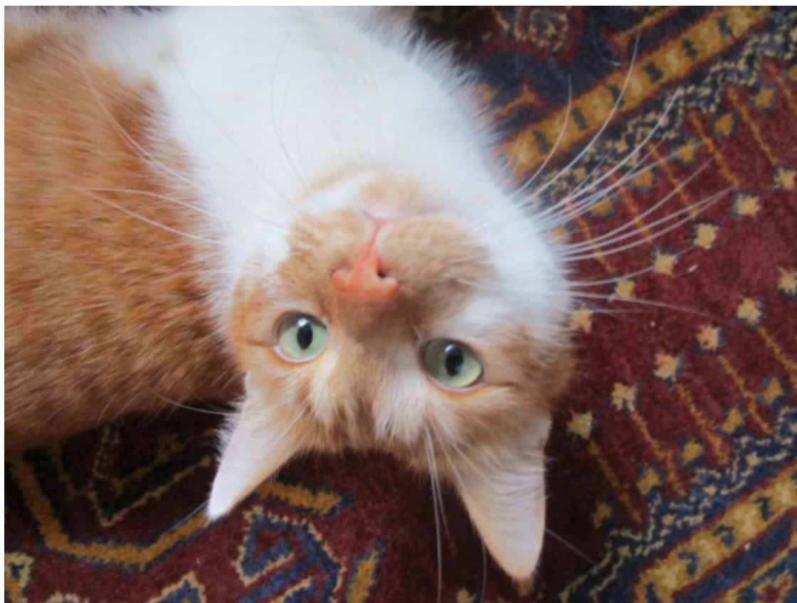
А то смотрите у меня! (с) Руфик

Руфик живет в семье до сих пор. Повзрослел, поправился, стал спокойнее и добрее. Но характера этому котеночку до сих пор не занимать. Просыпается строго по будильнику и бдит, чтобы после этого будильника уже никто не заснул. В обиду никого не дает, а все проблемы и лишения встречает, стиснув зубы и с гордо поднятой головой. Вот правда, завалится иногда на бок прямо на ходу, под ноги кишащим на кухне человекам... Но так это от сытой жизни и уверенности, что тебя топтать не будут, ибо любят и знают твой суровый нрав.