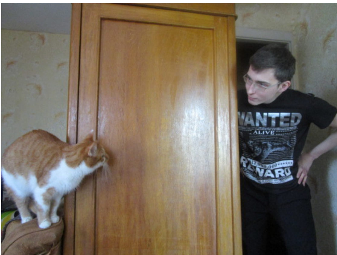
Кот Руфик отстаивает границы

Не смотря на то, что кот был маленький, а хозяйка – взрослой, он сразу сообразил, что кроме него защищать ее некому. Она называла его любимым котеночком, а вот гости определиться не могли: собака он или кот, рыжий дьявол, сумасшедший тигр или карающая дрянь правосудия! Но этот котенок ничего не боялся, не признавал никаких авторитетов, считал территорию своей и не оставлял ни одной обиды безнаказанной!