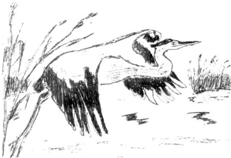
Рис. 6. Цапля в полете

Крупная птица серого цвета с белой шеей и грудью, имеет за затылком черный хохолок.