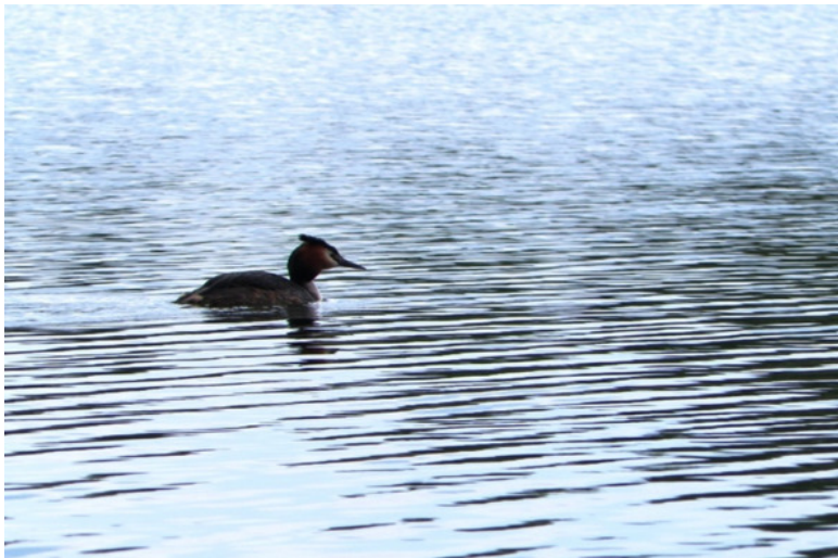
Рис. 4. На водных просторах заказника