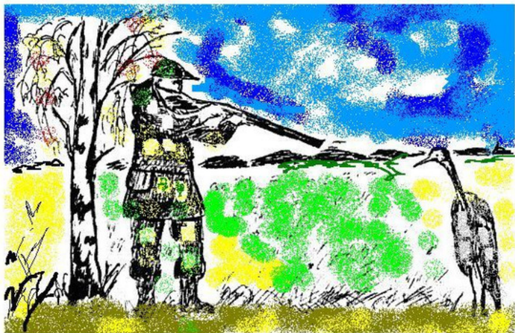
Рис. 5. Журавка и браконьер.

зами, пошел навстречу своему врагу – тому, кто держал в руках смертоносное железо.