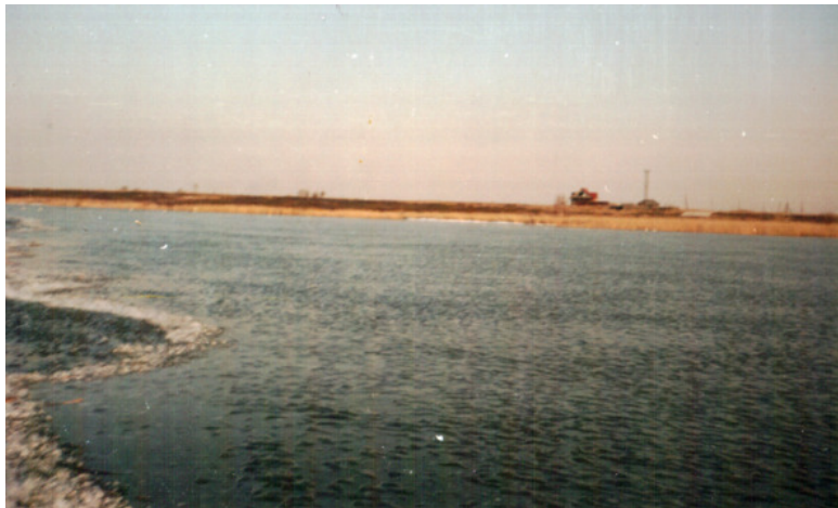
Рис. 3. Озеро Белое. Вдали – база заказника.

Леса имеют островной характер. В заболоченных местах преобладают густые заросли ивы, произрастающей совместно с тростником или среди осоковых кочек, называемые местными жителями «рапажами».