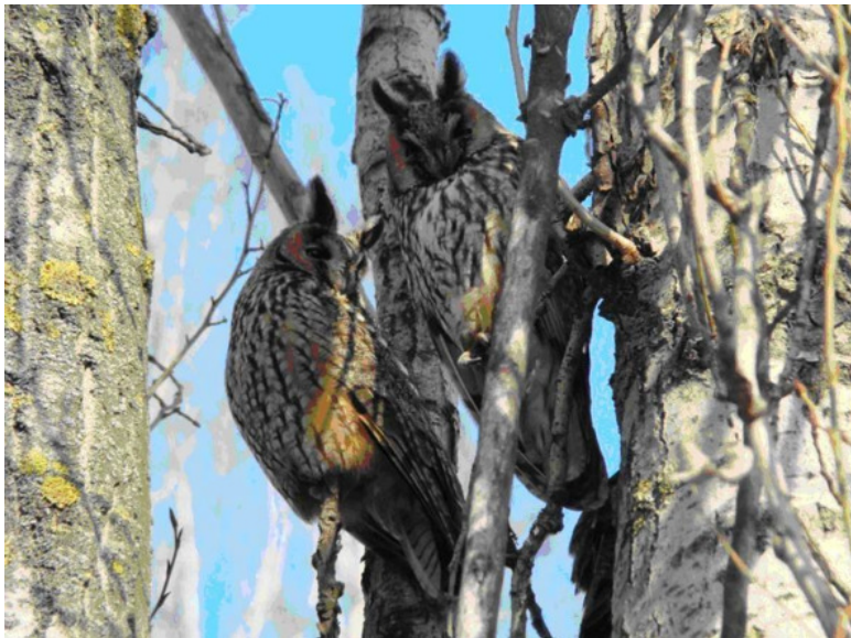
Рис. 1. Совы.

О некоторых из них вас ждет встреча во второй книге.