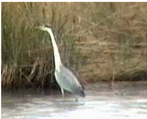
Рис. 7. Цапля на озере Чаны.

ленность ее всюду низка – так отмечается в отчетах деятельности заказника в конце семидесятых годов прошлого столетия – более вероятно, что птицы используют водоемы «Кирзинского» для кормежки. Чаще встречается серая цапля по побережью, заливам и особенно островам озера Чаны. Скопления птиц встречались в августе-сентябре на островах Колпачок, Амелькина Грива, Шулдииков, Тюрин.