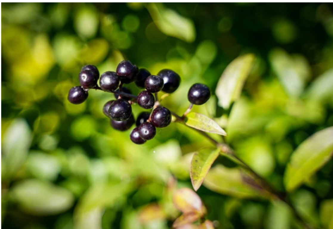
Волчьи ягоды (Бирючина)