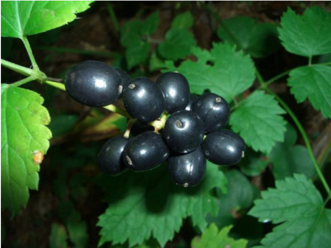
Воронец колосовидный черноплодный