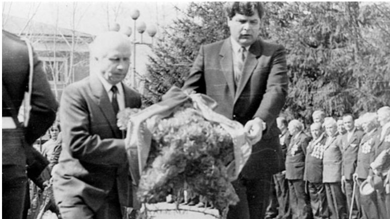
Возложение венков к Вечному огню. 9 мая 1986 г.