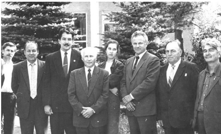
Встреча с кандидатом в депутаты от КПРФ Бабури-