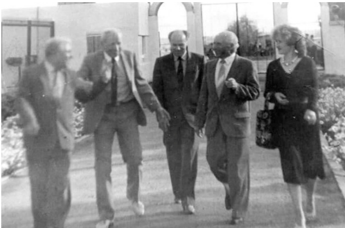
Гости из Венгрии в восторге от Большереченского зоопарка

Но это не испугало Соломатина. Вернувшись домой, он привлек к этому делу руководителей хозяйств и предприятий. И все получилось! Построили вольеры, павильоны, закупили животных, благоустроили территорию. До сих пор Большереченский Государственный зоопарк дарит радость большереченцам и гостям района. В 2012 г. ему было присвоено имя основателя – Валерия Соломатина.