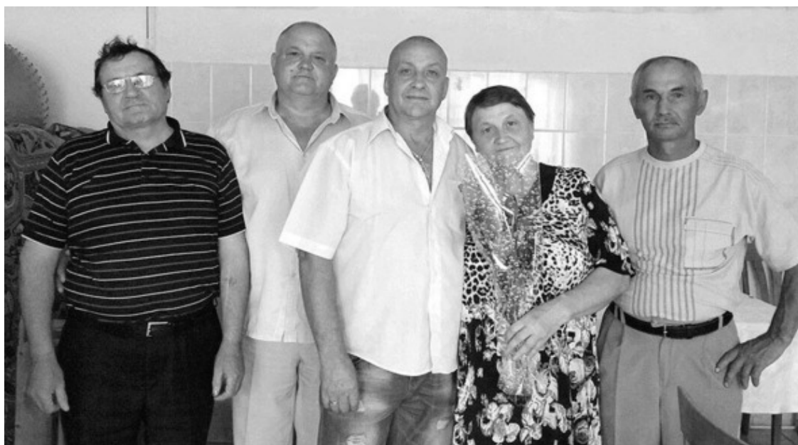
Встреча через сорок лет