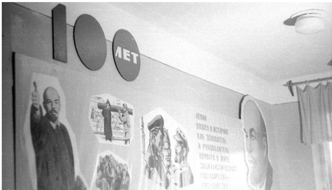
В коридорах нашего училища размещалась наглядная агитация