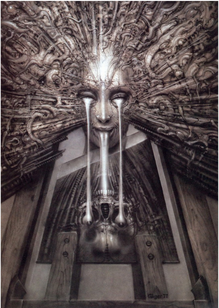
Ганс Гигер. Карта Таро – Маг