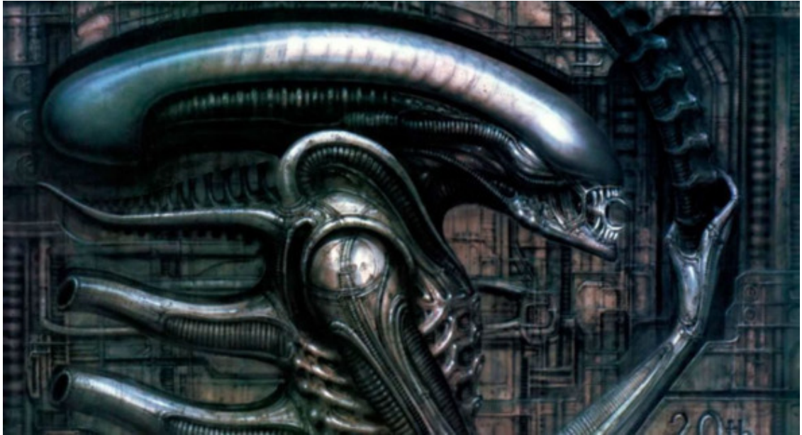
Ганс Гигер. Прообраз