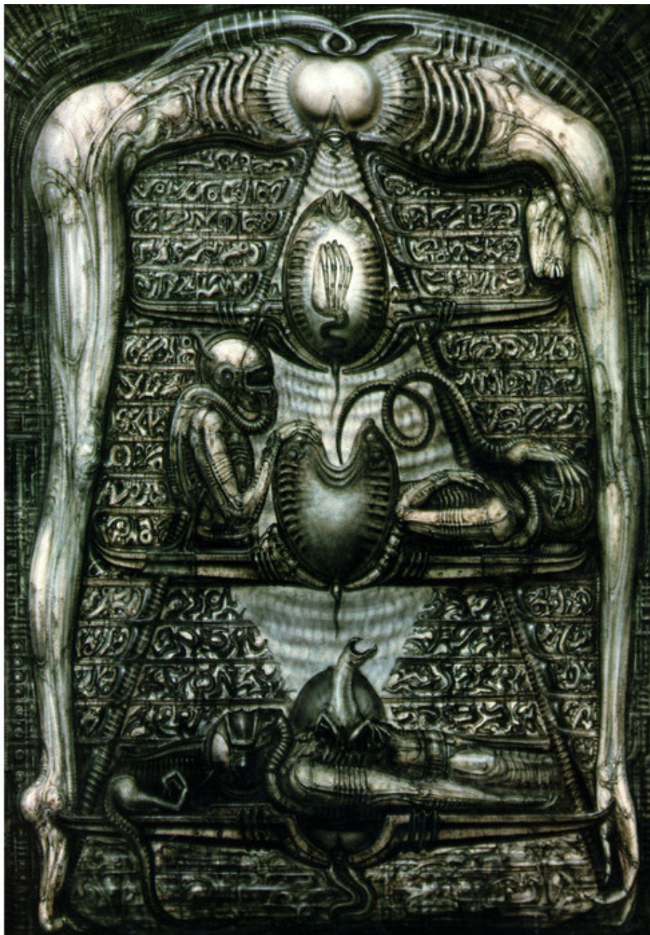
Ганс Гигер. Стелла откровения