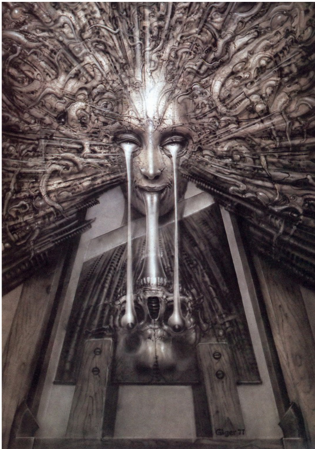
Ганс Гигер. Карта Таро – Маг