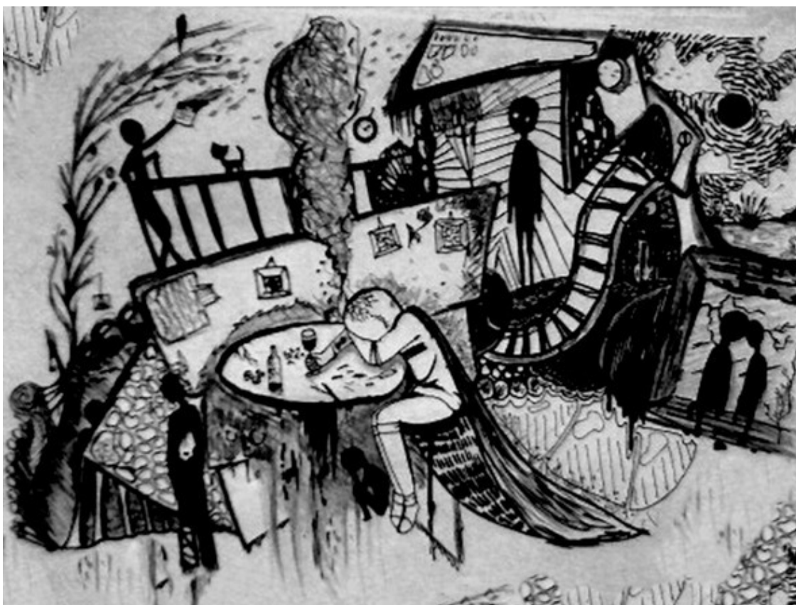
Александра Ли, «Эпитафия поэтической горячке», 2018 г. бум. фломастер.

Бесов Гений, довольно эпиграфов— Каждой букве есть место в строке. Ход записан и суть обыграна Чёрных пятен на рукаве.