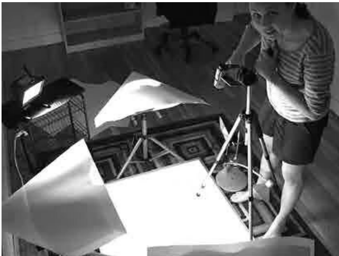
Сати в нашей второй студии, лето 2007 года

В апреле мы разместили его на YouTube, и ролик сразу стал хитом. В первый день его просмотрели десятки тысяч раз, мы получили массу электронных писем, комментариев и отзывов на нашу работу в блоге. Люди призывали нас продолжать делать видеоролики. Это был один из лучших дней в моей жизни. Наше объяснение завоевало такую популярность, потому что помогло людям понять, что такое канал RSS, позволило посмотреть на проблему с иной точки зрения.