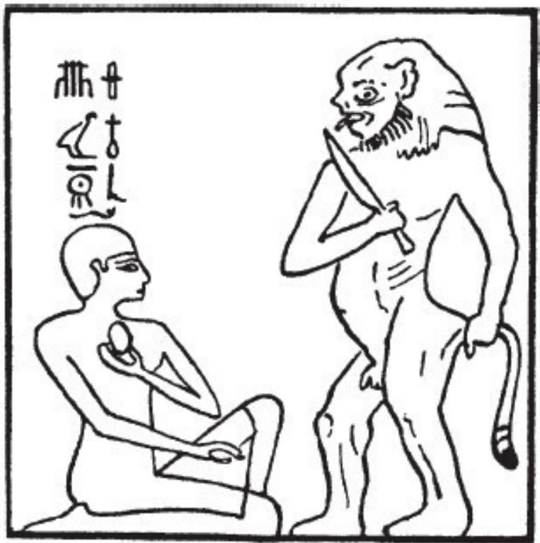
Рис. 1. Нефер-убен-ф, жрец, защищает свое сердце от разрушителя сердец

Однако, хотя умерший и мог обрести сердце благодаря вышеупомянутой главе, он должен был тщательно оберегать