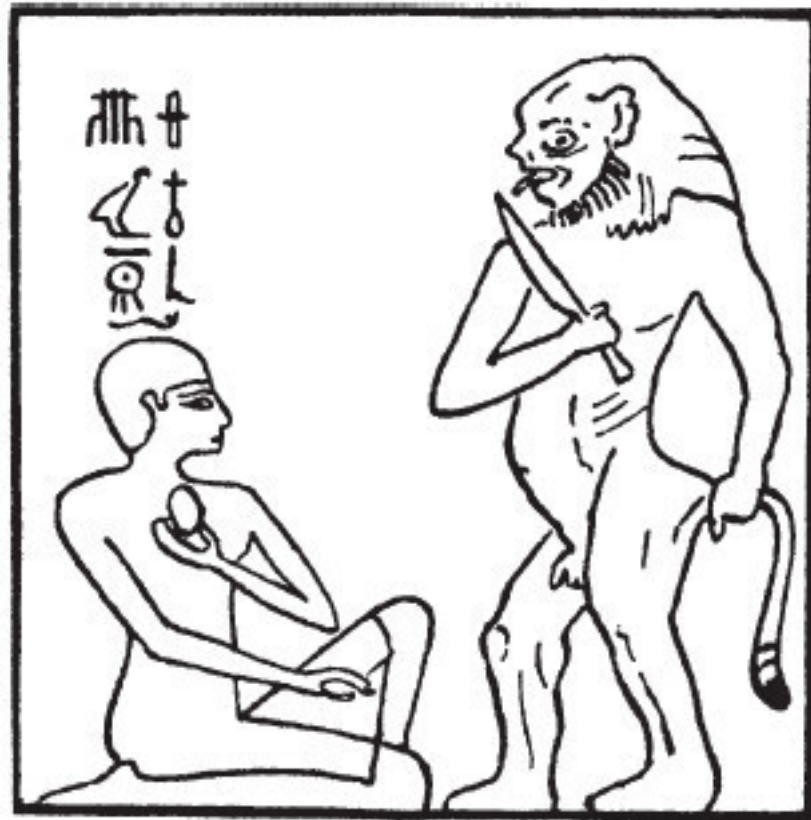
Рис. 1. Нефер-убен-ф, жрец, защищает свое сердце от разрушителя сердец

Однако, хотя умерший и мог обрести сердце благодаря вышеупомянутой главе, он должен был тщательно оберегать его от чудовища – получеловека-полузверя, охотящегося за сердцами. Для предотвращения этой катастрофы было написано не менее семи глав Книги мертвых (XXVII, XXVIII, XXIX, XXIXа, XXX, XXXа и XXXб). Глава XXVII была связана с амулетом сердца, изготовленным из белого полупрозрачного камня. Текст ее гласит: «О вы, те, кто отнимает сердца! О вы, те, кто крадет сердца и кто заставляет сердце человека превращаться в соответствии с деяниями его, не дайте поступкам его навредить ему! О вы, повелители вечности, обладатели бессмертия, не забирайте это сердце Осириса (то есть умершего, который отождествлялся с Осирисом, богом и судьей мертвых) и не дайте злым словам навредить ему, ибо это сердце Осириса и оно принадлежит многоименному (то есть Тоту), могущественному, изрекающего своими членами, того, кто посылает сердце в тело. Сердце Осириса торжествует и обновляется перед богами: он овладел им, и его не судили по деяниям его. Он овладел всеми своими членами. Его сердце повиновалось ему, теперь оно в его теле и никогда больше не покинет его. Я, Осирис, победивший и торжествующий в блистательном Амонти и на горе вечности, прошу тебя, о сердце, повиноваться мне в загробном мире».