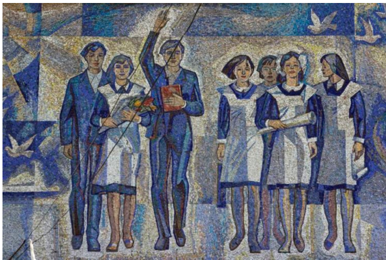
Советская молодежь. Мозаика

В начале 30-х гг. единая для всех союзных республик структура ВПО окончательно сложилась. Как и комсомол, она состояла из пионерских организаций союзных и автономных республик, областей и краев, автономных округов, районов, городов.