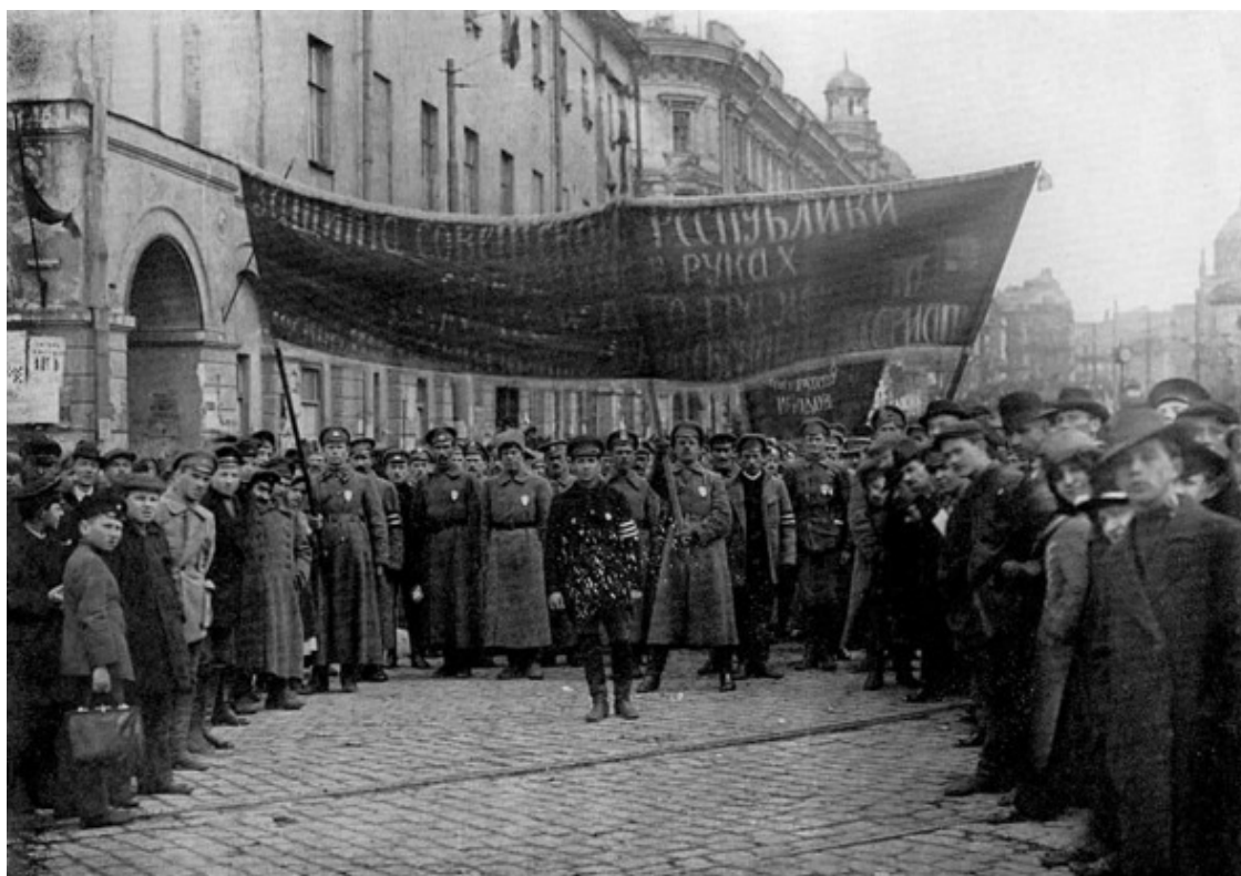
Красная Армия. Москва. 1918 г.

ний. Однако когда выяснилось, что действовавших весьма разрозненно по разным регионам добровольческих кадров явно недостаточно для эффективной защиты новой выстроенной системы власти, в июле 1918 г. был издан Декрет о всеобщей воинской повинности мужского населения в возрасте от 18 до 40 лет. За исполнением воинской обязанности на местах, организацией и снабжением армии, подготовкой территории и населения к обороне, а также соответствием действий и настроений войск политике советского правительства следили специальные политические уполномоченные РВС – военные комиссары , имевшие очень широкие функции вплоть до личного осуществления командования войсками и ареста проявивших нелояльность советской власти командиров. Впоследствии, после отпадения необходимости чрезвычайных мер управления войсками, полномочия военных комиссаров были существенно ограничены, а в 30 – 40-е гг. функции политических подготовки и надзора в армии были переданы партийным уполномоченным – политработникам . В ведении военных комиссаров как таковых остались только призыв в вооруженные силы и учет боеспособного населения на вверенных территориях, подготовка этих территорий к обороне.