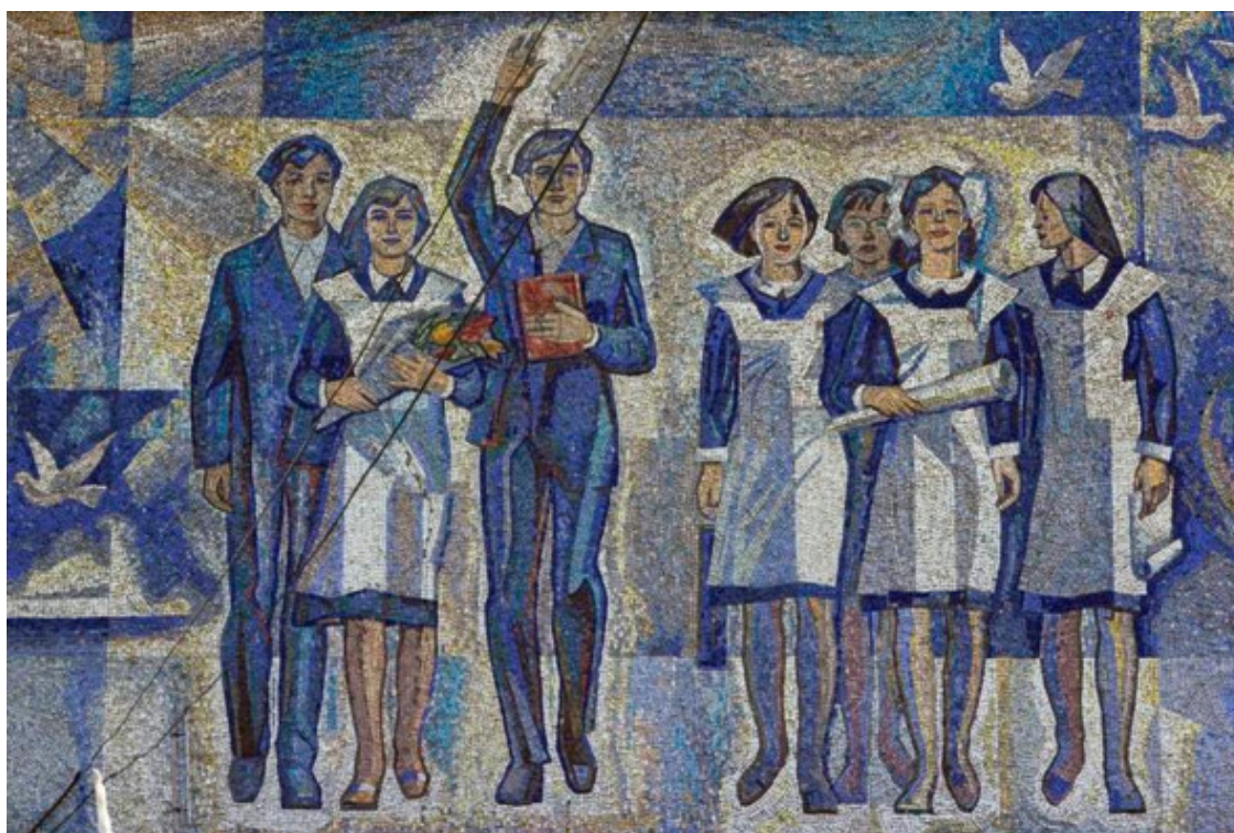
Советская молодежь. Мозаика

В начале 30-х гг. единая для всех союзных республик структура ВПО окончательно сложилась. Как и комсомол, она состояла из пионерских организаций союзных и автономных республик, областей и краев, автономных округов, районов, городов.