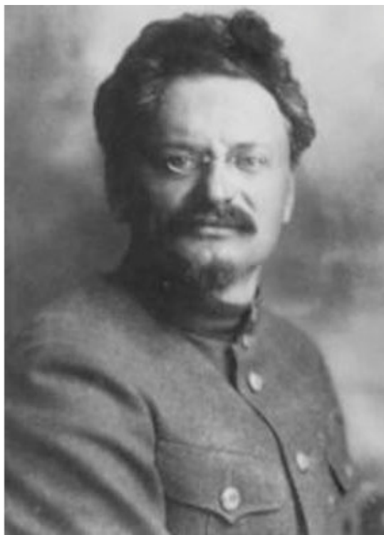
Лев Давидович Троцкий. Фотография неизвестного автора в журнале «Прожектор» за 1924 г

Л. Троцкий был наиболее категоричным противником приверженцев партийного авторитаризма и по идеологическим причинам: по его мнению, в преимущественно аграрных странах, которыми были советские республики, нельзя было долго удерживать социалистические завоевания по причине невозможности экономической конкуренции с развитыми промышленными странами капиталистической Европы.