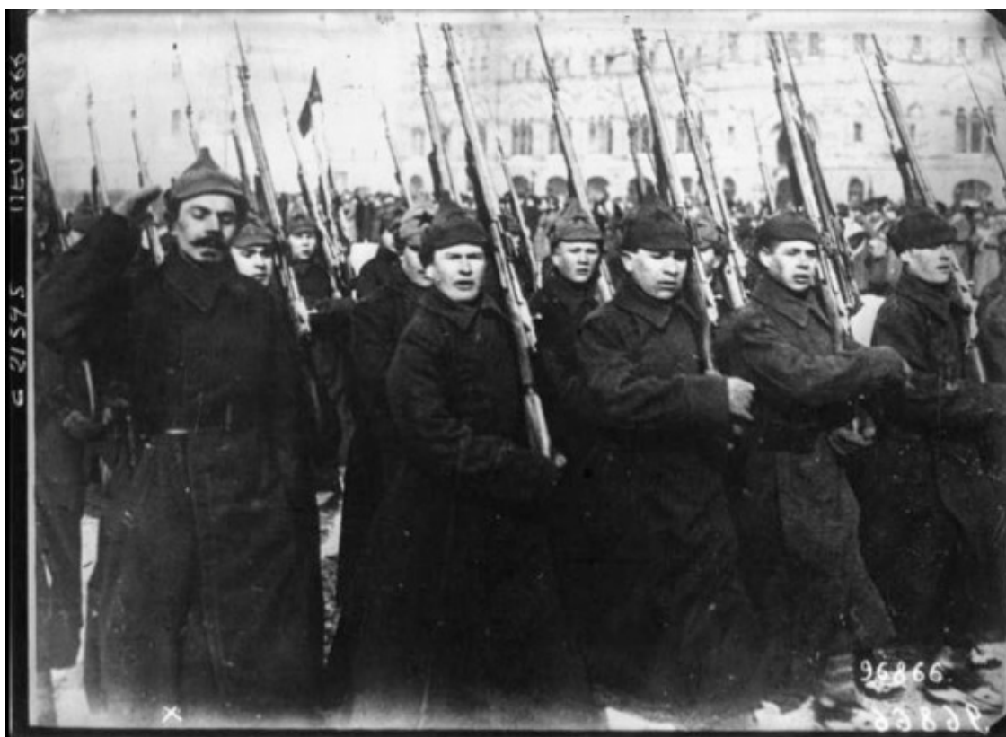
парад Красной Армии в Москве в 1922 г.

До 30-х гг. наиболее влиятельной политической силой в СССР была Красная Армия, силой оружия установившая на огромном пространстве бывшей Российской империи советскую власть и приведшая к верховному руководству большевиков. Соответственно, с армией больше всего приходилось считаться партийным комитетам.