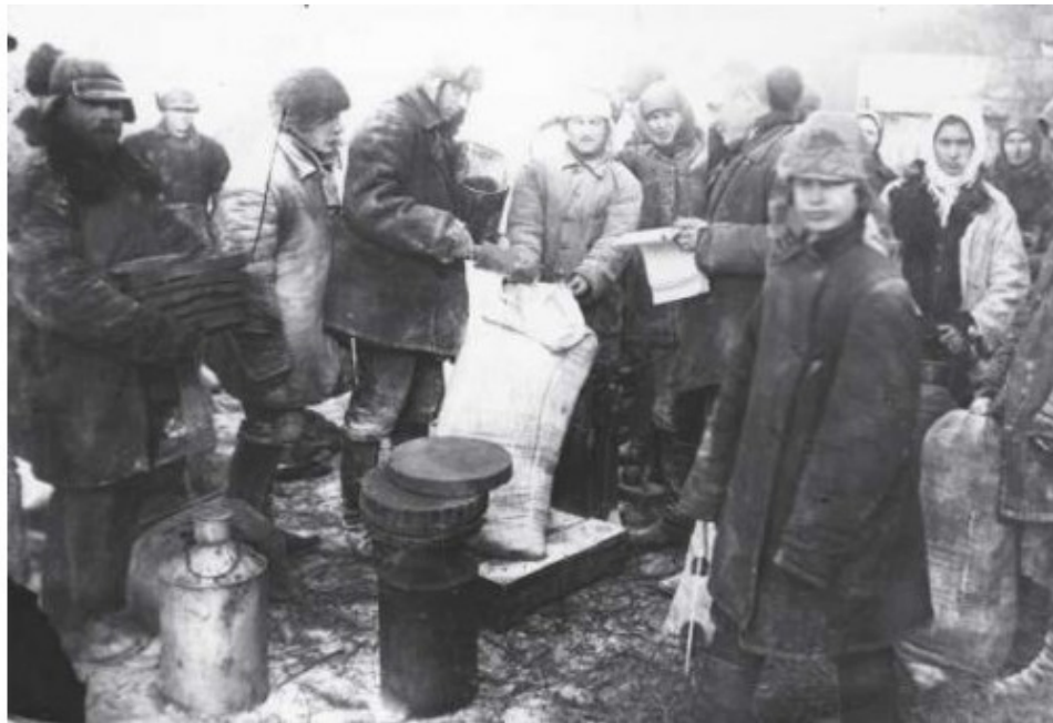
1933 г. Выдача продуктов колхозникам на трудодни, с. Удачное Донецкой области.