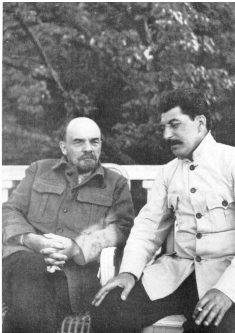
Ленин и Сталин в Горках в сентябре 1922 г.