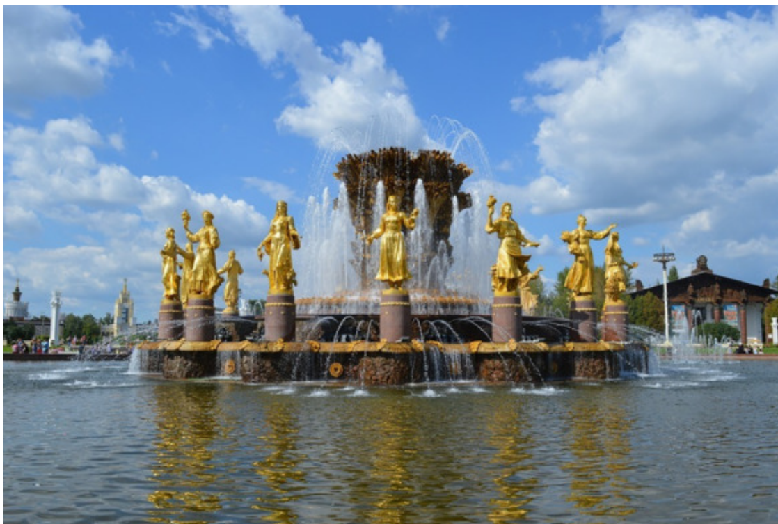
фонтан «Дружба народов» на ВДНХ

(АССР) и Юго-Осетинская Автономная область. Особенно много внутренних национальных автономий было в составе обширной, а потому многонациональной Российской Федерации.