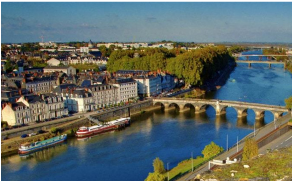
город Анжер (Анжу, Анже)

8 августа 1770 года в семье профессионального военного, будущего полевого маршала, графа Антуана Жозефа Элалия де Бомон д'Отишампа, в городе Анжере или Анжу (Анже), родился мальчик, названный при крещении Шарль Мари Огюст Жозеф де Бомон д'Отишамп.