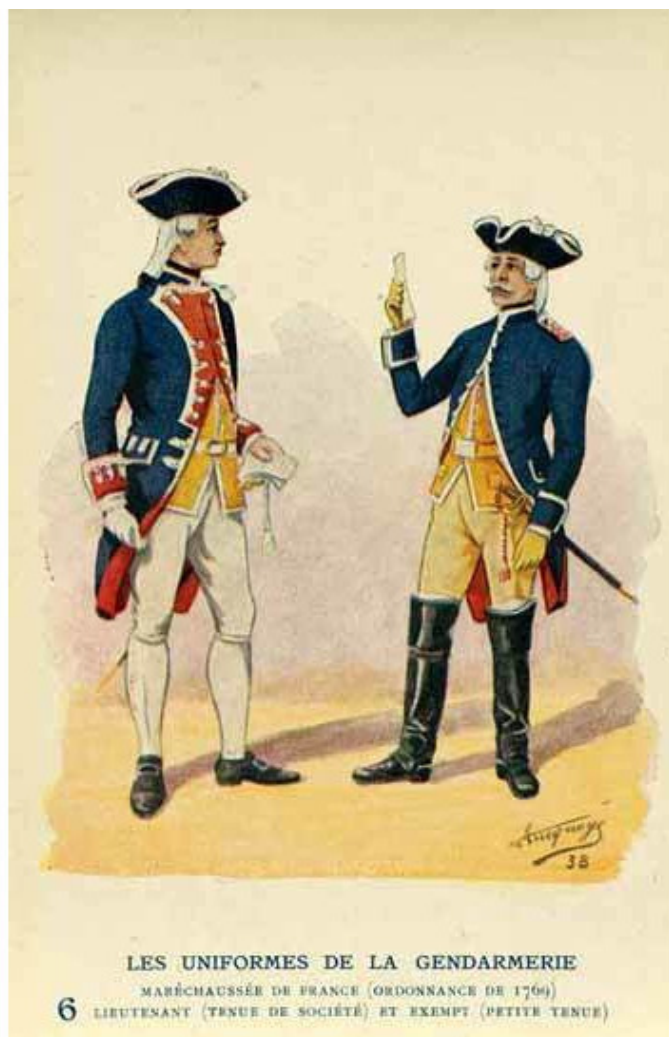
униформа корпуса Petite-Geandarmerie