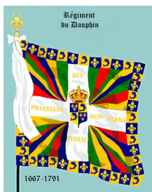
знамя «Полка Дофина»