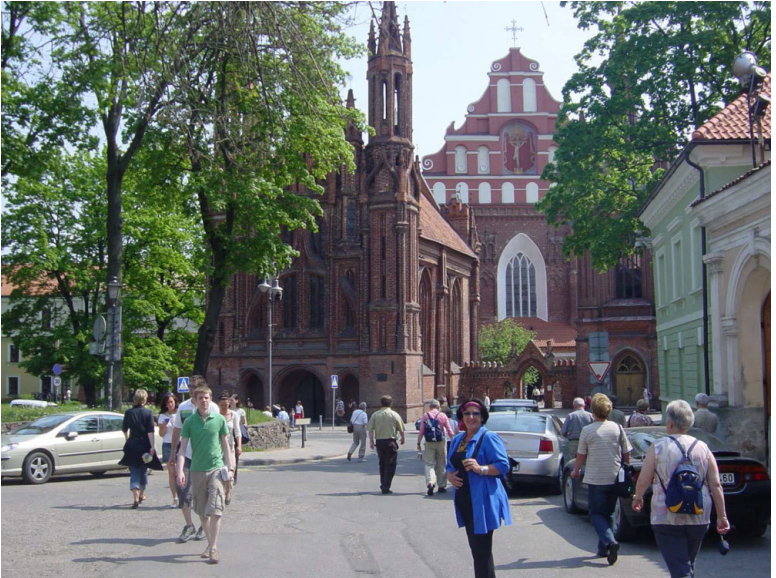
Bernhardiner Kirche mit Kloster

Die Annenkirche ist ein einzigartiges Beispiel nordeuropäischer Backsteingotik, der hl. Anna, Marias Mutter, geweiht. Das Bernhardinerkloster ist im Kern ebenfalls gotisch.