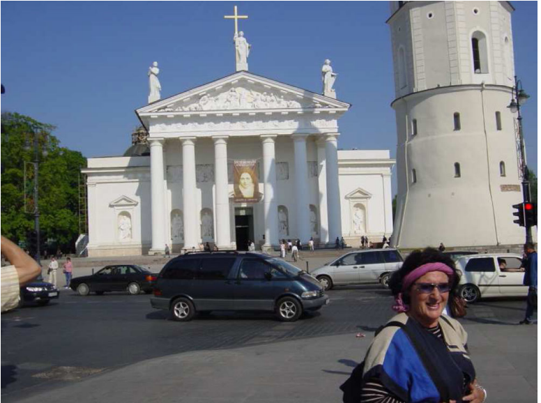
Kathedrale St. Stanislaus

St. Peter und Paul ein barockes Bauwerk, und trafen dort zufällig den litauischen Präsidenten Valdas Adamkus , als dieser nach einem kleinen Fest die Kirche verließ. In der Kirche gibt es Statuen vom hl. Augustinus und vom hl. Antonius ▼ und nahe der Kathedrale zeigte eine Statue die Ursprünge dieser Stadt, den Wolf und die Gründer der Stadt.