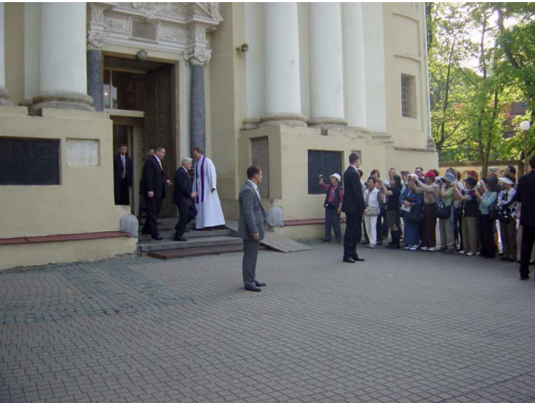
St. Peter und Paul