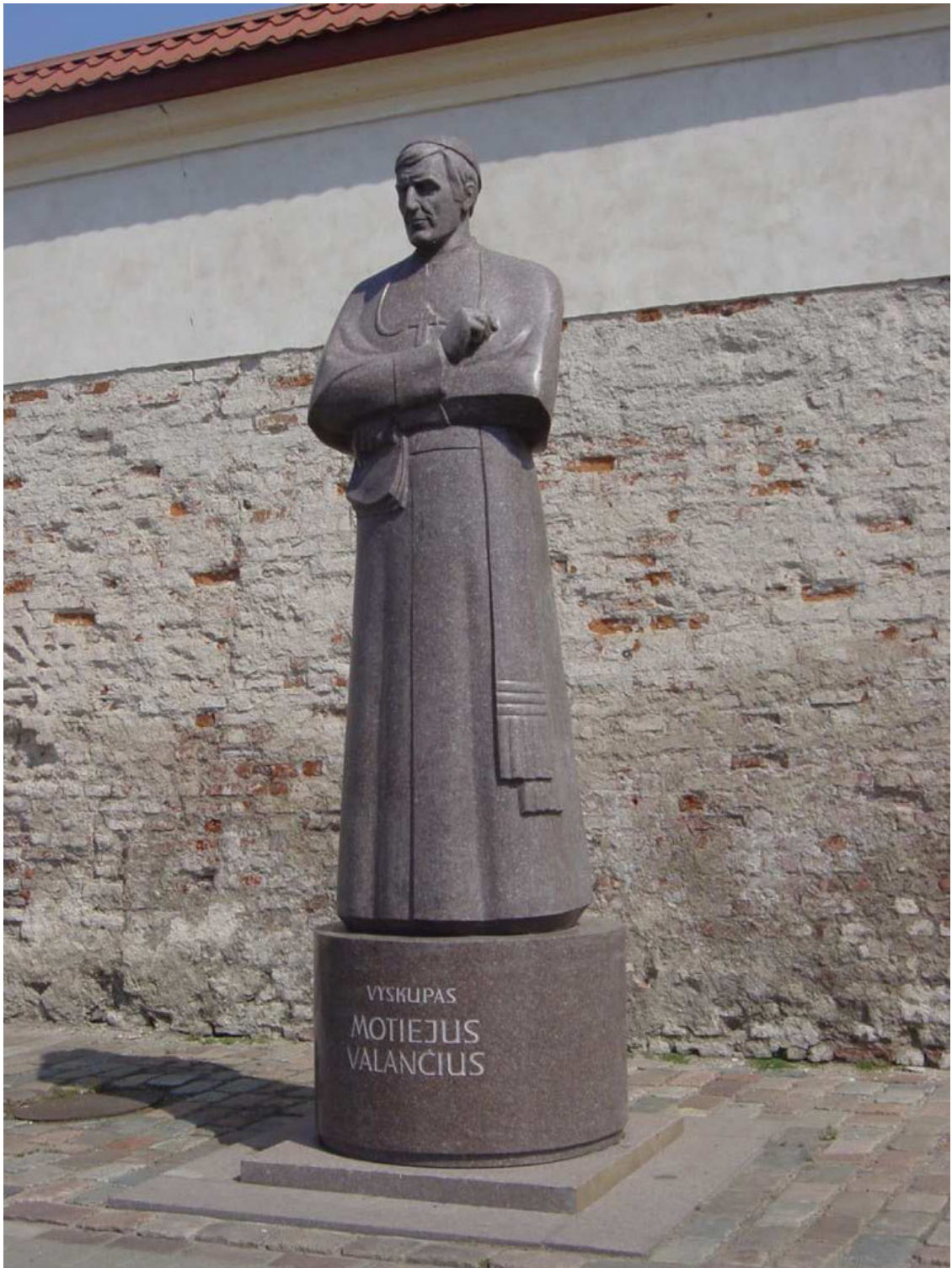
Ignazius von Loyola