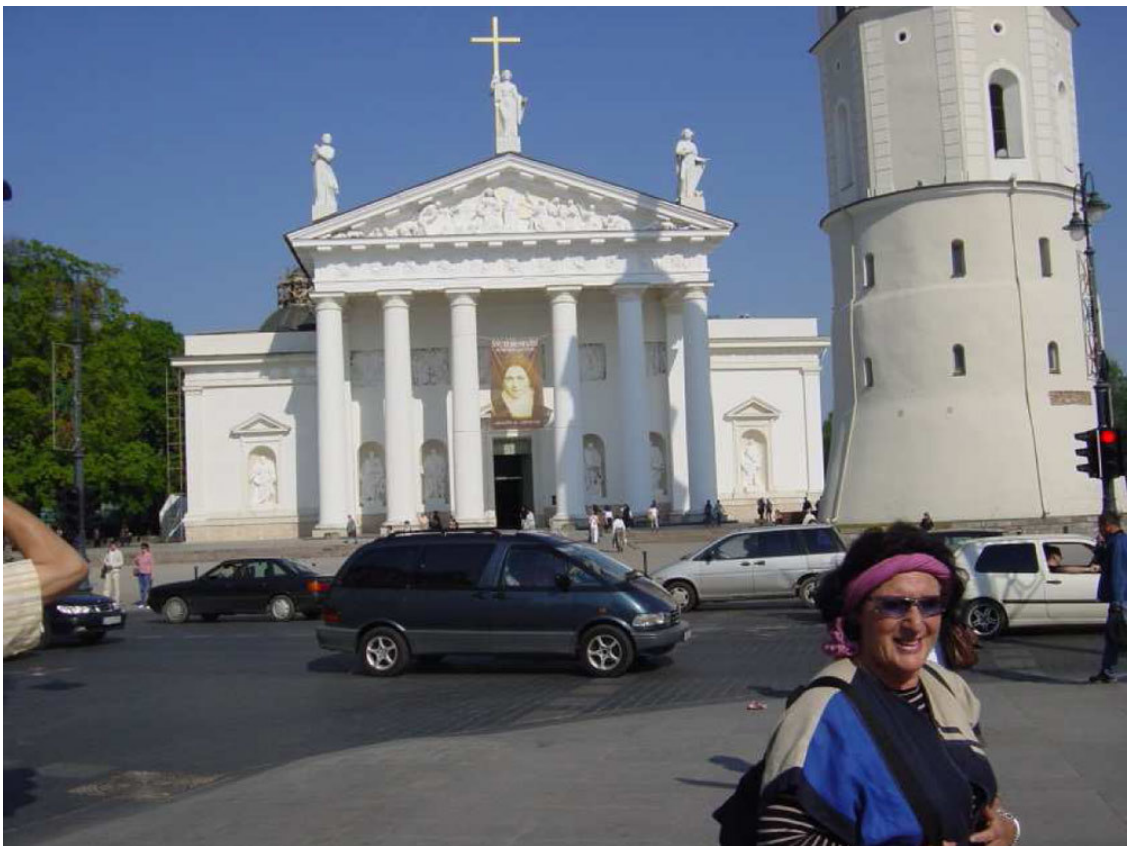
Kathedrale St. Stanislaus

Wir gelangten wieder zur Kathedrale St. Stanislaus , die Fürst Mindaugas 1253 erbauen ließ, gingen von dort zu Fuß zur Kirche St. Peter und Paul ein barockes Bauwerk, und trafen dort zufällig den litauischen Präsidenten Valdas Adamkus , als dieser nach einem kleinen Fest die Kirche verließ. In der Kirche gibt es Statuen vom hl. Augustinus und vom hl. Antonius ▼ und nahe der Kathedrale zeigte eine Statue die Ursprünge dieser Stadt, den Wolf und die Gründer der Stadt.