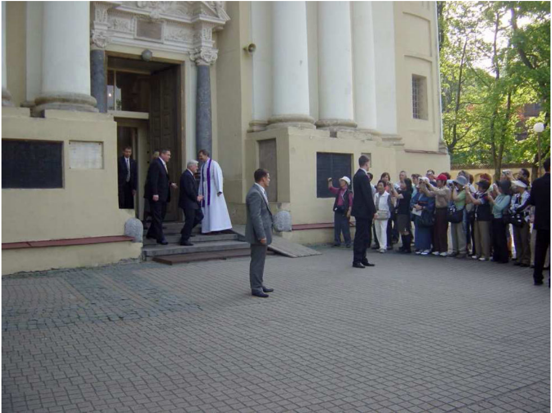
St. Peter und Paul