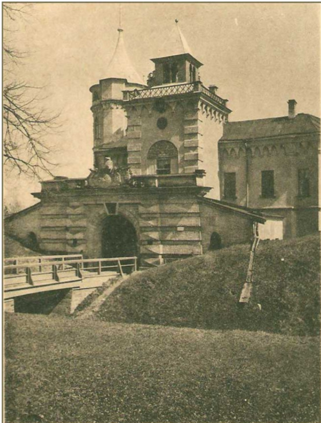
Павловскъ. Крѣпость Маріенталь.