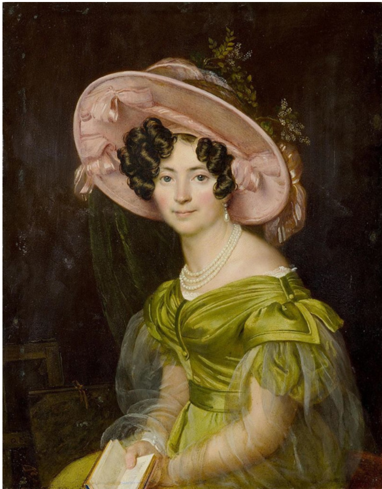
Среди рассеянной Москвы,