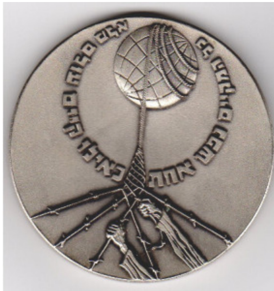
Медаль Праведника народов мира – 1