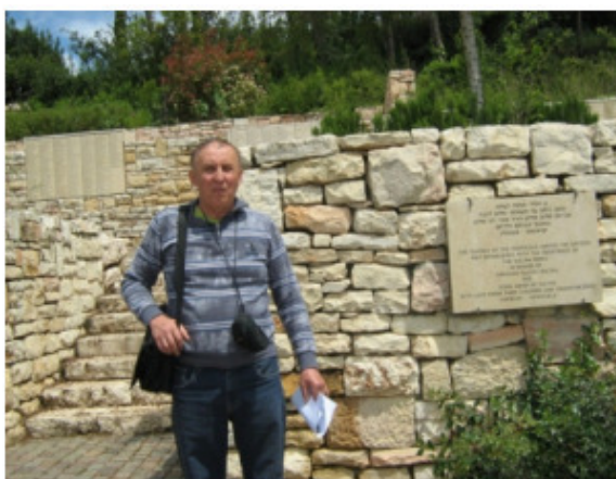
Стена Почета в саду Праведников народов мира в «Яд-Вашем» (1)