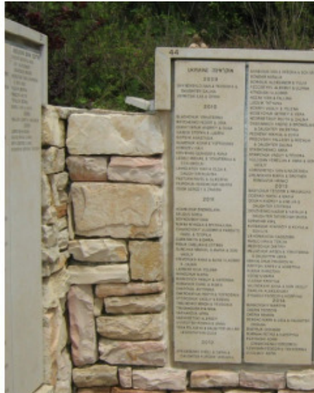
Стена Почета в саду Праведников народов мира в «Яд-Вашем» (2)