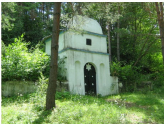
Фото 001: Мемориал «Шахта». На месте гибели евреев Дунаевец 8 мая 1942 года в селе Демьянковцы

Прошло более 75 лет с тех жестоких времен оккупации и уничтожения еврейского населения на территории моей родной Дунаевщины. Но, несмотря на такой далекий период, еще живы свидетели и жертвы Холокоста, которым уже под 90 лет и более, а также живые их дети, желающих знать, как выжили их родители, деды и кто им помог спастись от уничтожения. А также установлены новые сведения, кто принял мученическую смерть в шахте с. Демьянковцы (Фото №001) и во рвах Солонинчика. В «Книге Скорби Украины» в 4-х томах, Хмельницкая область. Издательство «Подолье» 2003 год, занесено незначительное количество таких жертв, например в урочище Солонинчик установлены фамилии погибших 100 человек.