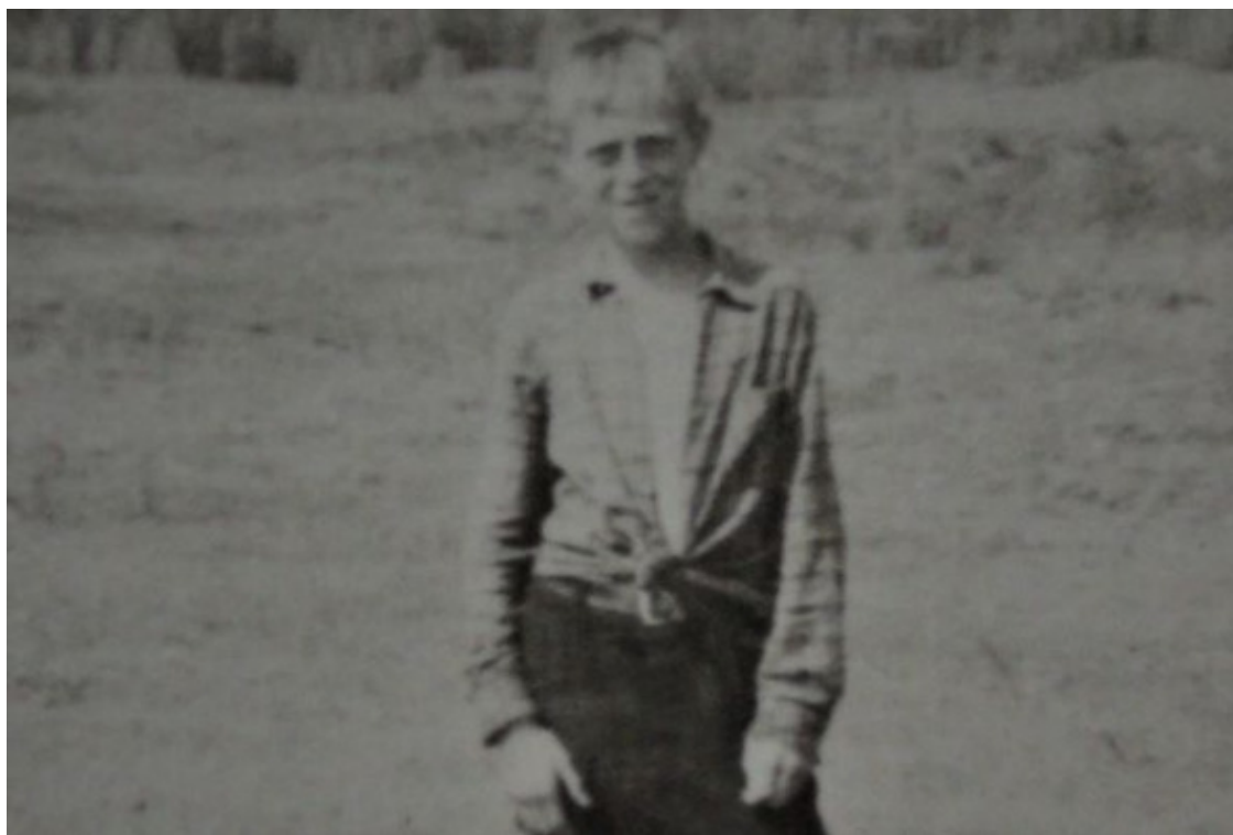
1970 год, село Косиха. Моя «хулиганистая» мода