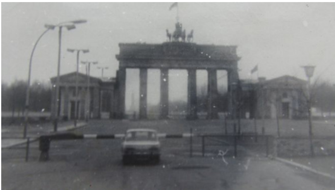
Бранденбургские ворота, сфотографированные из автобуса

На построении командир ПОЛКА объявил нам – участникам международного соревнования, как он сказал, БЛАГОДАРНОСТЬ. Ответив, «Служим Советскому Союзу», встали в строй. Я все ждал, когда же он меня спросит про продление отпуска и «пожурит», но ОН этого не сделал, как будто ничего и не было. Я все время думал, какая же громадная ответственность на НЕМ и при всем этом, какой он душевный Человек. Спасибо тебе ЗА ВСЕ, КОМАНДИР!!!