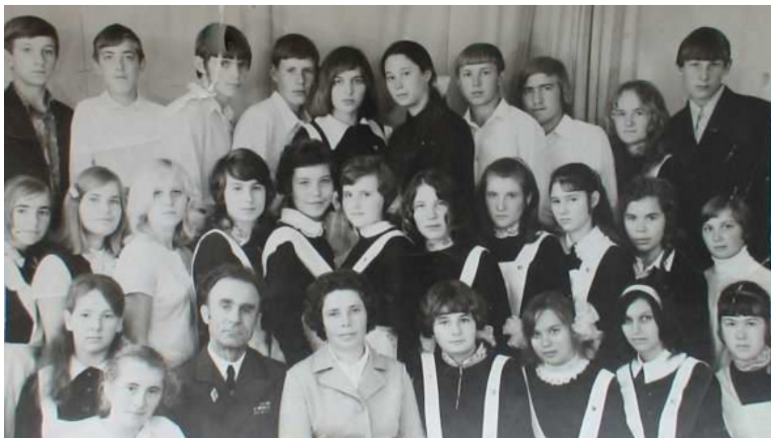
1975 год, село Красный Яр. Мои дорогие ОДНОКЛАССНИКИ и преподаватели!!!

В нашей семье не было фотографа-любителя, и до 18 лет у меня совсем мало фотографий. Сам я начну этим заниматься только с рождением моего сына. А в 1986 году, когда ему было шесть лет, начал снимать его на видео. Сколько бы я сейчас отдал за то, чтобы увидеть себя шестилетнего на видео, но это возможно только в мечтах и снах.