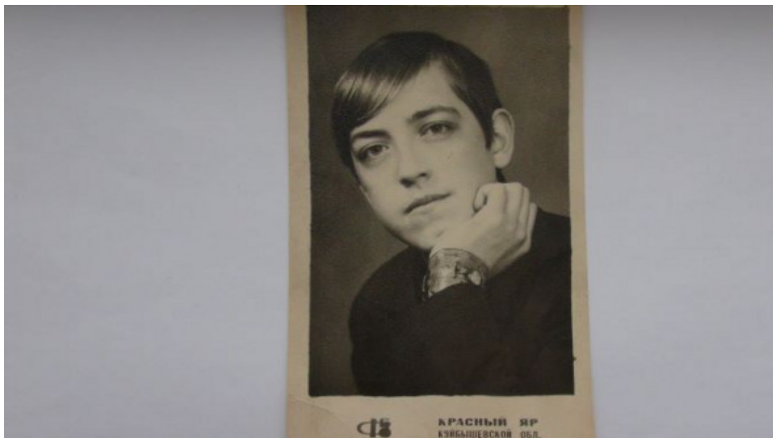
1973 год, село Красный Яр, Куйбышевской области. Мне 15 лет