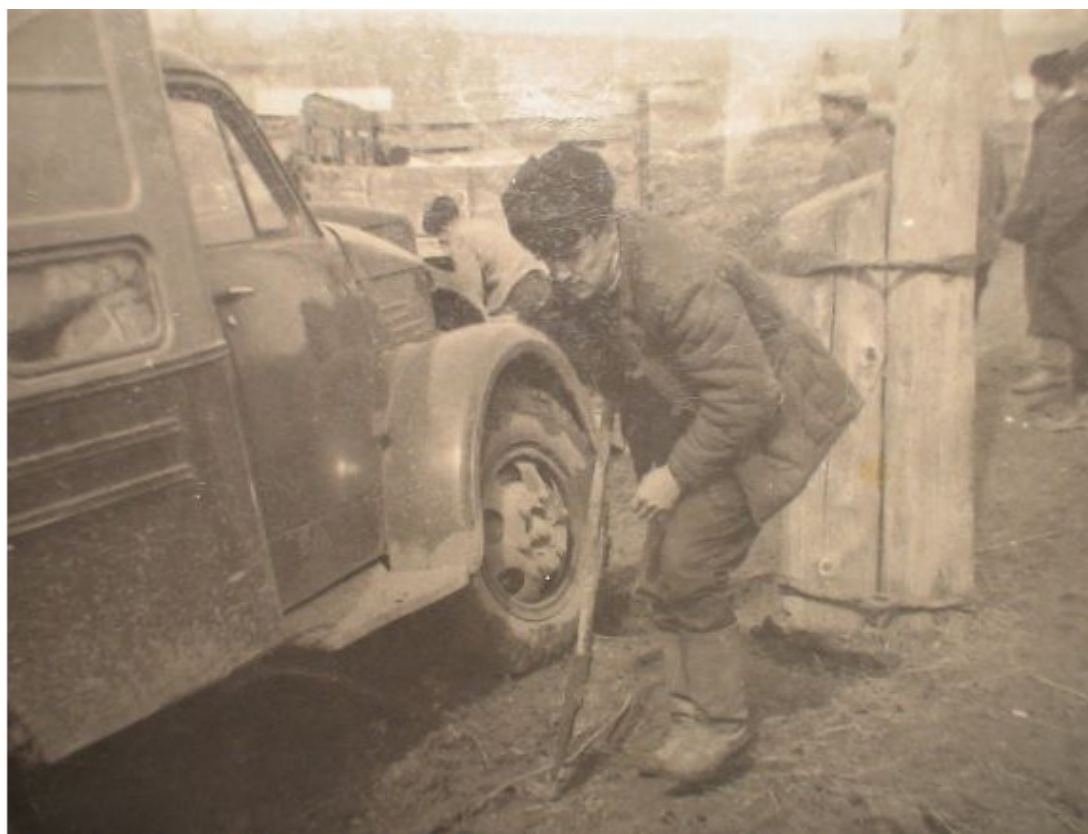
1970 год, село Косиха, улица Рабочая. Мой Папа в деле