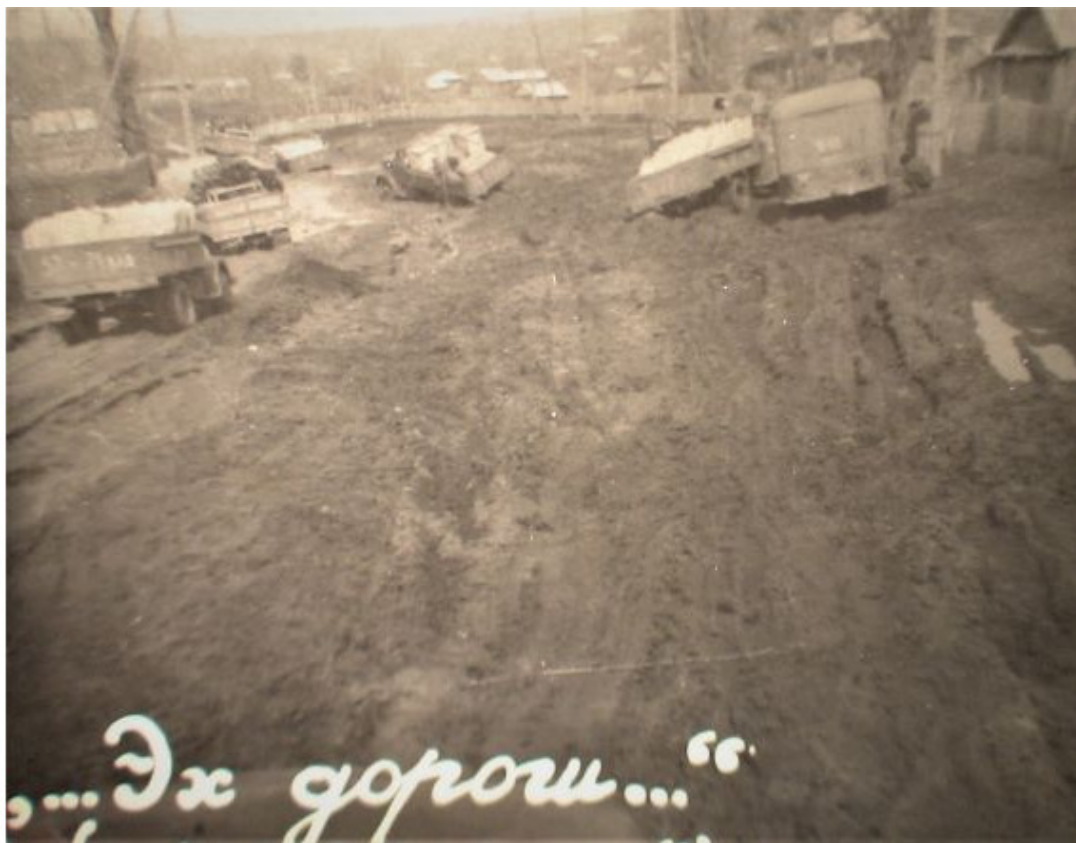
1970 год, село Косиха, улица Рабочая. Справа застряла Папина «автолавка», ОН присел и смотрит, что же можно сделать, чтобы выбраться из этого «болота»