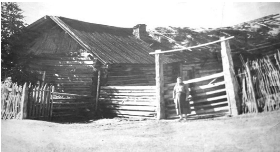
В таком доме бабушка с детьми осталась после раскулачивания