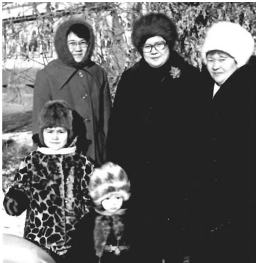
Мама с дочками и внуками на праздничных улицах