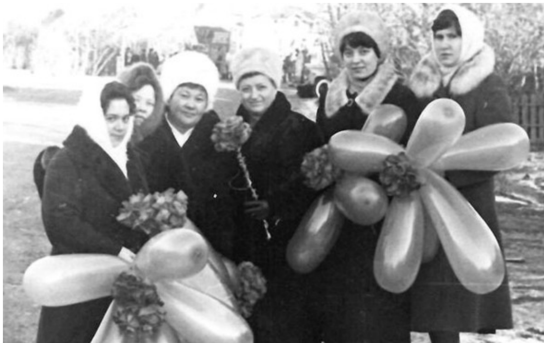
Всем отделением – на демонстрацию!