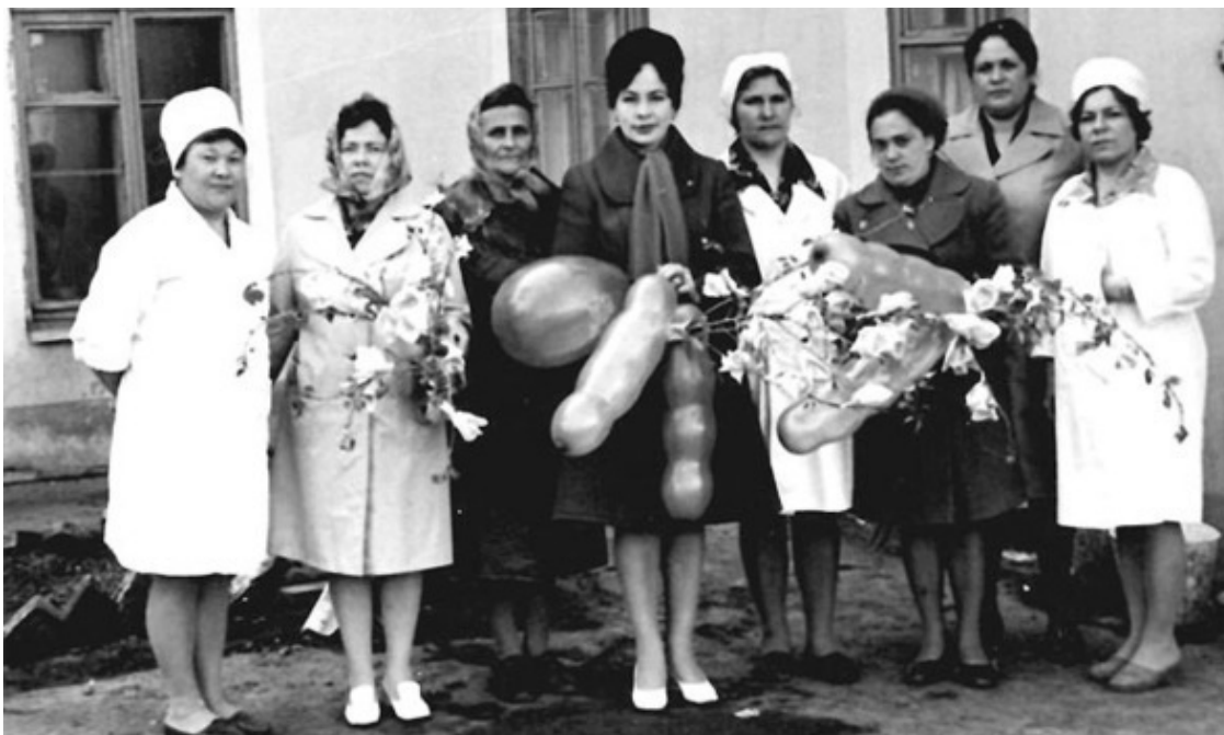
Все на демонстрацию, а мама на дежурство

И для чужих людей сделала она много добра. Двери нашего небольшого дома, как и сердце нашей милой мамы, всегда были открыты. В те годы автобусы от райцентра до сёл не ходили, многие деревенские ночевали у нас. Для всех мамочка находила место, кормила и поила чаем. Если родственники или знакомые попадали в больницу, мама обязательно собирала передачу и шла навестить.