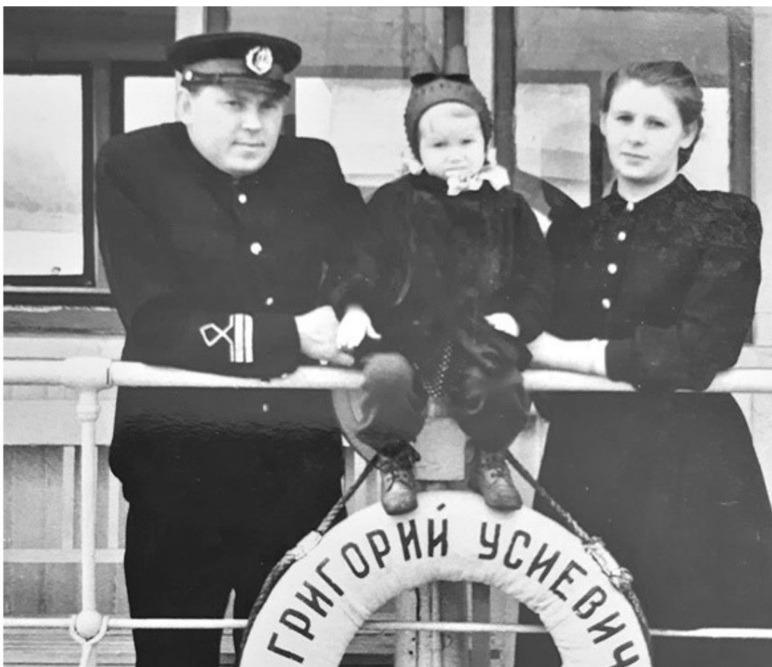
Папа, мама и я. 1959 г.

В 1961 и 1962 гг. был в командировках в ГДР: из Магдебурга переплавляли суда в Омск. На работе и с моей будущей мамой познакомился: папа капитан, мама радист.