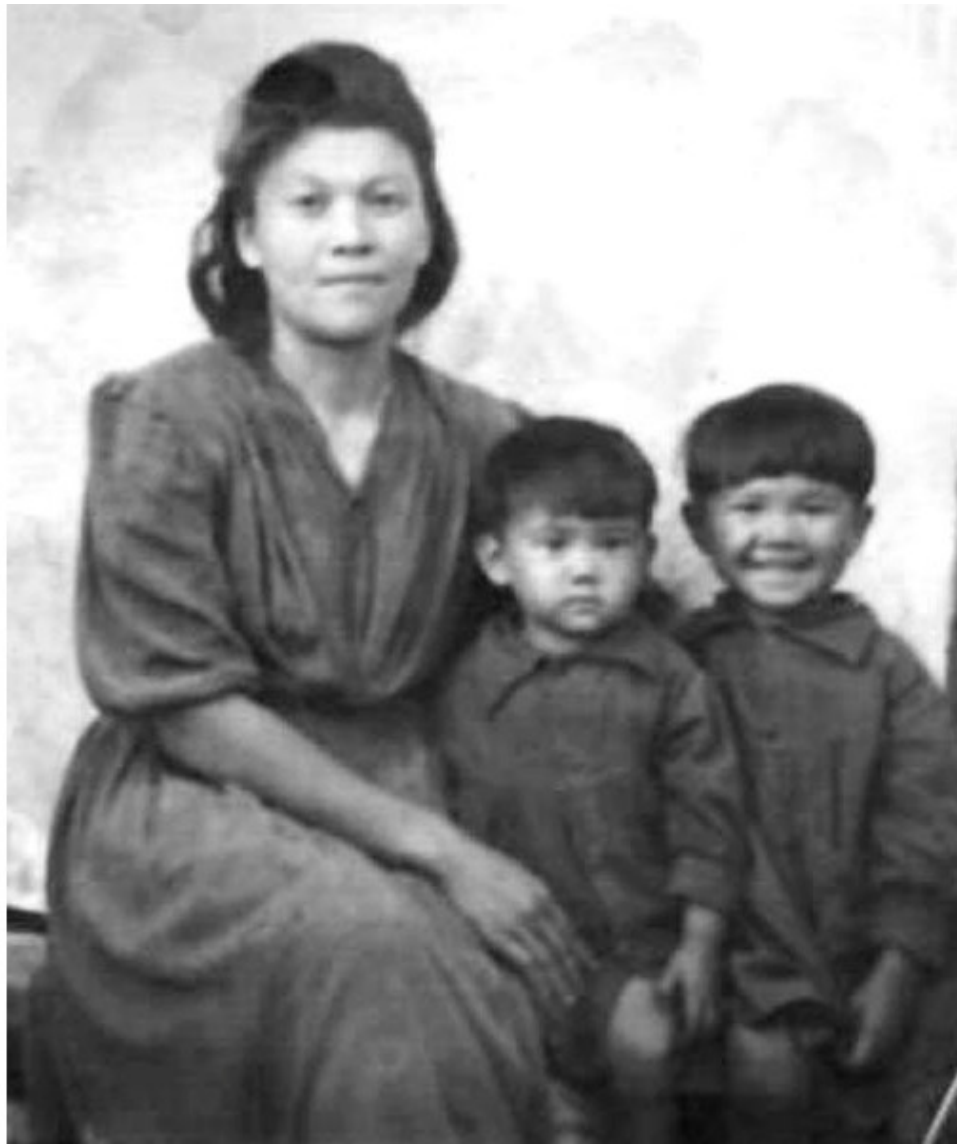
Счастливая мама с дочками, папа еще жив