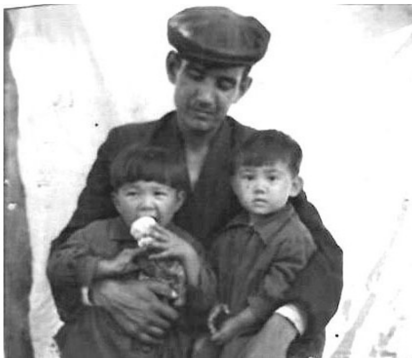
Счастливыи папа держит на коленках своих дочек