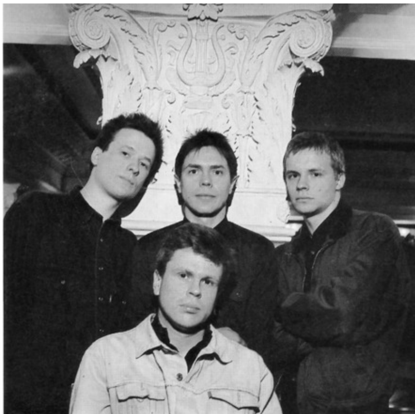
«ЦЕНТР», 1988 год фото с миньона фирмы «Мелодия»