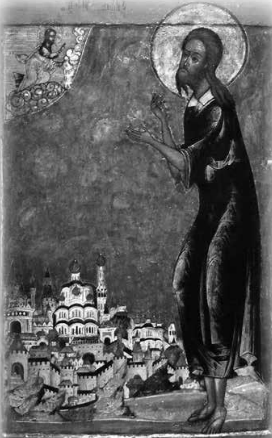
Св. Алексий, человек Божий

Юноша сел на корабль и отправился в далёкое путешествие. Но не заморские страны влекли его, не желание найти неведомые богатства или совершить военные подвиги – он желал