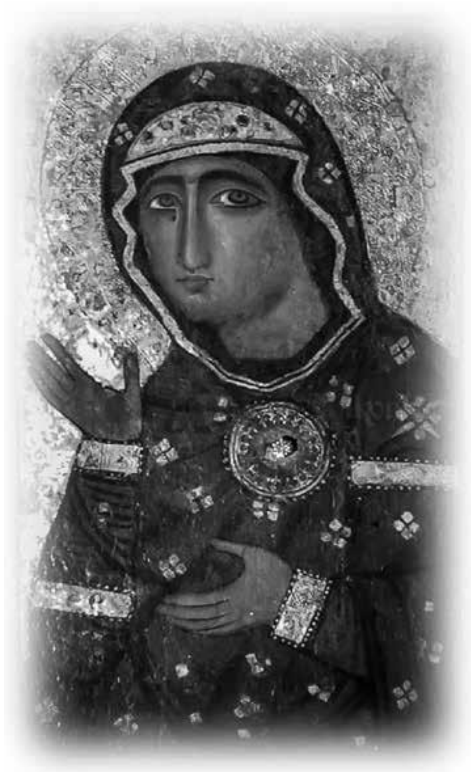
«Мадонна ди Сант-Алессио» («Мадонна святого Алексея»), или Божия Матерь «Эдесская»

В течение еще семнадцати лет жил Алексей в родном доме как слуга, пребывая в сугубом посте и молитвенном бдении. Родители видели в нём подвижника и относились к нему с почтением, а слуги завидовали, нередко оскорбляли и унижали, но святой принимал оскорбления смиренно, без ропота.