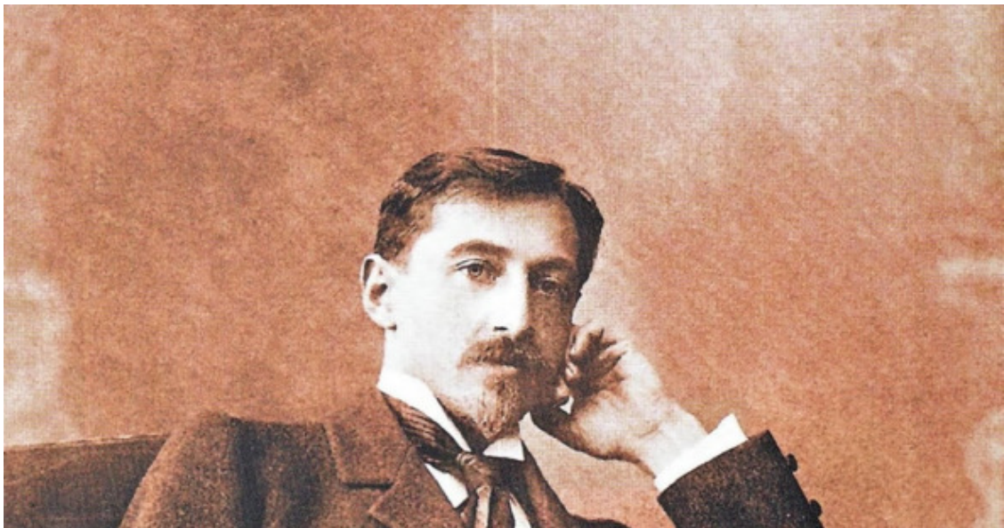
Иван Алексеевич Бунин

– Аннушка! Я рад встречи с тобой. Как ваше плавание, все ли было удачно?