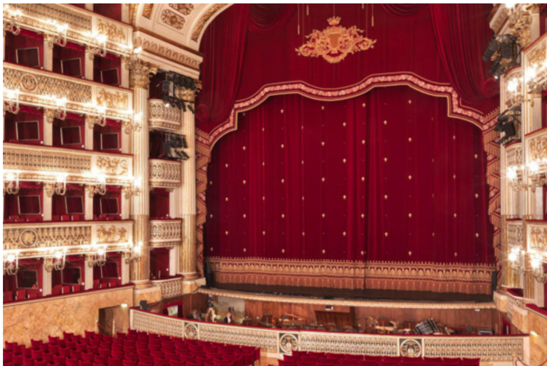
Сцена театра «Сан-Карло» в Неаполе

В начале следующей недели наши леди расположились на палубе небольшого парходика «Мафальда» следующего на остров Капри, который еще древние римляне называли «Волшебным», «Сказочным».