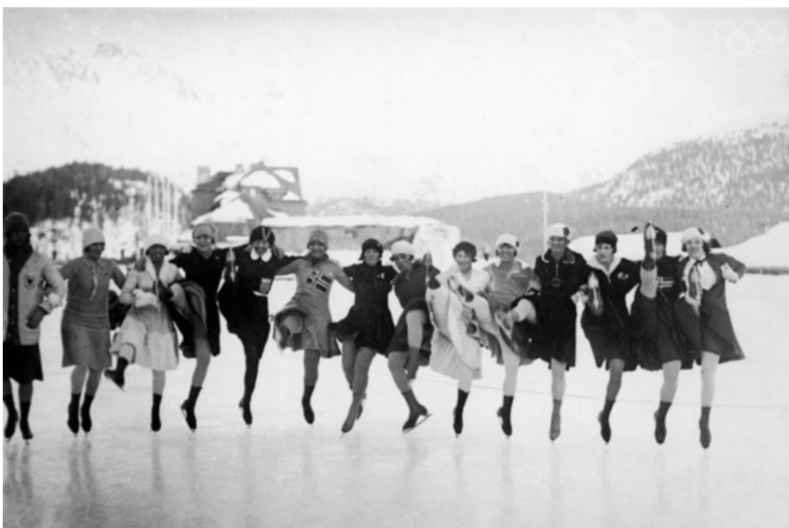
Весело на катке