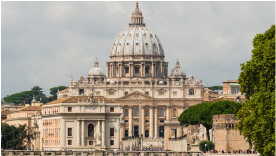
Собор Святого Петра

– Посчитаю за честь, Ваше Превосходительство!