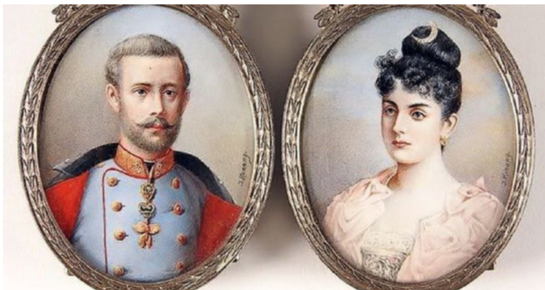
Австрийский кронпринц Рудольф и румынская баронесса Мария Вечера

Расследованием установлено, что Рудольф, после ночи любви, застрелил Вечеру, привел в порядок постель, уложил на нее труп, покрыл его шелковым покрывалом, на которое разбросал цветы, а затем застрелился сам. Ему было всего 30 лет, ей – 17.