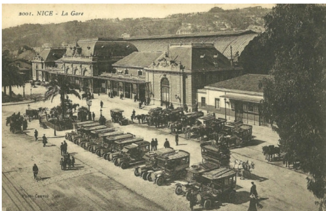
Вокзал в Ницце. Фото 1900 г.

В это же время в России железная дорога дошла до Варшавы, а отдельная ветка – до Пруссии. От Варшавского вокзала в столице Империи на Лазурный берег стали регулярно отправляться богато оборудованные вагоны.