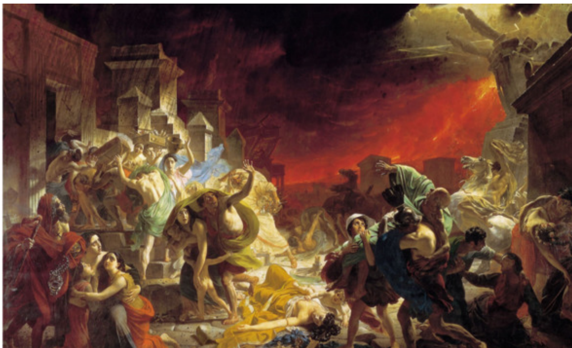
К. Брюллов «Последний день Помпеи»

Поговорили и о недавнем сенсационном событии — автопробеге отечественного автомобиля «Руссо-Балт», проходившем по маршруту Санкт-Петербург – Берлин – Сен-Готард – Рим – Неаполь – Берлин – Санкт-Петербург. В пробеге автомобиль преодолел более 10 тысяч км, в том числе и подъем на Везувий. 35