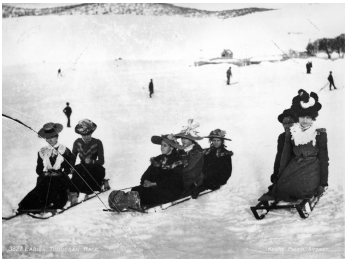
Катание на санях