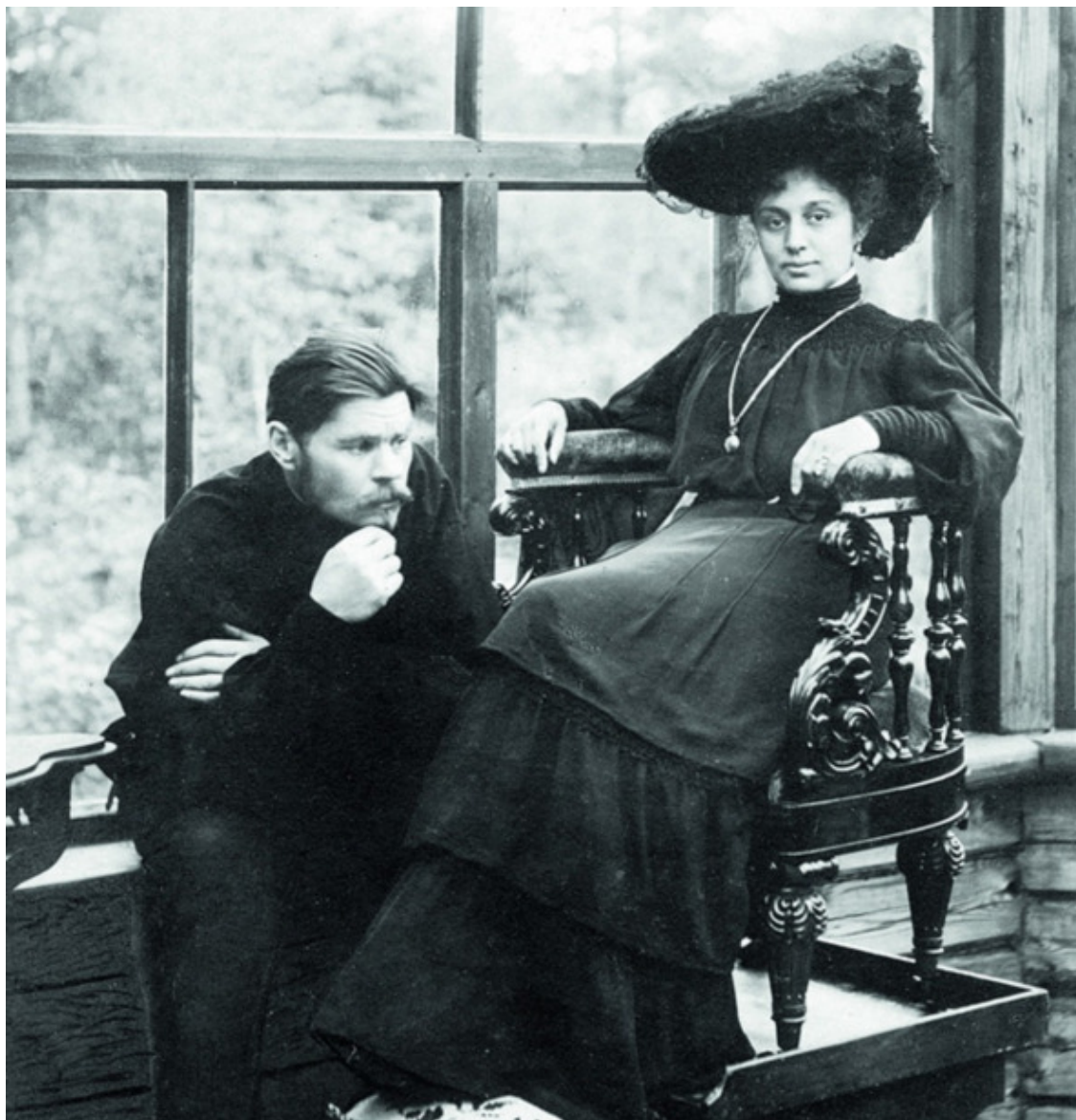
Максим Горький и Мария Андреева

Внутри можно было попасть на лодке, но из-за низкого входа в штормовую погоду грот становился недоступен. Долгое время грот считался неприступным, но в августе 1826 года немецкий поэт и живописец Август Копиш вплавь проник в Голубой грот. За ныряльщиком сквозь призму воды хлынул свет, окрасив скалистый свод и кристальное озеро внутри горы лазурной рябью перевернутого неба. Спустя двенадцать лет Копиш поведает о своей вылазке в рассказе «Открытие Голубого грота» и тем самым положит начало паломничеству просвещенных путешественников в пещеру, куда можно войти только со стороны моря. В 1838 году под низкий край утеса в двух аршинах над водой, распластавшись на дне лодки, протиснулся и русский писатель Н. В. Гоголь.