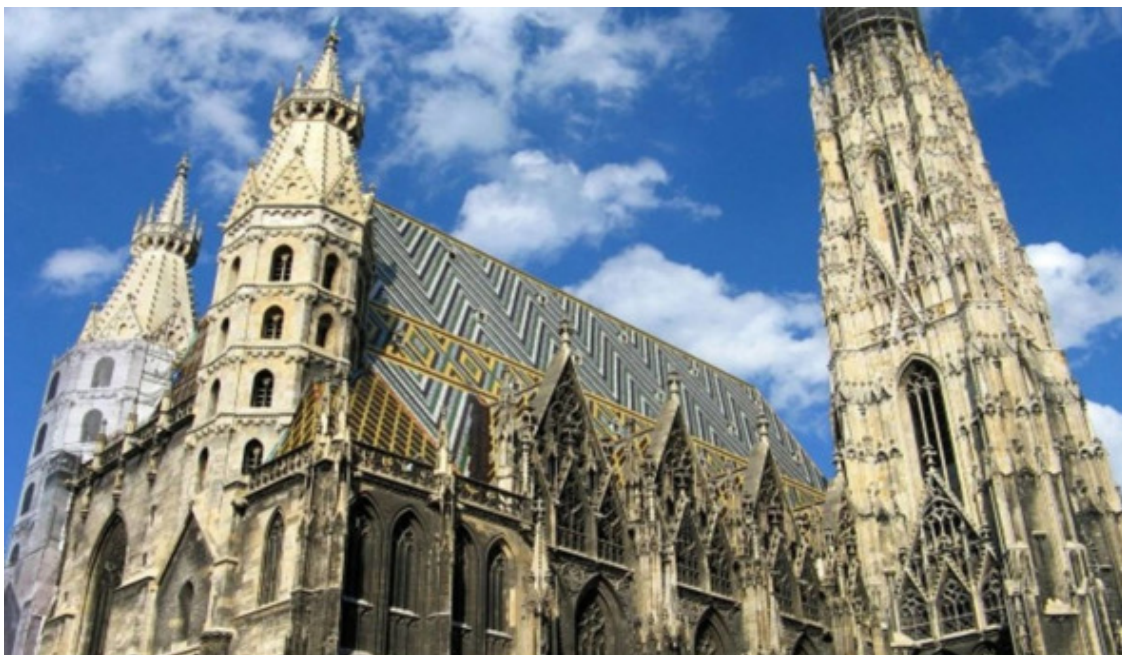
Собор Святого Стефана

Сегодня, осматривая собор Святого Стефана Анна сказала мне: «A thing of beauty is a joy for ever» – «Прекрасное пленяет навсегда». 71