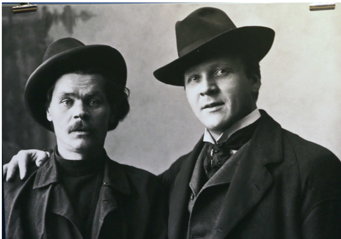
А. М. Горький и Ф. И. Шаляпин

– Барин! Коробка конфет стоит рубль, а она давала мне на чай три рубля... Вот я и решил подработать!