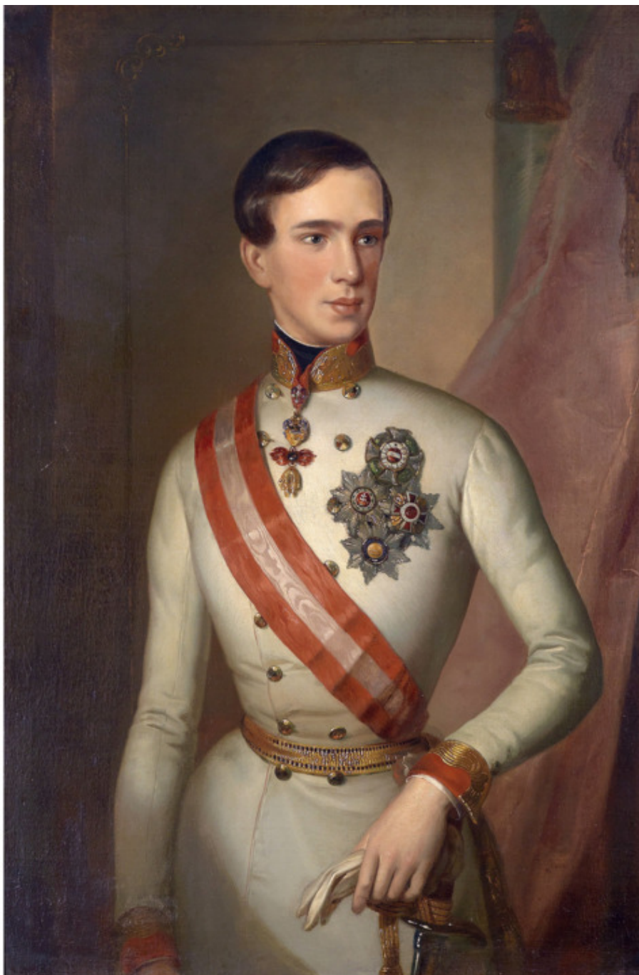
Франц-Иосиф I в 1849 году

Однако политика мадьяризации натолкнулась на сопротивление славянских народов, привела к росту межнациональной напряженности и широкомасштабной войне, в которую оказалась вовлечена даже Россия: боевые действия между отрядами венгерской и австрийской армиями были осложнены стычками со славянским ополчением и интервенцией русской армии генерал-фельдмаршала И. Ф. Паскевича (106 000 штыков), которая располагалась у южных границ Царства Польского и была назначена в поход для усиления австрийских войск. В результате революцию ждало поражение. Независимость Венгрии была отложена на 70 лет, а венгры лишились своих позиций в Трансильвании, Словакии и Воеводине.