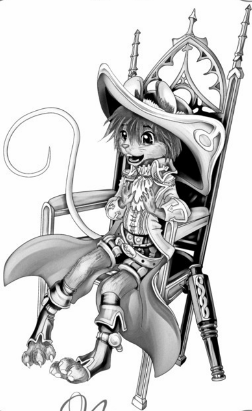
Иллюстрация для Серии Книг: «Марк и Асрин»