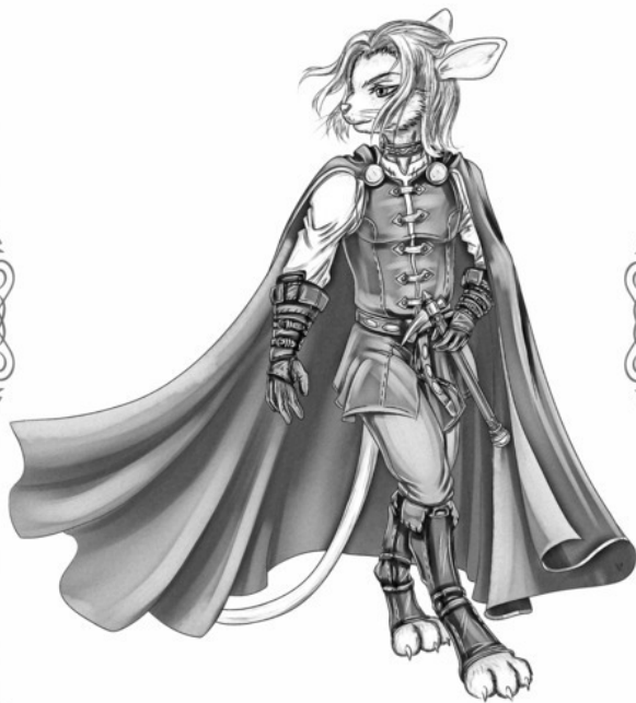
Иллюстрация для Серии Книг: «Марк и Асрин»