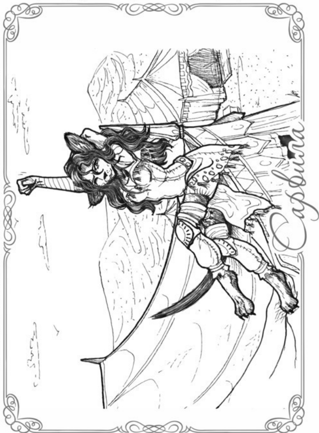
Иллюстрация для Серии Книг: «Марк и Афин»