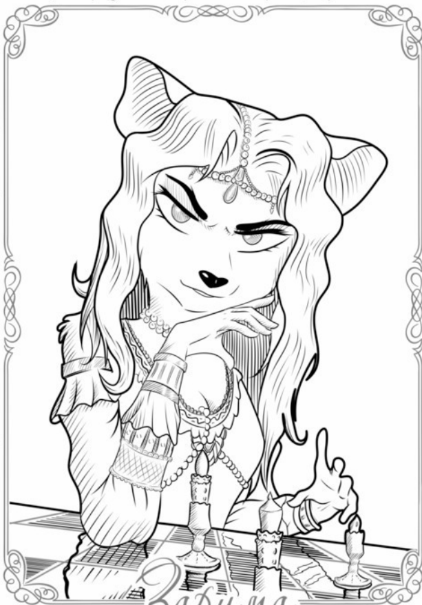
Иллюстрация для Серии Книг: «Марк и Асрин»

Художник/Дизайн Костюма: Чикоголай Кондратов - Nиконитстал