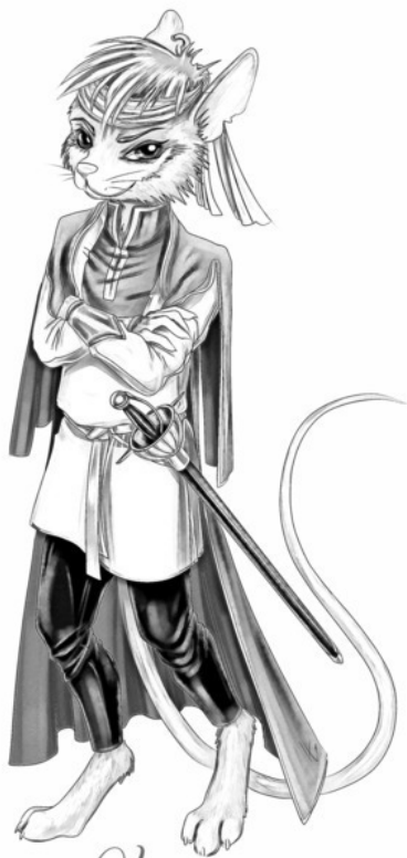
Иллюстрация для Серии Книг: «Марк и Афин»