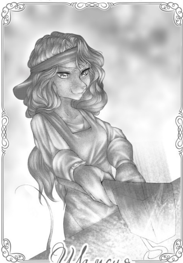
Иллюстрация для Серии Книг: «Марк и Асрин»