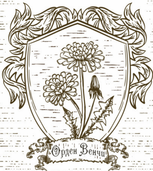
Иллюстрация для Серии Книг: «Марк и Арин»

«Пусть цветок, символизирующий Орден Венчи, завянет со временем, но наши Цели никогда не померкнут и не угаснут в ночи...»