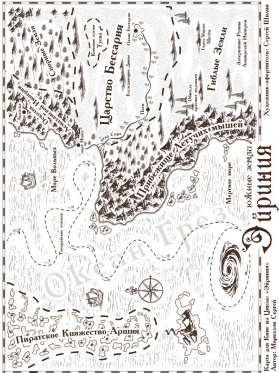
Карта для Книг из Цикла: «Эйриния» Автор: Маркелов Сергей