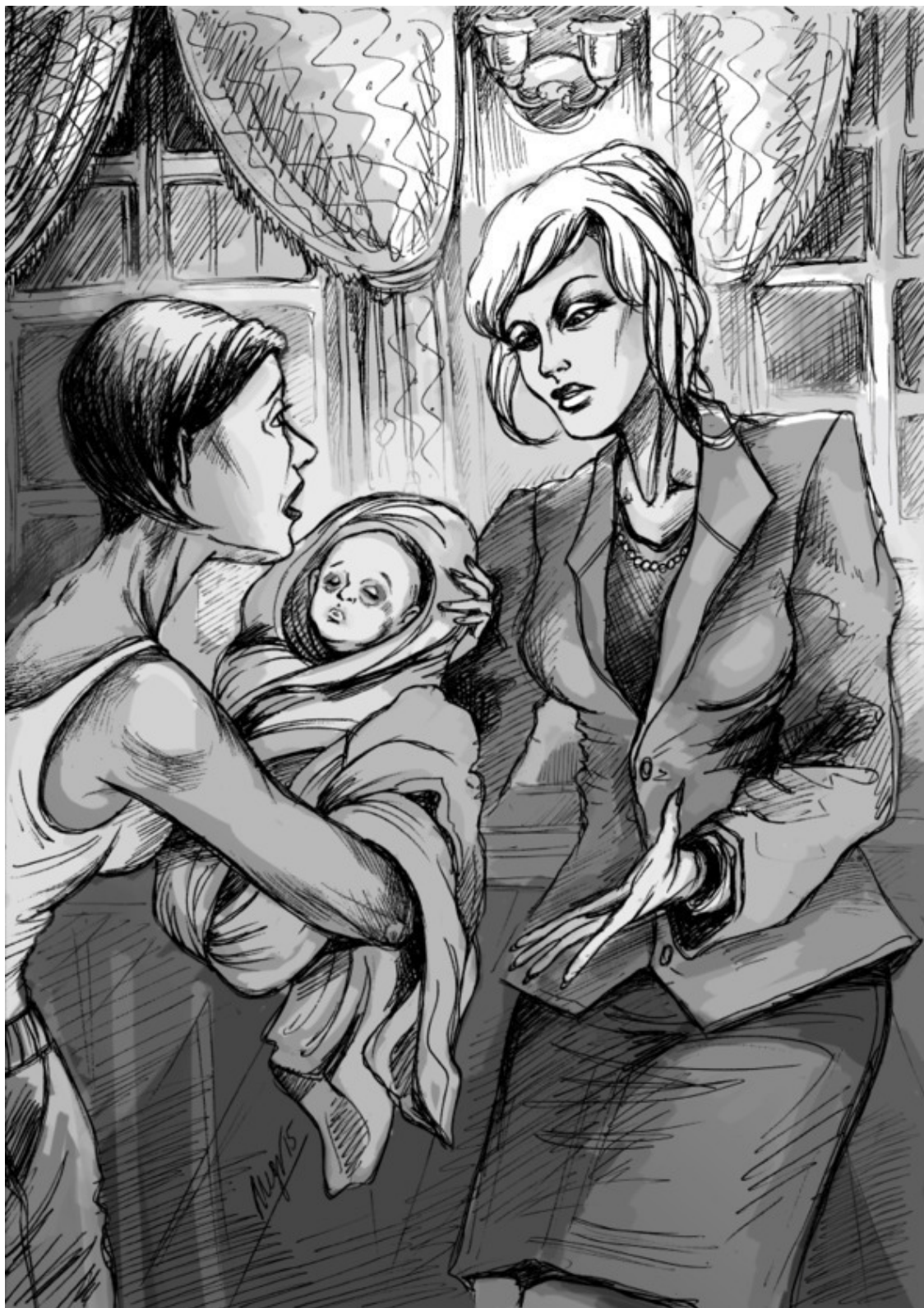
Иллюстрация © Е. Медник