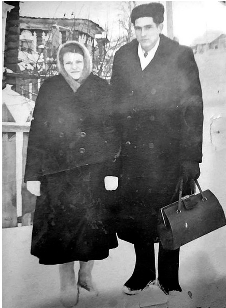
Мама и папа