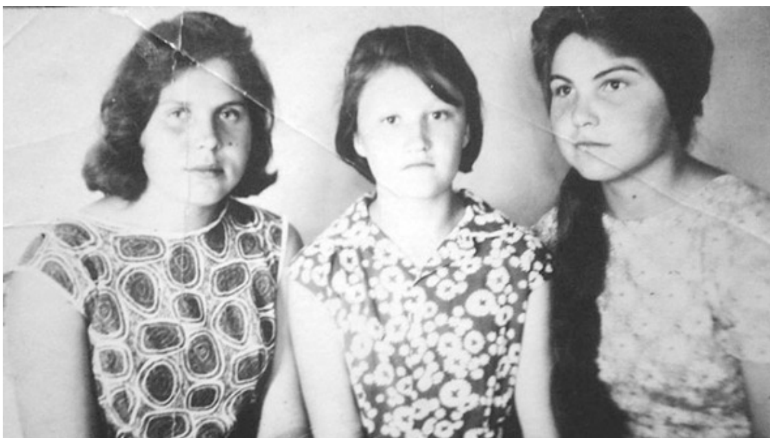
Моя мама (справа) и ее школьные подружки. Евгацино