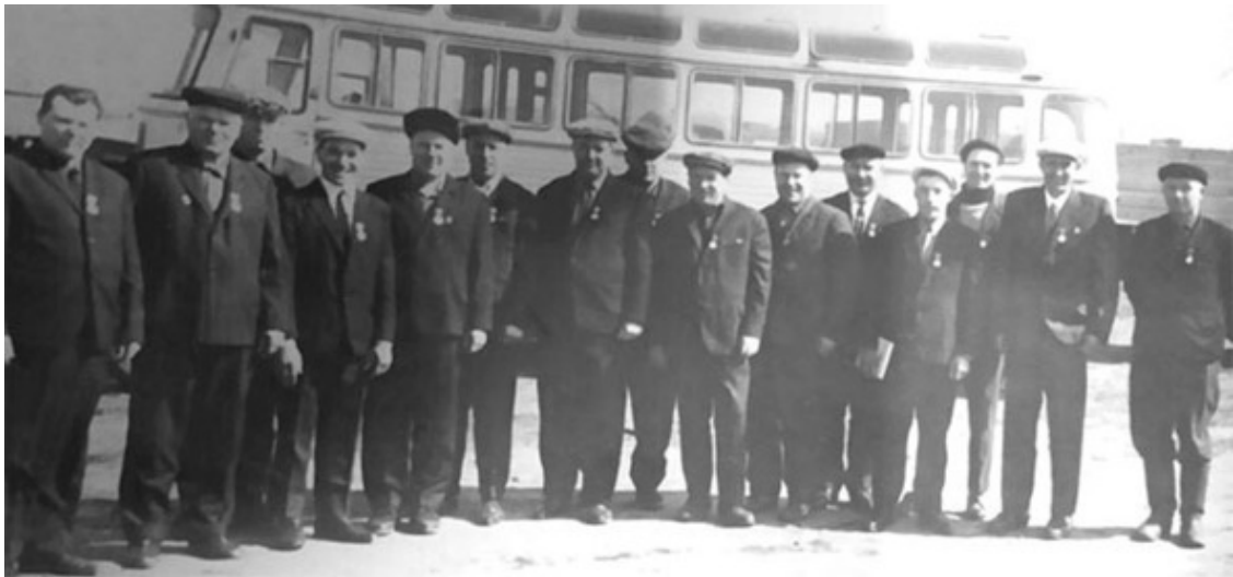
Лучшим работникам АТП-35 вручили ордена. Папа второй справа

Папа был очень весёлым, добрым человеком. Его любили в коллективе и до сих пор вспоминают о нем только хорошее, какие-то добрые истории или смешные забавные случаи.