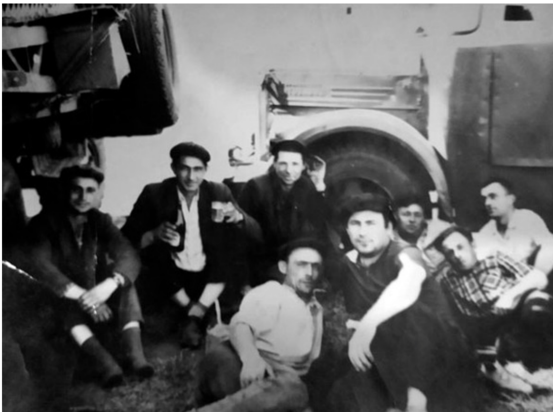
Уборочная. Отец на заднем плане в центре