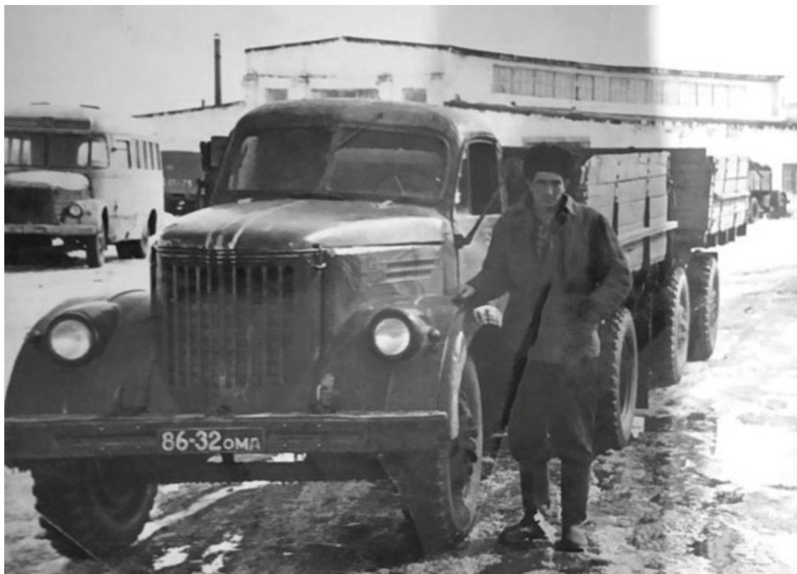
Отец на работе

Папа был очень красивый: чернявый, высокий, всегда чистый. А какие у него были чёрные хромовые сапоги, в них же как в зеркало можно было смотреться!