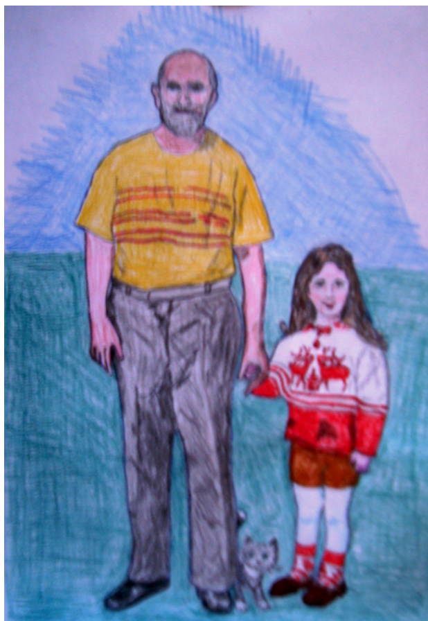
Всем моим внукам и внученьке

Уважаемые родители – мамы, папы, а также бабушки и дедушки, старшие сёстры и братья! Ваш малыш или малышка уже подрос или подросла настолько, что слушать коротенькие стишки Агнии Барто стало не интересно. Попробуйте почитать самые первые рассказы из этой книжки. Возможно, ребёнок заинтересуется незатейливыми сюжетами этой части книги.