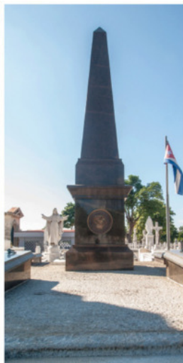
Tumba del Generalísimo Máximo Gómez Baez